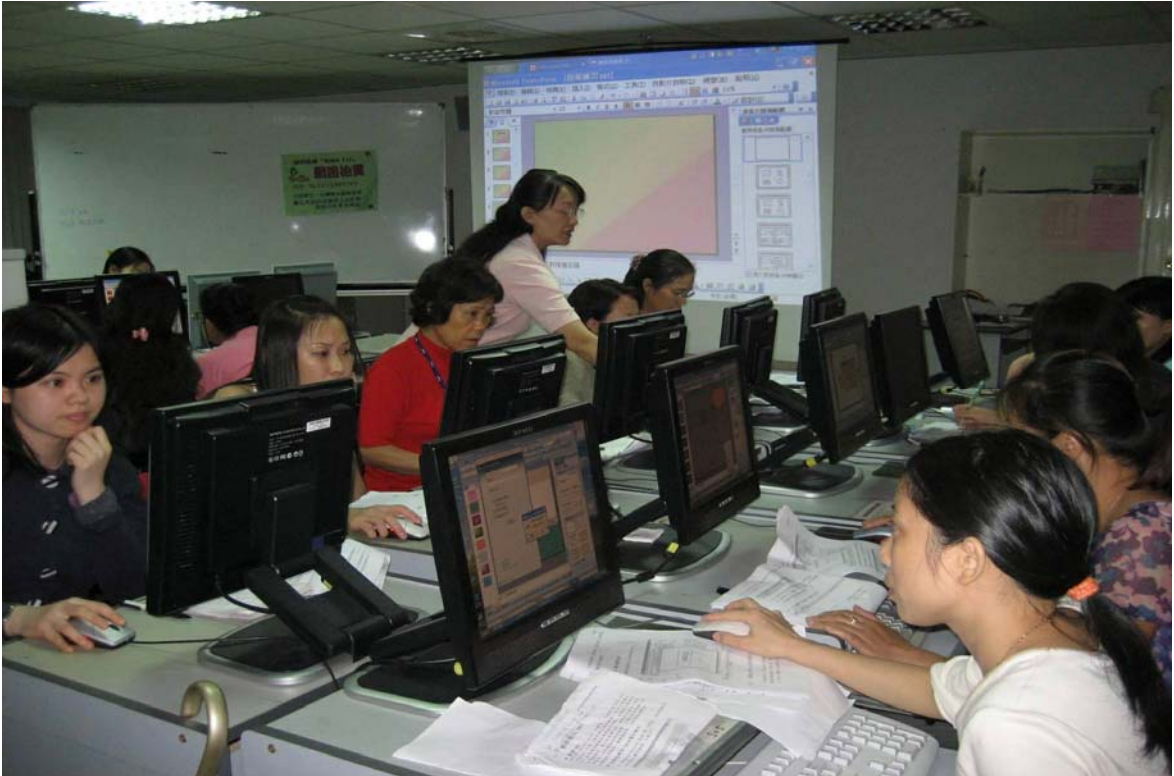
照片 21、新移民資訊教育