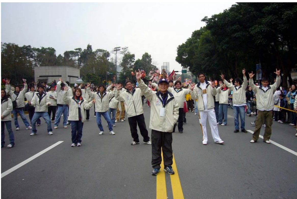
照片 27、遊行嘉年華聽奧一起鬥熱鬧。

最後為測試本市賽會整體籌備情形，龍斌特於 97 年 9 月份規劃辦理 2008 年臺北聽障運動國際邀請賽，藉此以評估整體賽事籌備情形(場館整備、志工培訓、後勤支援等)，並藉由上述賽會宣傳 2009 年臺北聽障奧林匹克運動會，以吸引更多國家及選手共同參與 2009 聽障奧運。