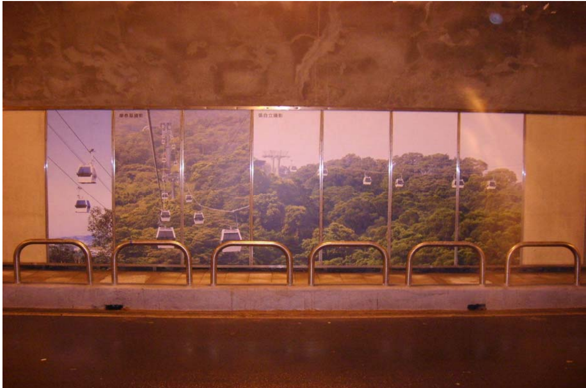
照片 7、懷恩隧道－單壁版貓纜照片美化