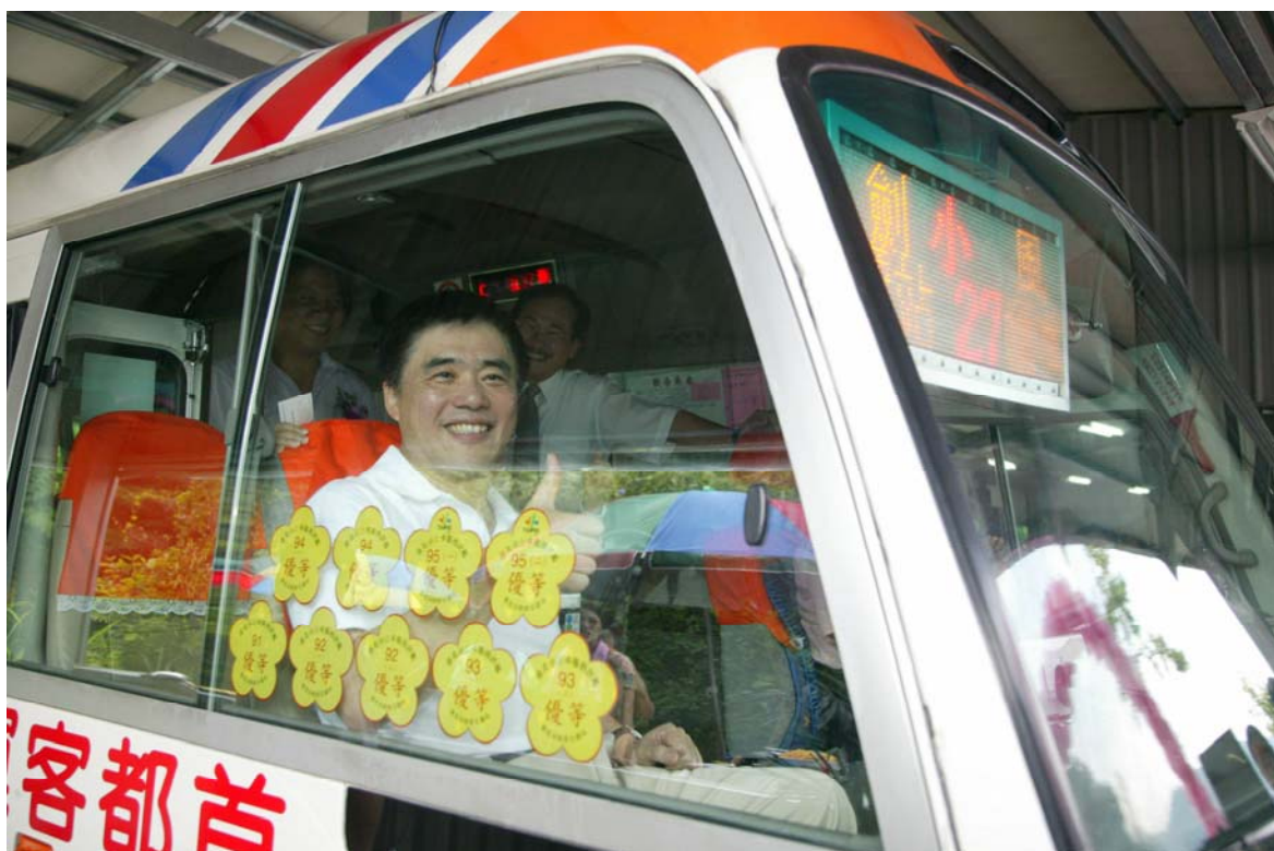
照片 11、小 27 通車典禮

97 年預計推動 5 條市民小巴路線，規劃有士林、內湖、中山及中正等區，其中士林後港地區市民小巴已於 97 年 1 月 30 日完成評選作業，由「光華巴士」取得營運權，預定 4 月底前通車營運；未來將持續推動市民小巴計畫，配合 96 年度已營運的 6 條路線，將市民小巴路網繼續延伸，目標為各社區能一車快速直達最近公車轉乘點或捷運站，以提供市民更便捷的短程接駁服務。