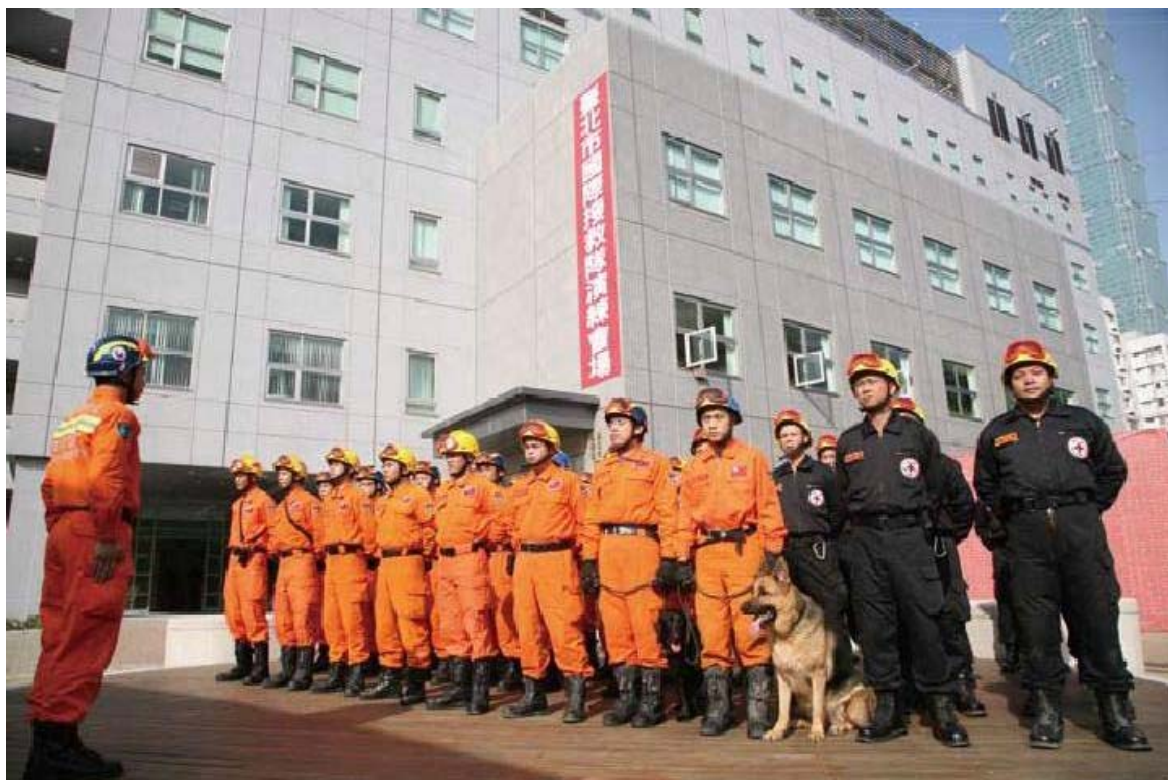
照片 24、災害應變中心

交控中心、捷運行控中心、水情中心的資通訊系統，加上制高點遠端 86 倍數監控地理資訊系統，大幅提高即時監控、即時應變的功效，配合新建置之各項先進資通訊設備，將可更有效提升本市整體應變能力。