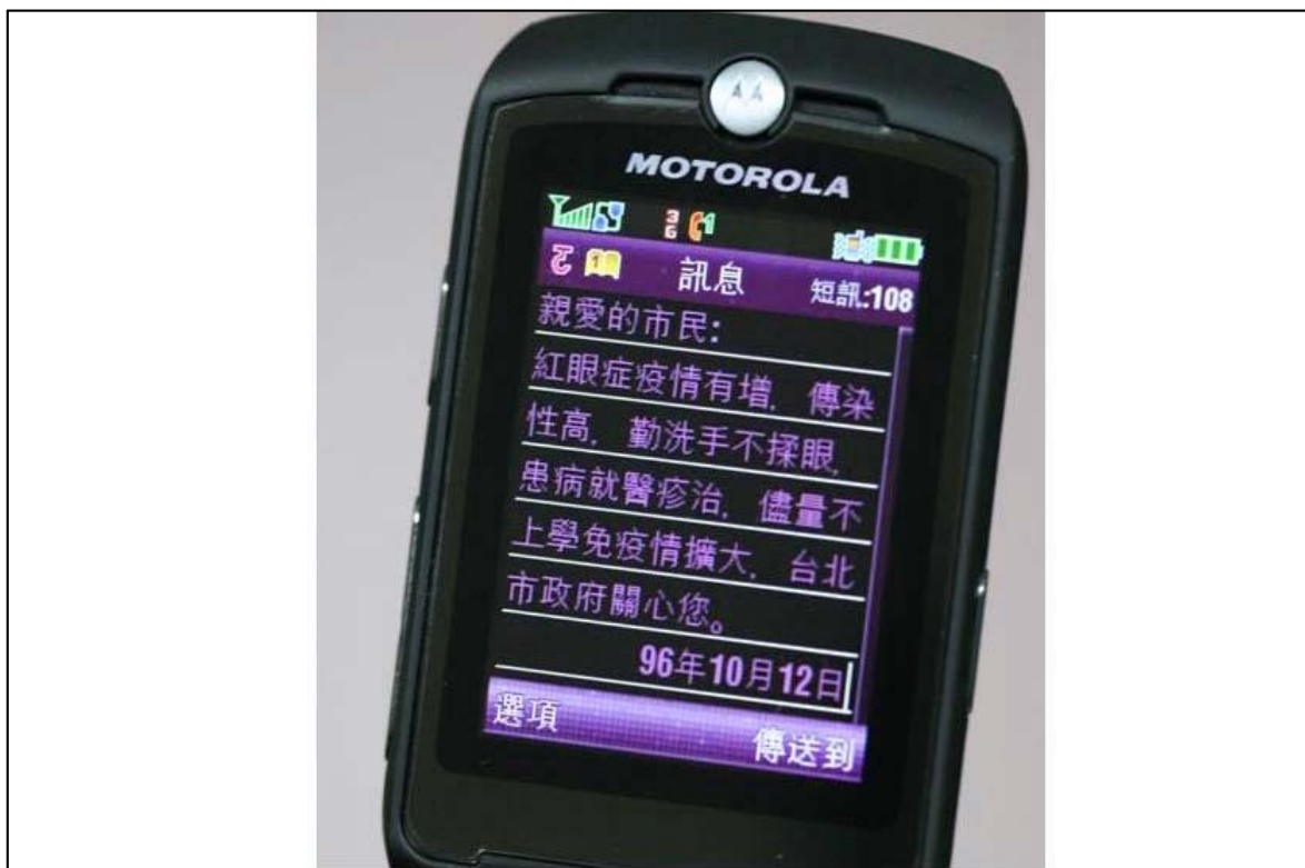
照片 13、紅眼症防疫簡訊傳遞

有鑑於防疫成效良好，目前本府正著手規劃公共簡訊發送平台，並於本府網路市民的网站平台中新增提供市民依其不同需求訂閱分眾市政簡訊的服務，這些機制預計在97年6月完成。此外本府也將重新檢討部分現行紙本文宣印製宣傳的適用性及費用，考量以簡訊服務替代部分紙本文宣，以節省預算及提高通知市民的實質效益。