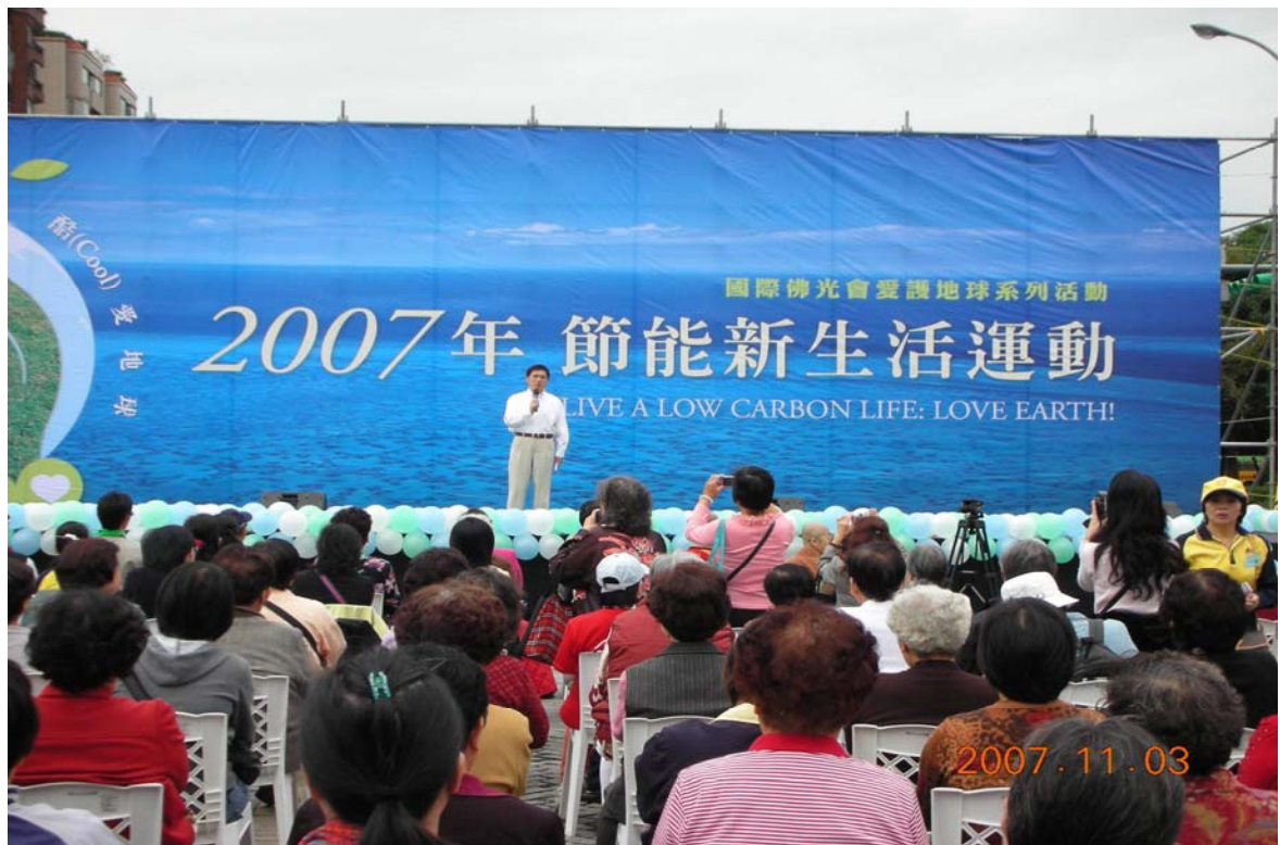
照片 2、96 年 11 月 3 日節能新生活運動