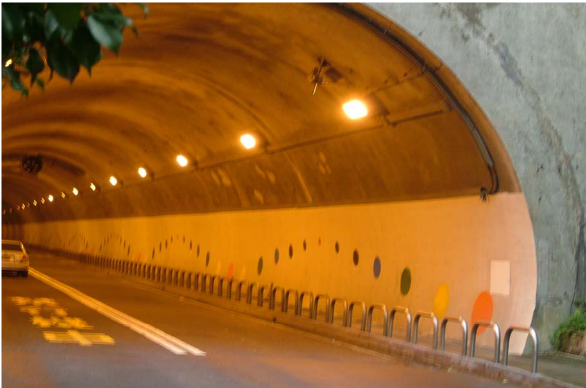
照片 6、辛亥隧道—人行道及護欄更新、簡易美化

龍斌希望藉由以上改善作為，將這 3 座老舊隧道及 1 座車行地下道內之環境予以提升，翻轉市民記憶中對隧道昏暗及不安的印象，重新形塑一個安全、明亮及潔淨的隧道，達到民眾通行隧道的好印象。