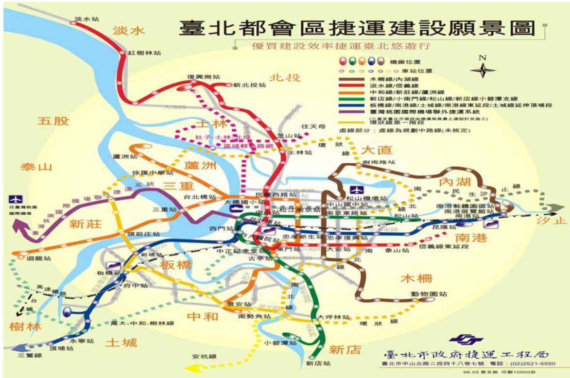
圖 5、臺北都會區捷運建設願景圖