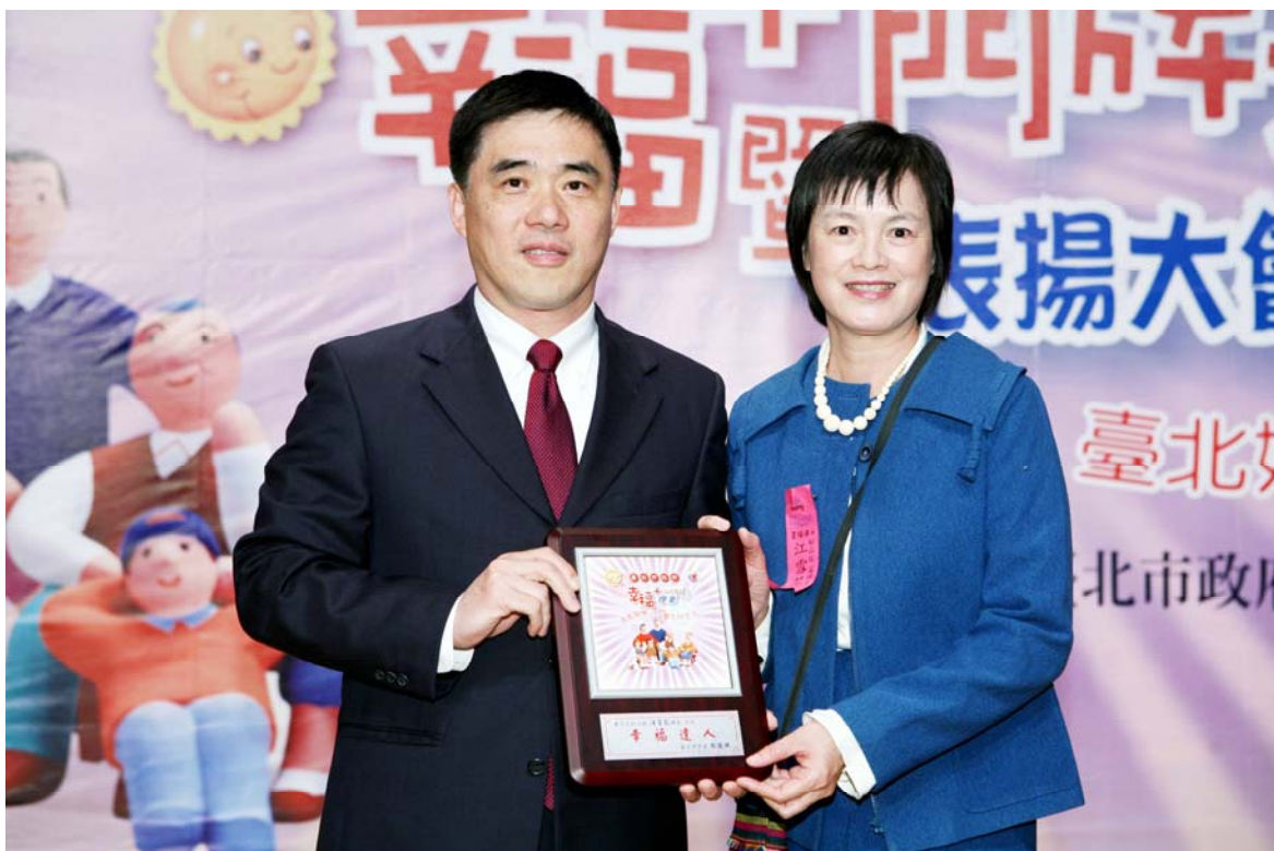
照片 12、96.12.24 幸福+專案里鄰長表揚大會

里鄰長，嘉勉其服務熱忱與愛心(如 p. 45 照片 12)。本府刻正規劃 97 年度提袋及內容物換裝事宜，修正手冊內容，未來相關禮品及書冊印刷將向弱勢團體採購，使幸福+專案增加更多溫暖。