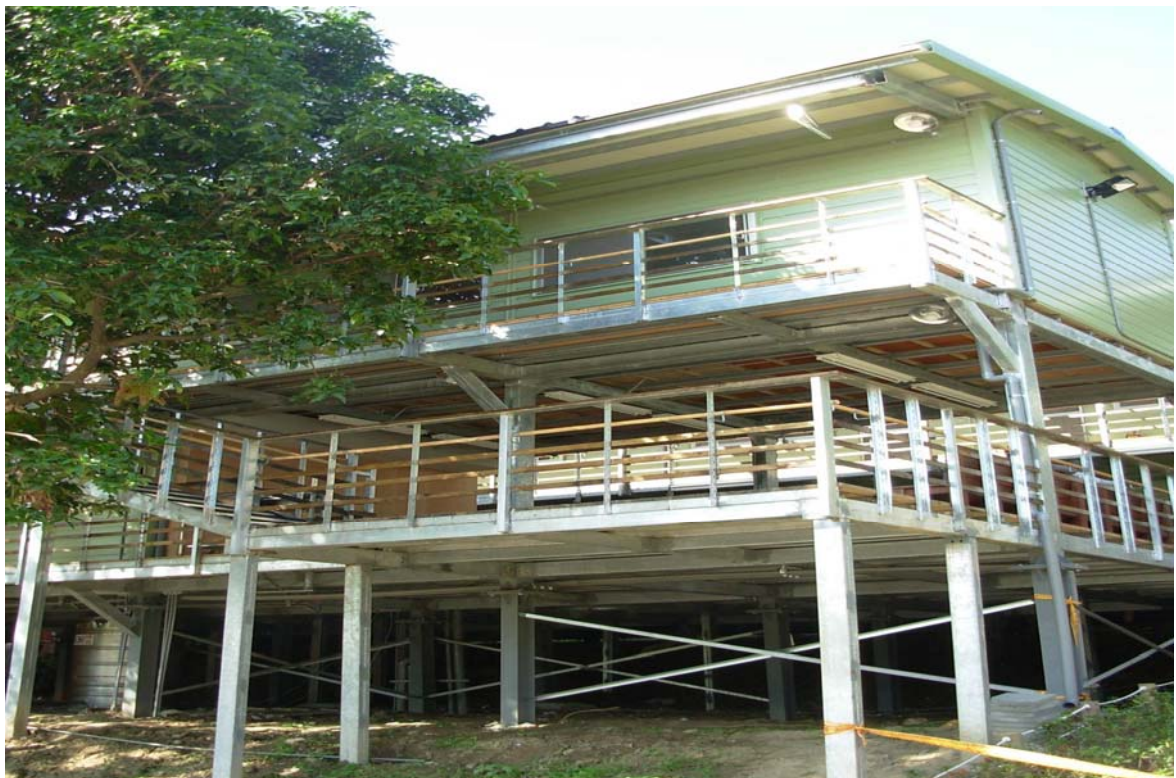
照片 4、寶藏巖中繼住宅安置居民