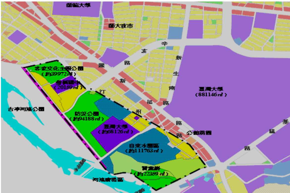
圖 1、公館水岸新世界範圍圖