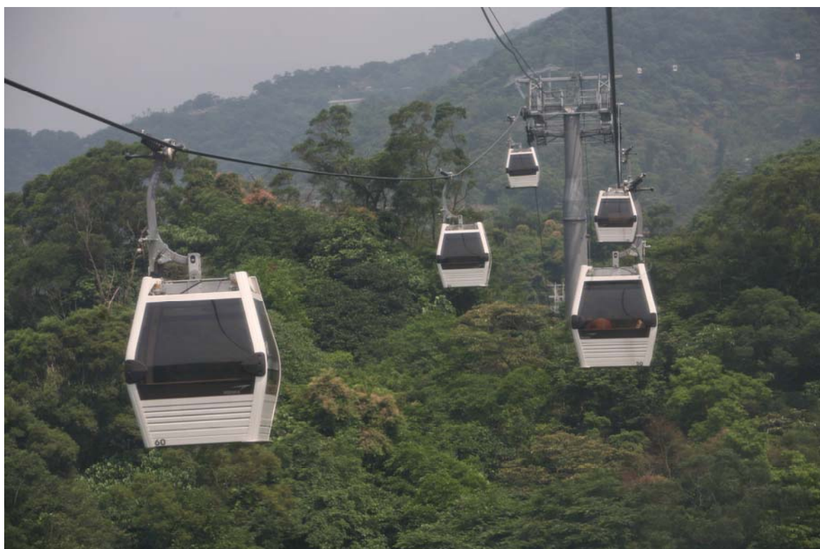
照片 8、貓空纜車悠遊山間

全與保護生態資源的情形下，辦理本都市計畫案之檢討變更。未來除了透過劃定當地之可申請開發許可範圍，以有效引導管控在地休閒農業之發展，並優先針對已取得暫行認許店家進行深度輔導，營造差異化之經營風格，推行店家餐飲、環境等優良認證制度，結合貓纜、親山步道及公車系統串聯店家，推廣該區商圈特色，期能提升業者經營管理能力及觀光休閒商業產值，建立當地商圈品牌形象，創造產業加值商機。