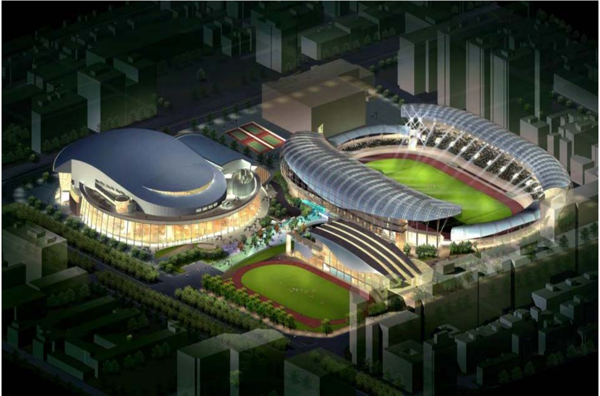
圖 7、臺北田徑場完工示意圖。