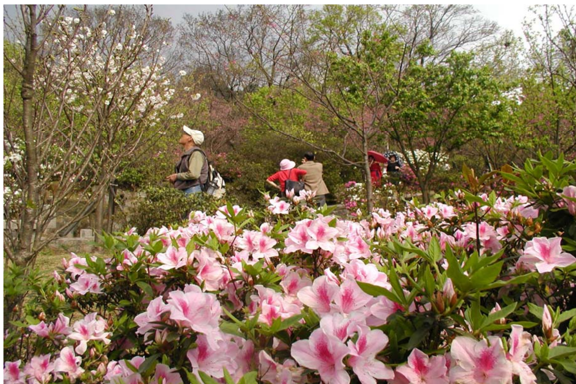
照片 16、陽明山花季景色宜人

照片 17)，並將活動擴展到市民廣場、市政大樓周邊、信義商圈及新仁愛路段至仁愛敦化圓環，另為展現城市風貌及結合商圈活力，燈區結合臺北市水岸、人文、科技意象及特色，成功營造元宵熱鬧團圓的節慶氛圍，展現傳統燈藝及公共藝術之美，讓充滿多元藝術美感的燈海點綴在本府周邊，使濃烈文化氣息瀰漫在溫馨的春意裡。