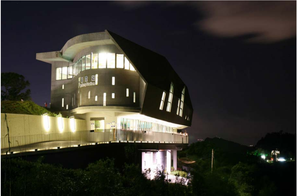
照片 9、貓空站美麗夜景