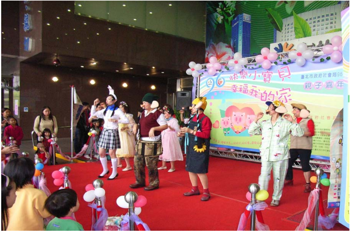
照片 26、96.3.24 高風險宣導—親子嘉年華