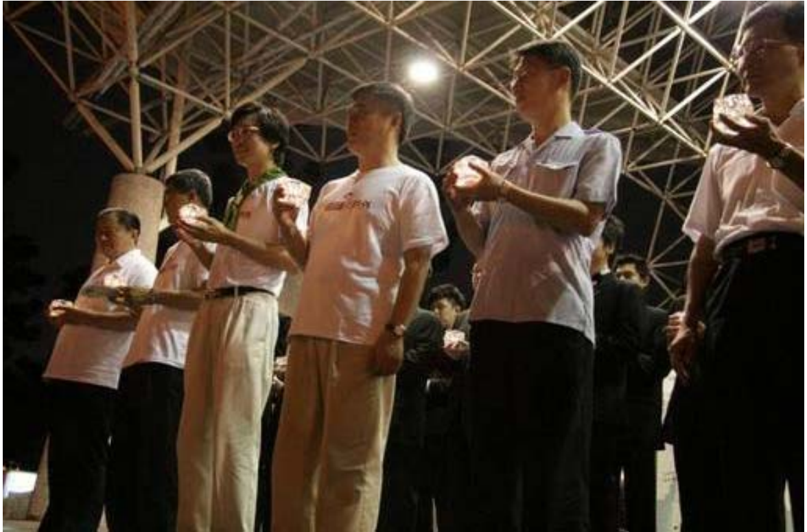
照片 1、96 年 6 月 22 日夏至關燈活動