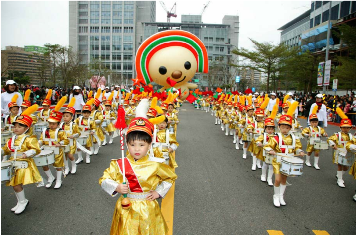
照片 14、跨年嘉年華遊行