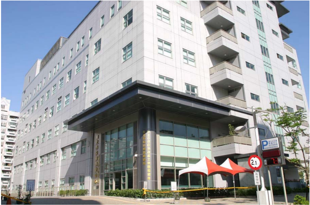
照片 25、災害應變中心外觀