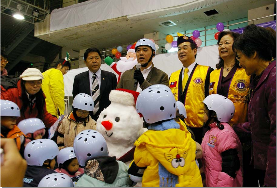
照片 20、市長與小朋友參與耶誕公益戲雪、滑冰體驗活動照