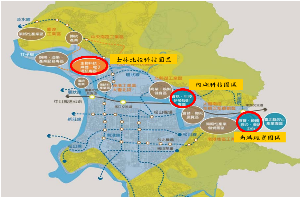
圖 4、臺北市科技走廊示意圖