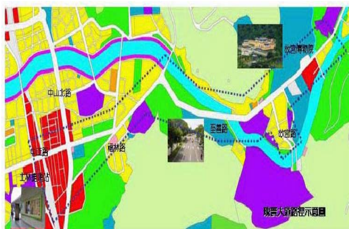
圖 2、瑰寶大道路徑示意圖