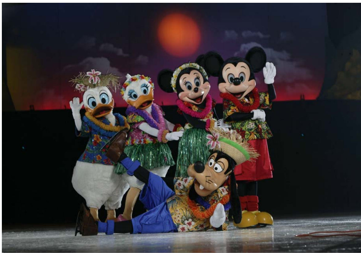
照片 19、迪士尼冰上世界

未來，本府持續以提高場地使用率及維持優良營運品質作為小巨蛋經營目標，一方面強化小巨蛋經營管理績效，同時兼顧公益及體育活動之經營，逐步提升公益及體育團體使用場地率，使小巨蛋貼近多功能運動場館之效益。