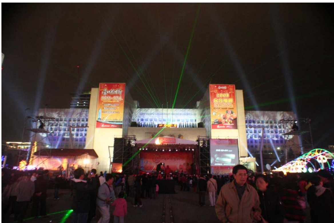
照片 18、市府大樓燈光秀