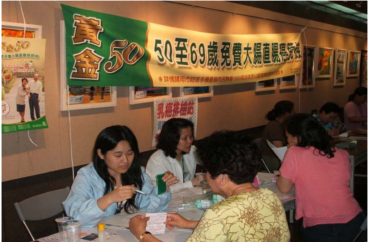
照片 23、96.7.14 南港區民眾參與大腸癌篩檢