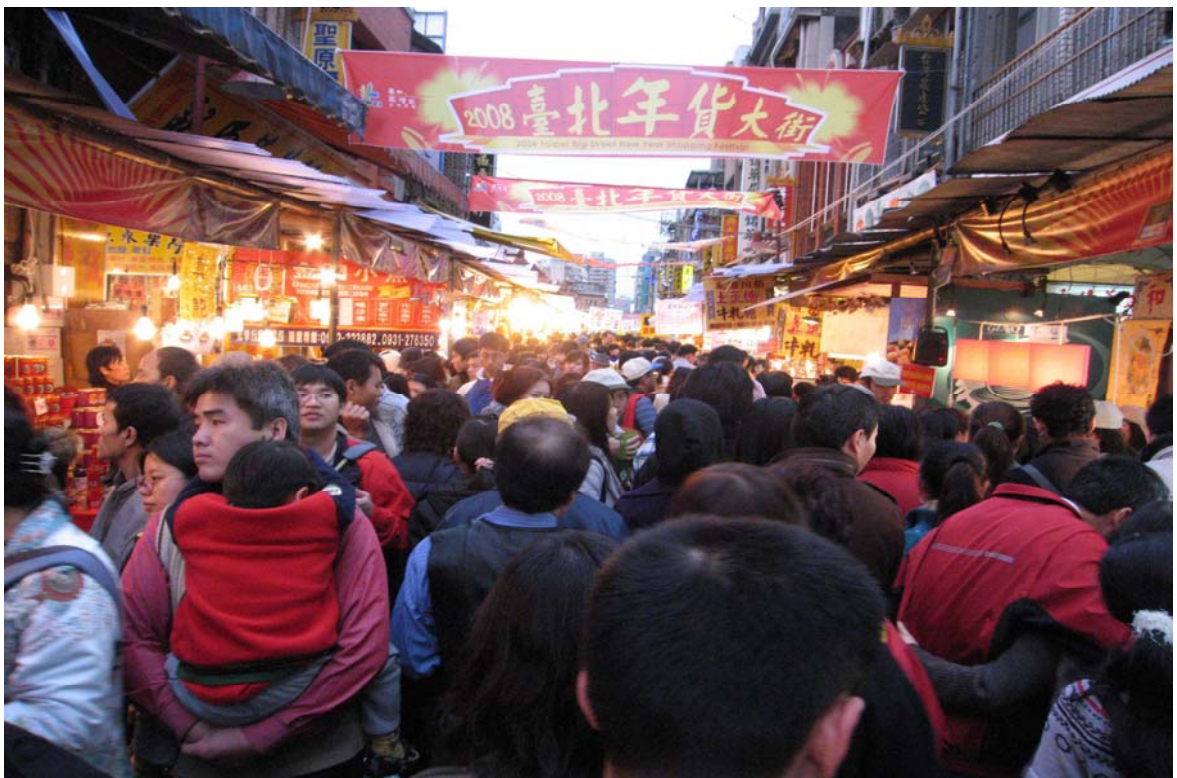
照片 15、熱鬧滾滾年貨大街