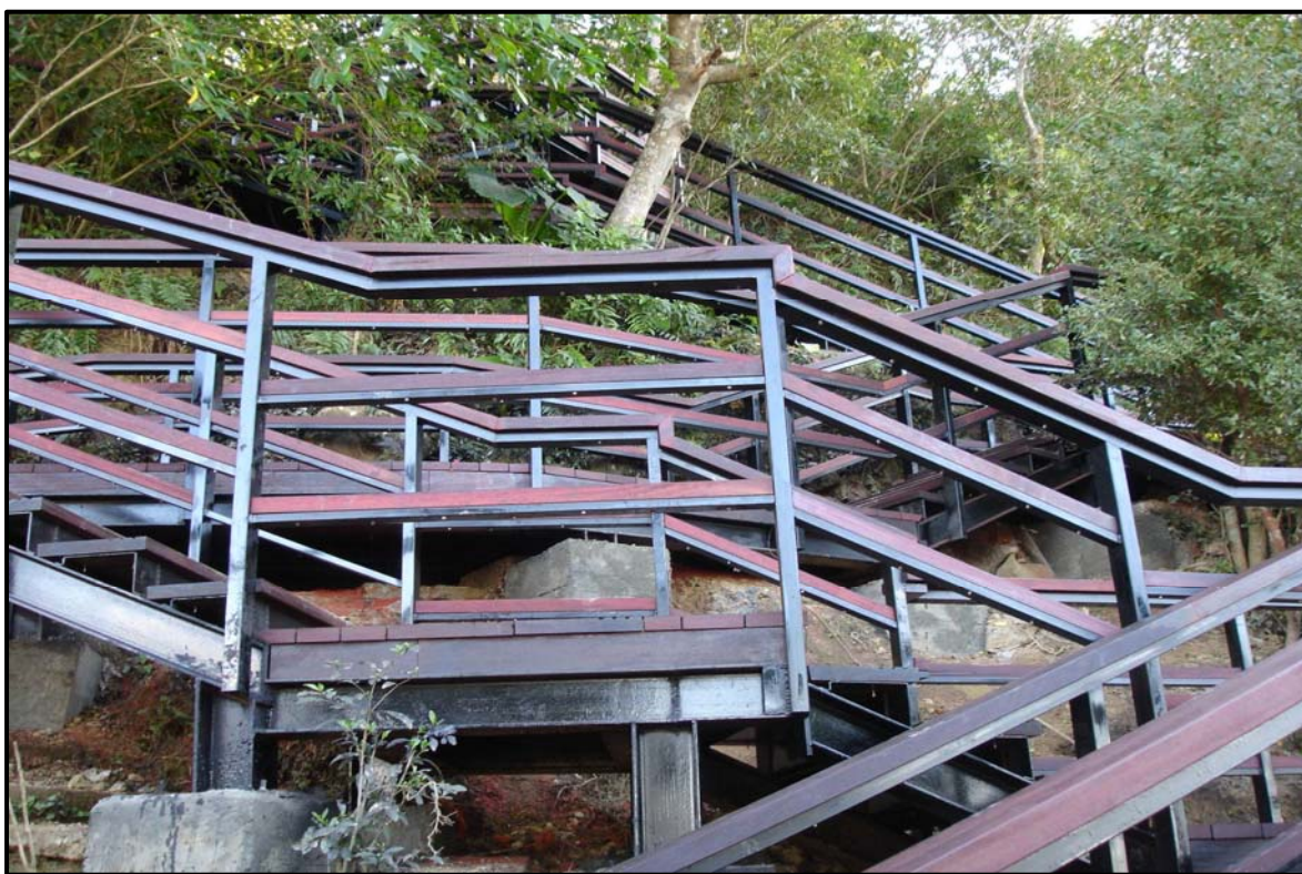
照片 5、本市風景區公共設施整修後煥然一新

期望透過提升本市產業道路與登山步道服務品質，結合產業、休閒與藝文活動，以達到「安全永續、景觀永續、生態永續及產業永續」目標。