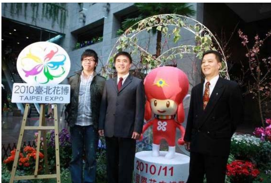
照片 28、「2010 臺北國際花卉博覽會」吉祥物及 LOGO

花博會吉祥物及 LOGO 之設計，已於 97 年 1 月 21 日完成決選，並於 97 年 2 月 1 日隆重揭幕。為保障花博會 LOGO、吉祥物之商標權，業依據商標法相關規定申請商標註冊，未來將運用 LOGO、吉祥物廣為宣導，並藉由相關商品及文宣加強社會大眾對花博會的印象。