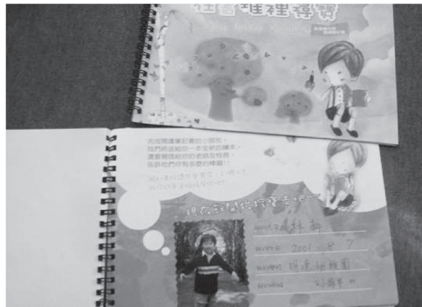
圖3在書堆裡尋寶閱讀筆記書

家長可以輕易地指導孩子如何紀錄。完成閱讀筆記的孩子，繪本館不僅將致贈精美的繪本外，更將發函校方鼓勵之。這樣一份閱讀紀錄，除了能夠帶給孩子十足的閱讀成就感外，更可幫助家長們掌握孩子的閱讀狀況。繪本館也特別提醒大家，在孩子閱讀的道路上，家長們是不能缺席的，只要爸爸媽媽願意撥出時間陪伴與鼓勵，孩子絕對有機會成爲「讀者」的。