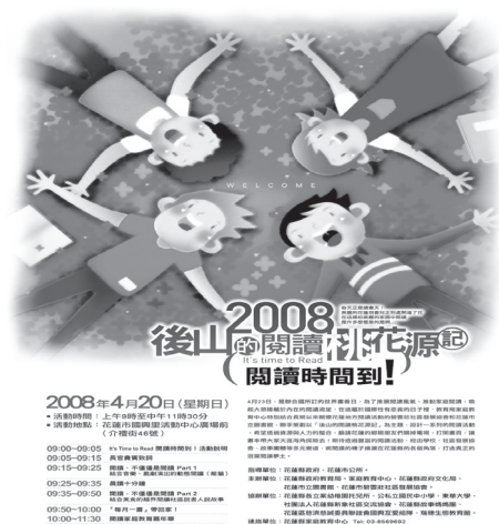
圖5 後山的閱讀桃花源記閱讀手冊

爲了落實這個想法，我們結合花蓮縣境內30餘家企業贊助，編輯印行「閱讀手冊」，參與的校園分布在花蓮縣13鄉鎮達200多個班級，包括古風、港口、大禹等較爲偏遠的學校都主動加入。這次閱讀手冊與過去推動兒童閱讀最大的差異在於，鼓勵閱讀「質」的提升而非閱讀書本「量」的增加，由於許多學生爲了要有很多閱讀書本的「量」，往往以閱讀繪本爲優先，而不願意閱讀文字較多的文學作品。因此，「2008後山的閱讀桃花源記·閱讀手冊」的做法是以「每天閱讀20分鐘」及「持續閱讀獎勵」方式，鼓勵學生選讀自己喜歡的書籍每天閱讀20分鐘，並紀錄閱讀的書名與頁數即可，學生無撰寫閱讀心得的壓力，若一個月能持續25天以上，則可累積點數兌換各花蓮縣三十餘企業贊助的獎勵。