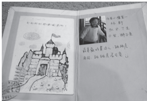
圖2 閱讀城堡閱讀紀錄小書