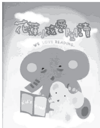
圖4花蓮寶寶愛閱讀親子共讀指導手冊