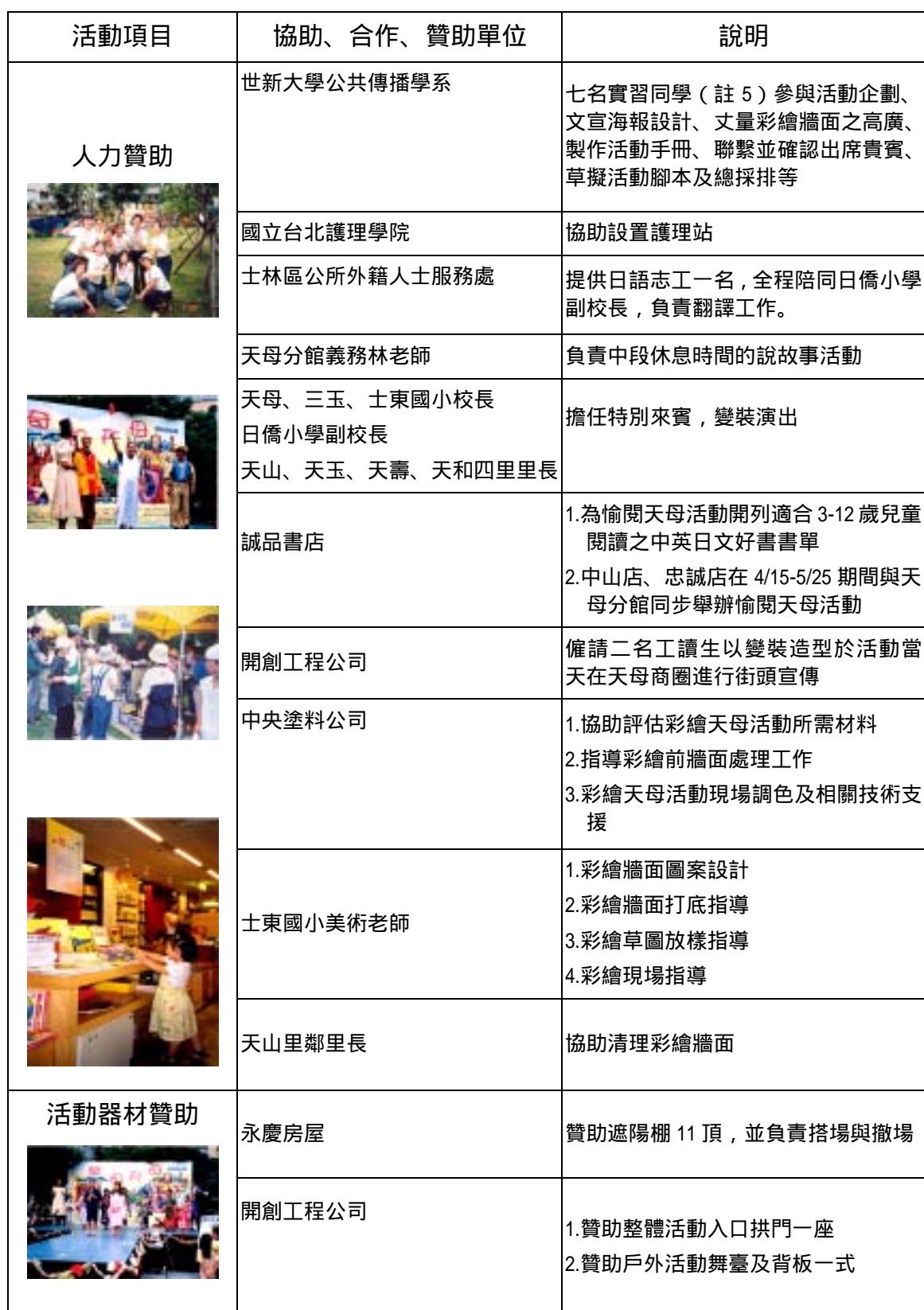
表四 童話天母城活動社會資源運用分析一覽