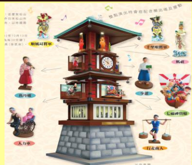
松山一道後溫泉祈福機械鐘