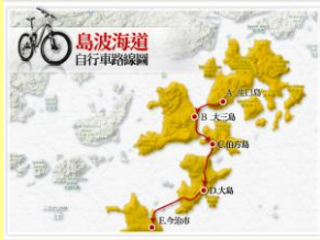
島波海道自行車道