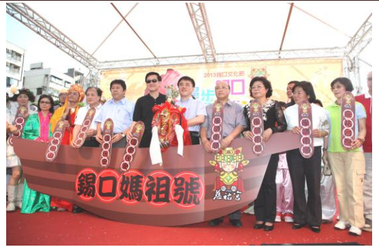
每年5月份錫口文化節