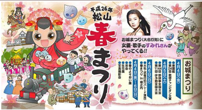
每年4月初松山春之祭