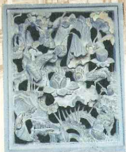
艋舺龍山寺內的石雕工藝透露著歷史感