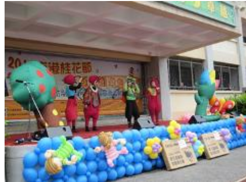
本區 103 年度桂花節藝文活動