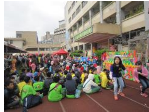
本區 103 年度桂花節藝文活動