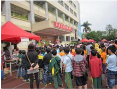
本區 103 年度桂花節藝文活動