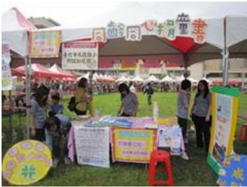
本區 103 年度桂花節藝文活動本區 (三) 物產展銷：