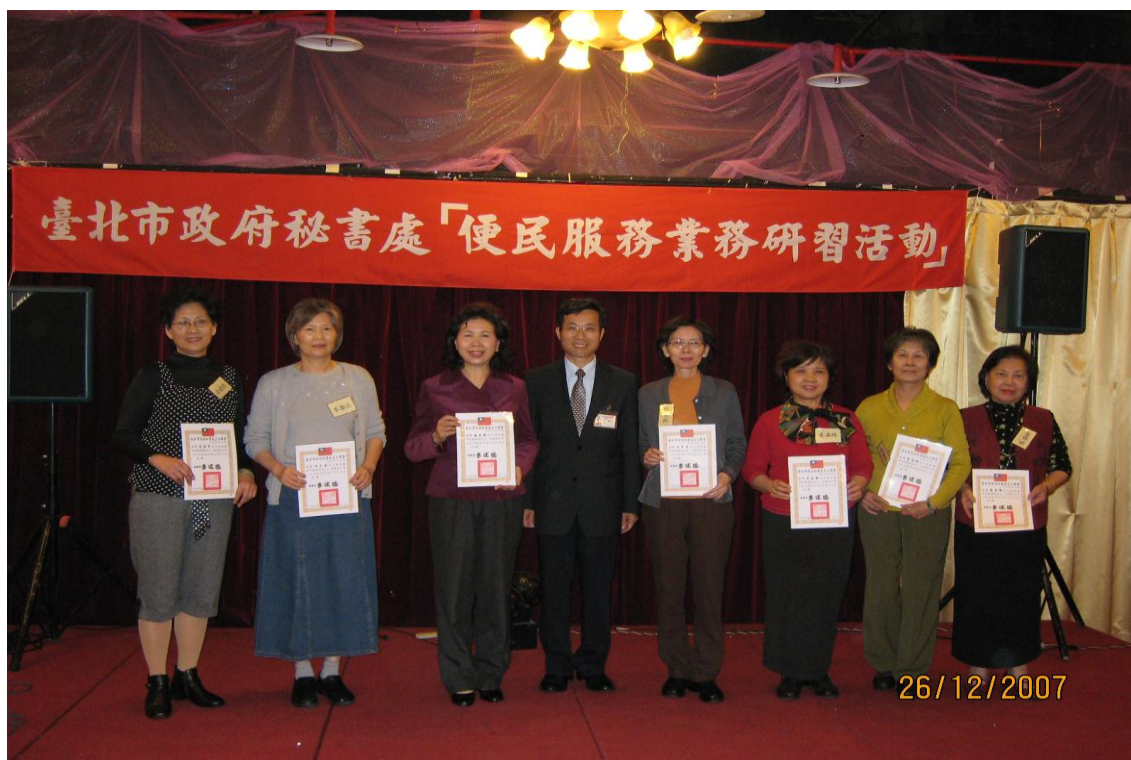
96.12.26 辦理本處 96 年度便民服務年終業務研習會