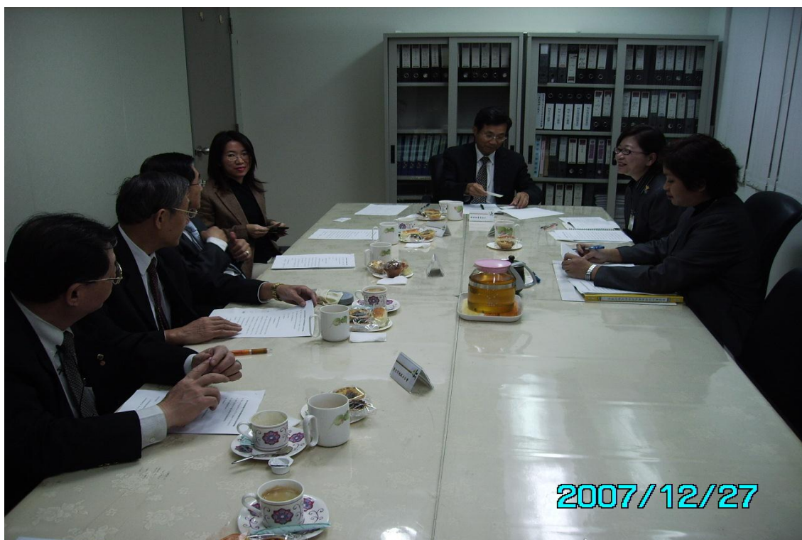
96.12.27 辦理本處 96 年度專業諮詢服務意見交流座談會