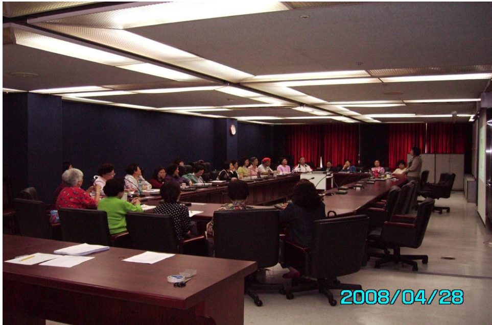
97年為民服務志工教育訓練研習及座談會(97.4.28)