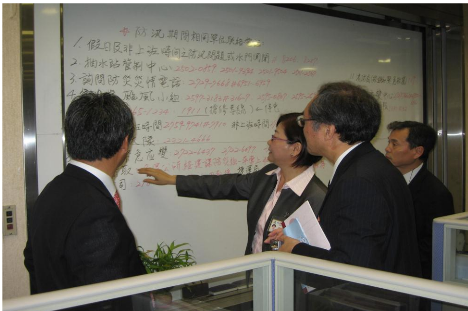
日本東京都千葉縣市川市官員來府參觀 1999 市民熱線 (97.4.22)