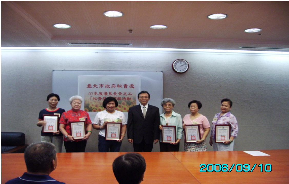
本處 97 年度優良長青志工接受楊秘書長錫安頒發松青獎