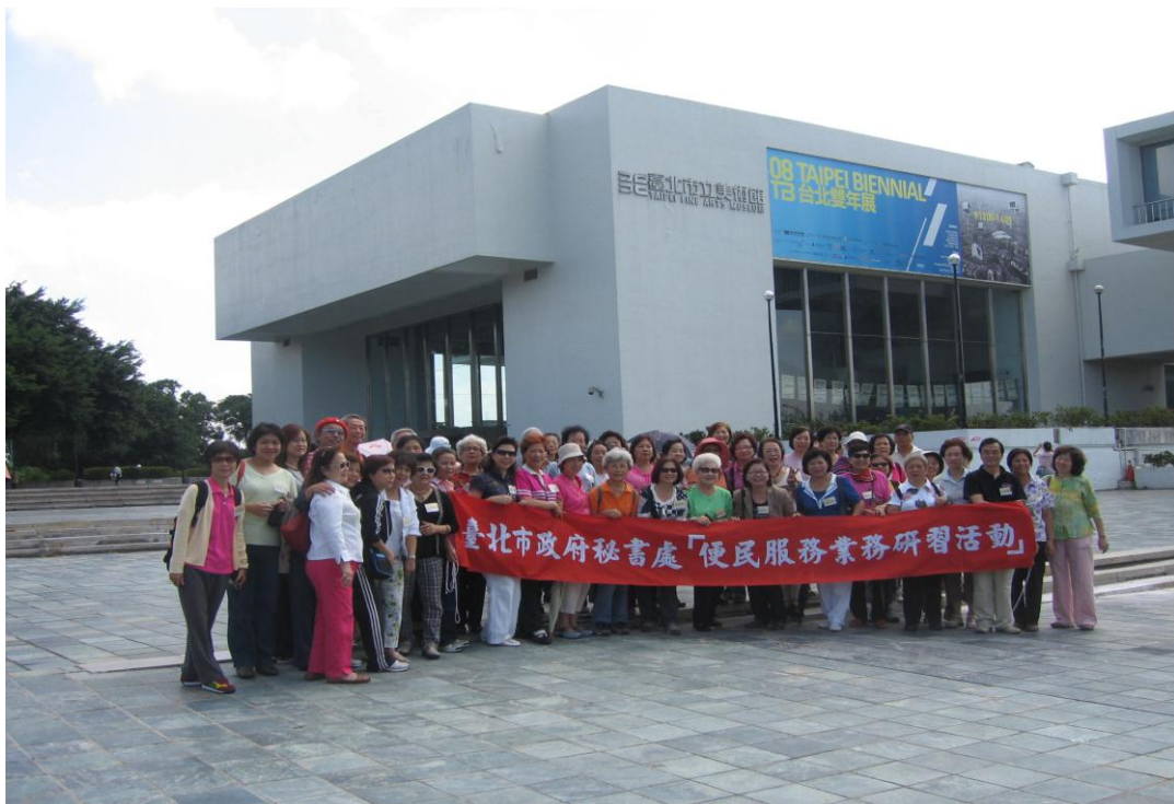
97 年便民服務研習活動參訪美術館