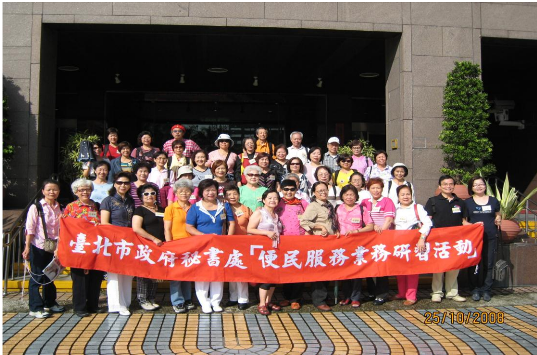
97 年便民服務研習活動合影