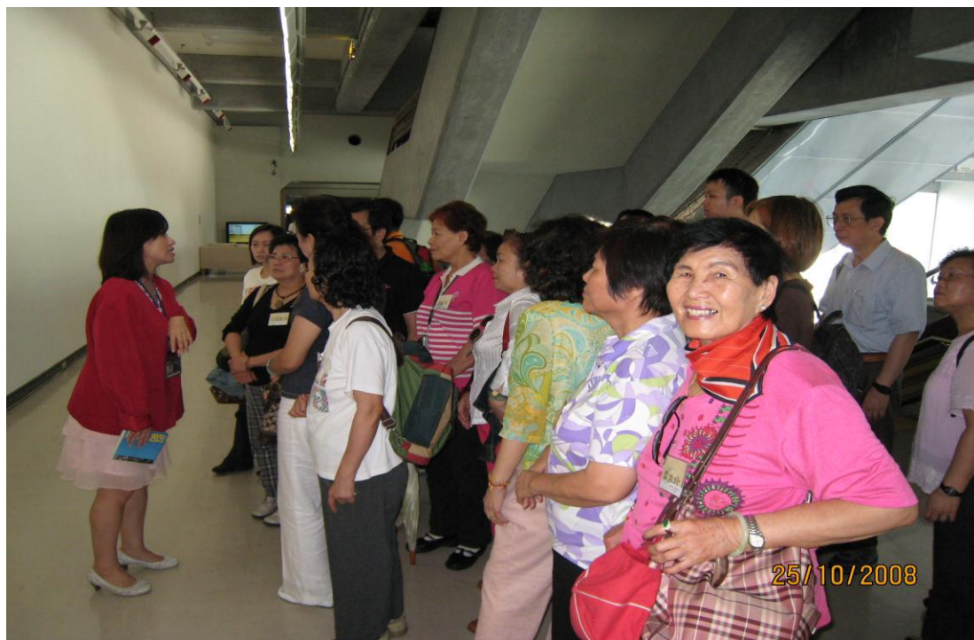
97 年便民服務研習活動參訪市立美術館導覽情形