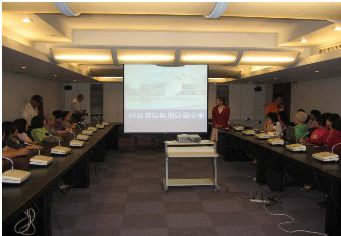
97 年便民服務研習活動參訪市立美術館說明會