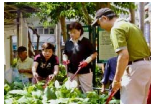
認養人熱心參與植栽綠美化