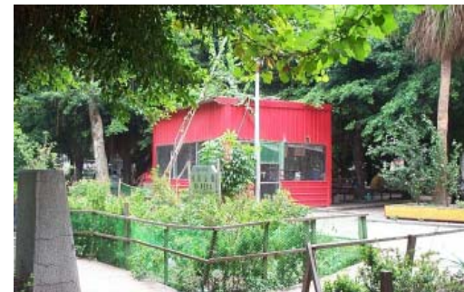
大同區樹德公園改造前實景