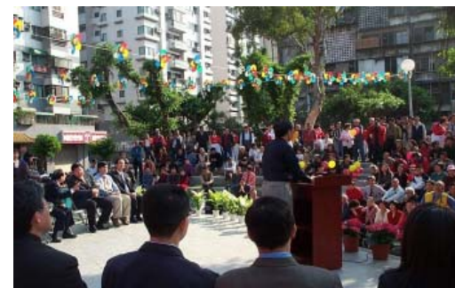
大同區樹德公園啟用典禮