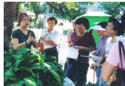
松山區95年度認養人研習活動實景