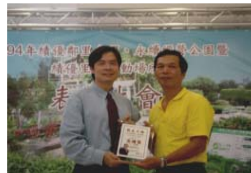
94年績優鄰里公園頒獎典禮實景