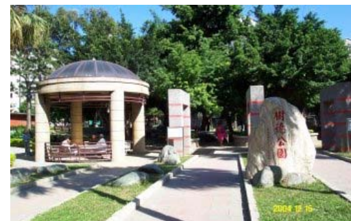
大同區樹德公園改造後實景