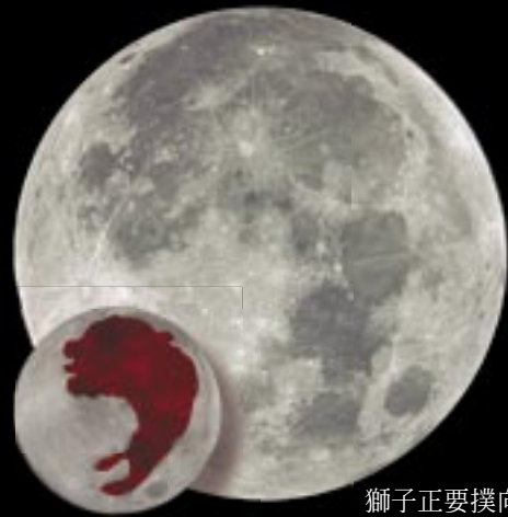
獅子正要撲向獵物

當月亮偏西，要沉入地平線之際，月海的形狀像是一隻吼叫的獅子，正要躍起飛撲獵物，風暴洋是獅子的頭部以及蓬鬆茂盛的鬣毛，雲海、濕海是獅子的前肢，雨海、霧海構成獅子壯碩的胸部，晴朗海、寧靜海是獅子的腰臀，而酒神海、豐饒海則是獅子的後腿。獅子大型的肉食哺乳動物，生活在熱帶草原與荒漠的水源區，非洲與亞洲（伊朗、印度）都有其蹤跡，獅的特徵是尾端有一球狀毛簇，毛簇中間有一個堅硬的角質物，體毛為沙黃色、黃褐色或暗褐色，雄獅的頭側、頸部直至肩部有黑或深褐色長鬣毛。