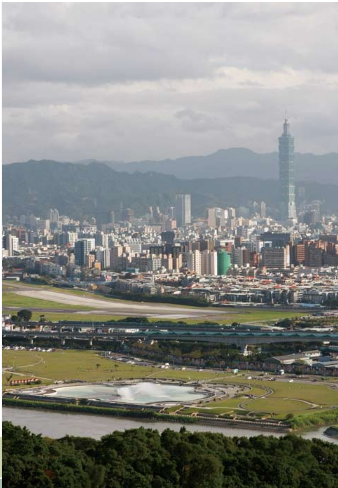
從劍潭山鳥瞰臺北市，整個城市最美的河岸盡在眼前。