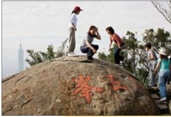
九五峰據說是為了紀念楊森將軍以九五高齡尚能登頂。

為了不至於辜負了揮汗登頂好不容易消耗掉的卡路里，爬山後的飲食以輕食為主。NIKO NIKO ROLL & SUSHI 獨特的「熱壽司」特別適合冷天品嚐。融合了「日本壽司+法式醬汁」做法，以酪梨醬搭配米飯、海鮮、水果，作成溫烤、海味、香辣多元口味，大大顛覆了你腦海中對於壽司的傳統印象。溫熱的口感，豐盛的擺盤，清爽的熱量，儘管豪邁痛快、不拘小節的大啖一回吧！