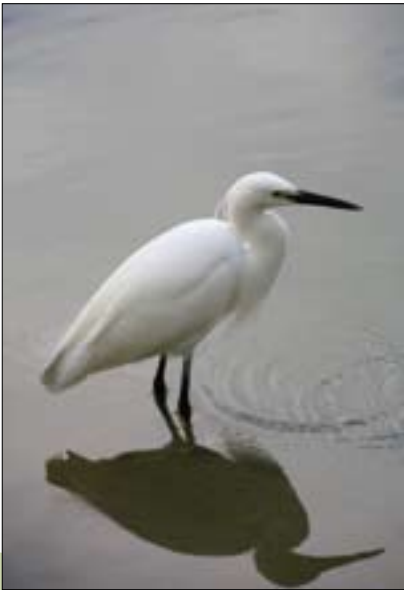
白鷺鷥在溪畔準備大展獵食身手。

面植物上產卵，夏日可見大量正在活動覓食或棲息的短腹幽蟪族群，它生活於平地至低海拔山區溪流、水田、池塘，是臺灣分布最廣、數量最多的豆娘，非常容易觀察。