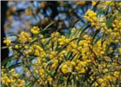
春夏交替之際，黃色小花蔓延成滿山燦爛的金黃花海。

觀音山海拔616公尺，不高不陡，十分適合一般民眾健行。有6條步道上山，分別是福隆山、硬漢嶺、占山、楓櫃斗、牛港稜步道以及牛寮埔步道，其中硬漢嶺步道鋪設平整，指標清楚完善，常成為外地遊客優先選擇。