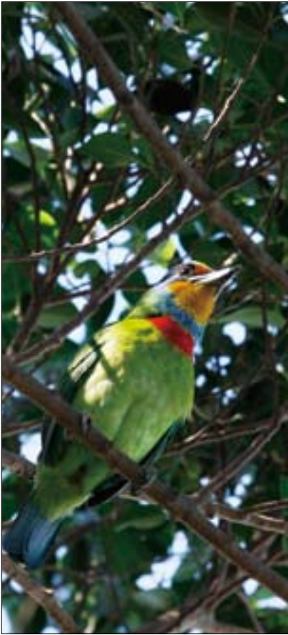
棲息在四獸山自然步道的五色鳥。