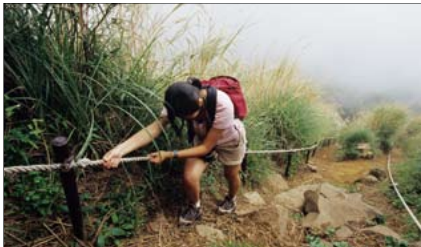
南峰、西峰設立了牢靠的拉繩，讓遊客體驗「爬」山的樂趣。

大屯主峰因山形渾圓雄厚，在山友眼中向來具有王者氣勢。位於山頂的觀景台展望開闊，淡水河緩緩西向出海，大屯南峰、西峰、面天山從左至右一字排開，天氣好還可看得更遠些，南方的雪山、大霸尖、南湖大山山形也歷歷如繪，這可不是臺灣太小，而是大屯山頂的視野實在太優；尤其黃昏時色溫變化萬千的夕照風情，更是隨時都能召喚人心的經典美景。