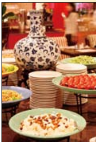
在南胡樂音中，品嚐古典而優雅的圓山飯店下午茶。

續往山頂木棧道走去，有一處山友暱稱為「觀機坪」的賞景區，視野開敞幾無遮蔽，在這可迎風觀賞飛機起降，臺北首座釣竿式斜張橋的大直橋、定時噴湧「希望之泉」的大佳