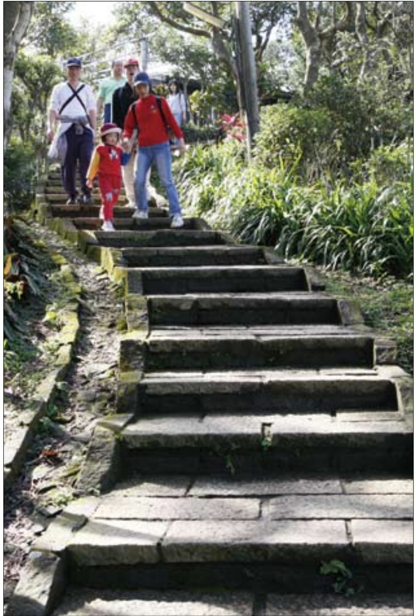
南港山系是條可及性很高的入門路線。

嚴禁釣魚、電魚，因此魚兒們的天敵反倒不是人類，而是一旁伺機而動的白鷺鷥。白鷺鷥為臺灣常見的留鳥，常活動於水澤、溪流、湖泊周邊，以魚類、蛙類與昆蟲為主食。這天大雨乍歇，魚群紛紛被沖至水面，剛好見到一隻中白鷺鷥正在溪畔大展獵食身手，小朋友們個個瞪大眼睛彷彿不可置信——沒有比這更生動有趣的自然課了。