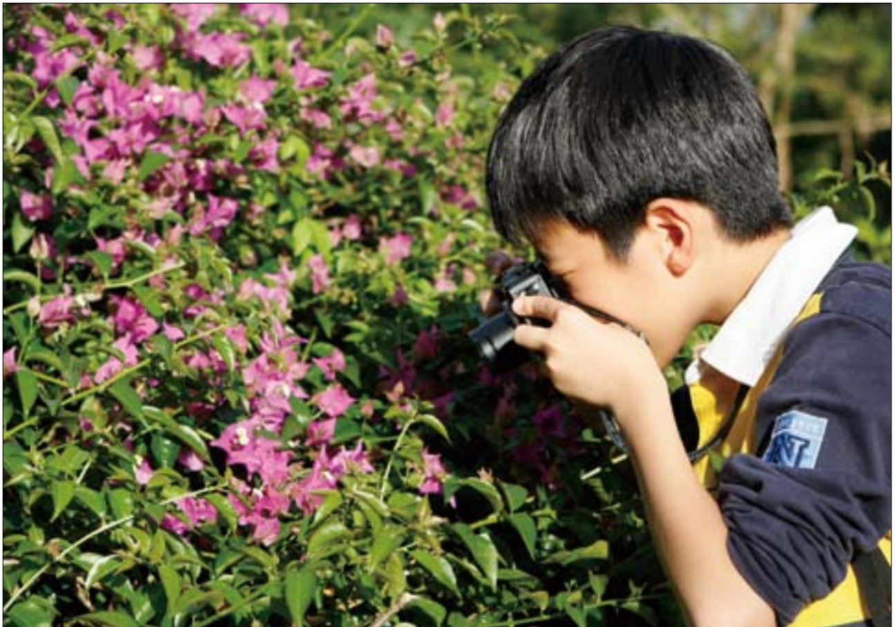
走在步道上，可觀察豐富多層次的生態。

嚴後，劍潭山的山防隨之結束，在市府努力整修後，這條大隱於市、景觀與設施都很夠水準的登山路徑才終於正式曝光。