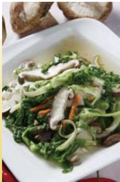
爬山過後來一盤熱炒山菜，補充體力，增強活力。