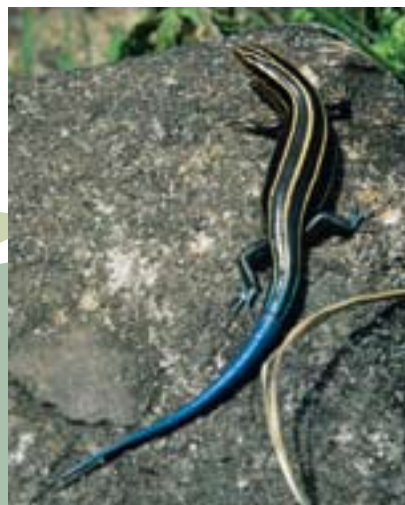
天暖時，步道兩側常見「麗紋石龍子」。

春天野菜最好，特別是結合陽明山天時地利的無農藥蔬菜，更受歡迎。老山友都知道，竹子湖有好些以自種有機蔬菜聞名的餐廳，菜園大多就位於餐廳附近，當天採收的蔬菜還留著晨露呢！山蘇、小白菜、枸杞葉、菊苣、山萵蒿等，最多可達數十種，現採現賣超新鮮。土雞則採小範圍