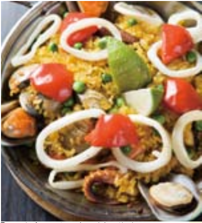
「92水鳥」以西班牙料理為主。

鹹鴨蛋，對於美食，可以有更悠閒優雅的選擇。位於關渡自然公園旁的「92水鳥」是景觀最好的一家，面對的是一整片水鳥繽紛起落的蓊綠溼地，順著紅樹林的彎腰幅度，可以看見風流動的姿態，面窗的好位置，誰都搶著坐。