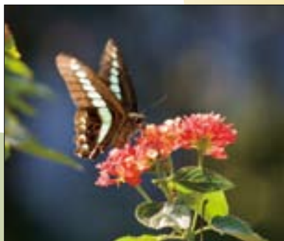
蝴蝶花廊位於面天山與大屯山之間，是著名的蝶道。