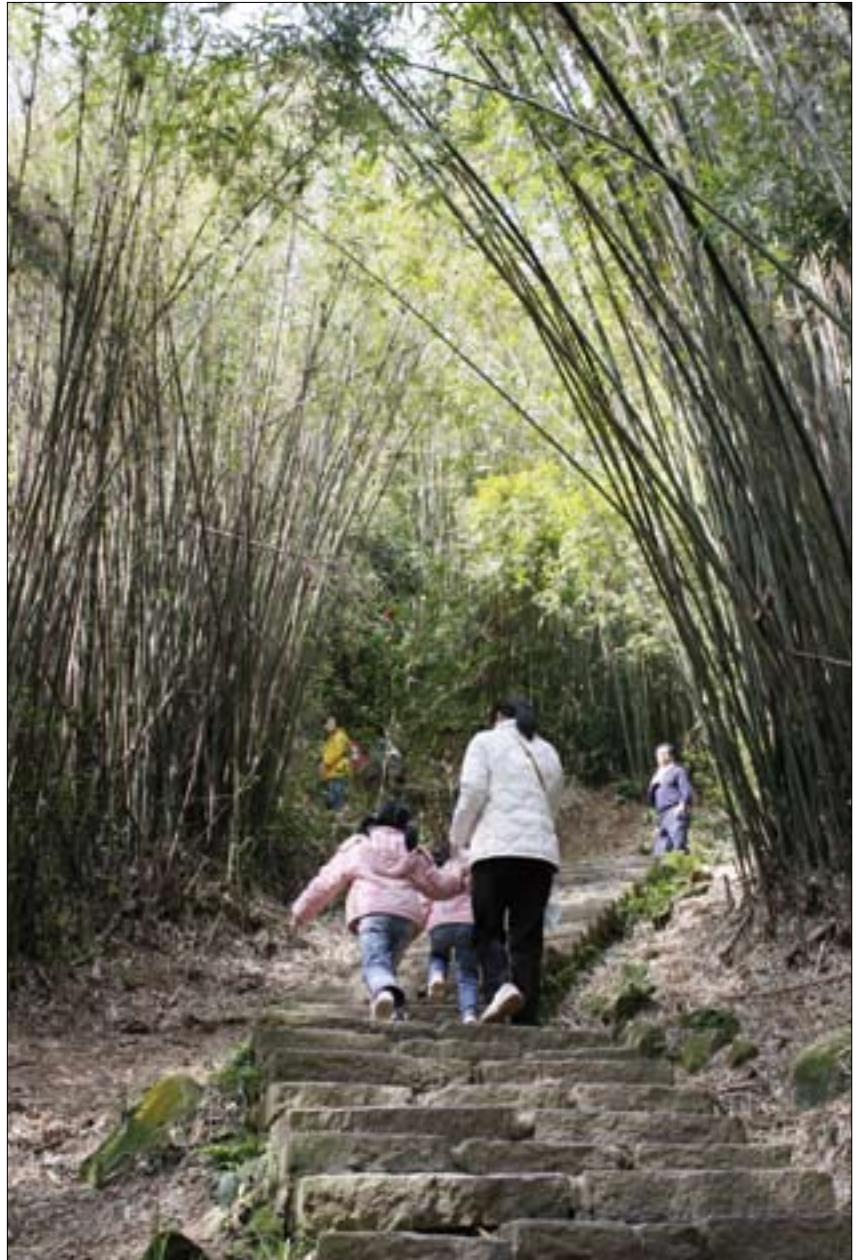
步道兩側修竹林立，緩步拾級而上饒富禪意。

觀音山登山步道最大特點是，無論步道階梯或寺廟使用的建材，大多以此地生產的觀音山石建造而成。觀音山石表面佈滿了綿密細緻的毛細孔，據說能依天候晴雨適時吐納，調節溼氣，使山裡空氣不至於潮悶，步道不至於溼滑難行，既耐用又不易受到風化侵蝕影響，為安全性相當高