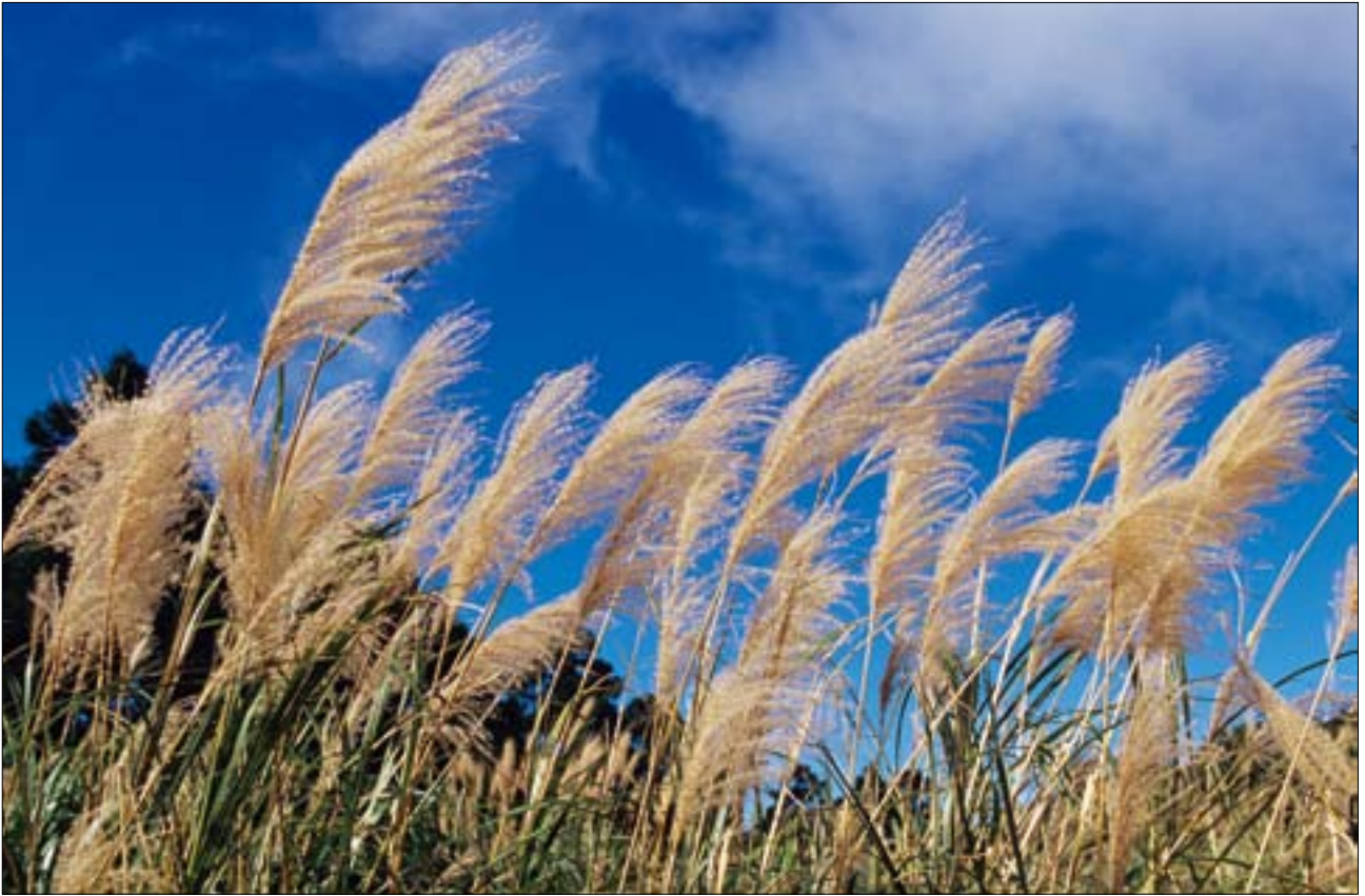
大屯山迎風面因風勢強勁，林木稀疏，只有芒草能頑強抵禦。

路，向左往南峰登山口，陽管處在這好心立了警語：「大屯西、南峰是一處需要手力、腳力與體力並用才能攀登的山岳，也是困難度較高之路線；若您體能不佳或年老婦孺或下雨天，建議您不要貿然登頂，請立即回頭以維護您的安全。」大屯山迎風面因風勢強勁，林木稀疏，只有芒草能頑強抵禦；登入山徑後，進入背風面，遍地盡是蒼翠壯碩的闊葉林。走沒多久，石階變成泥土小路；此去一路亂草雜密，得小心注意路徑才不致迷路。約半小時輕鬆抵達標高約960公尺的南峰頂，山下的溪流村舍盡收眼底。