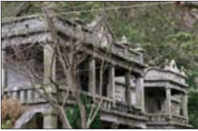
楞嚴閣為佛教徒禪修之所，古樸幽靜。