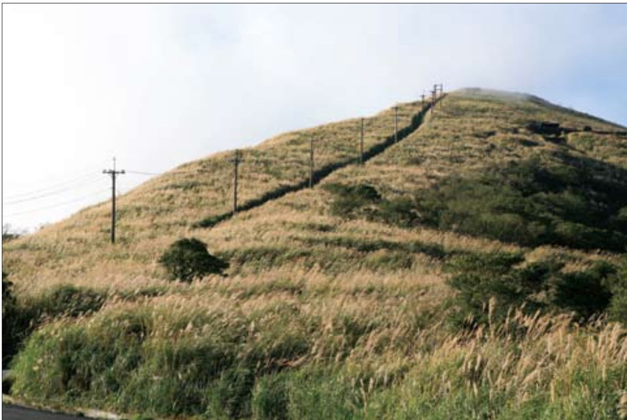
被芒花和降霜染白了的大屯山，別有一番北國風情。

大屯山群由主峰、西峰、南峰、面天山、中正山、二子山等組成，由於開發較早，發展出布線完整、主題多元的登山步道群，最具代表性的包括蝴蝶花廊賞鳥步道、大屯主峰、大屯西峰—南峰以及面天山—向天池四條路線，峰峰相連，也能各自規劃半日至一日的獨立旅程。