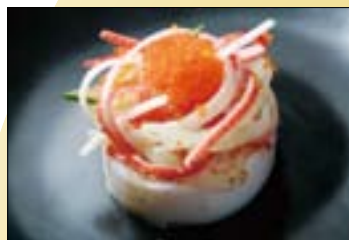
爬山後的飲食以輕食為主，獨特的熱壽司是不錯選擇。