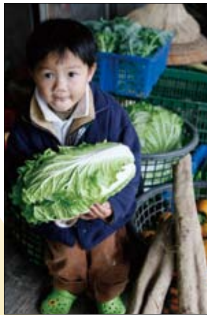
陽明山種植的無農藥蔬菜，中看也中吃。