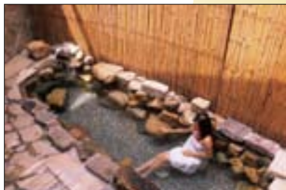
新北投溫泉飯店風格豐富多元，登山後泡湯，疲勞全消。

交通： 開車從陽金公路於七星山站左轉巴拉卡公路，將車停在鞍部再步行上山；搭車可從陽明山公車總站搭乘108遊園公車至鞍部下車，或從銘傳大學搭乘皇家客運「陽明山—金山線」至七星山站下車，沿著人車分道接上大屯鞍部上山。