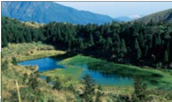
積水成池的夢幻湖，是陽明山國家公園的招牌景點之一。