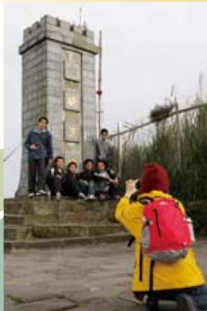
硬漢嶺上的硬漢碑，讓不少男性登山客瞬間掉進軍旅回憶裡。