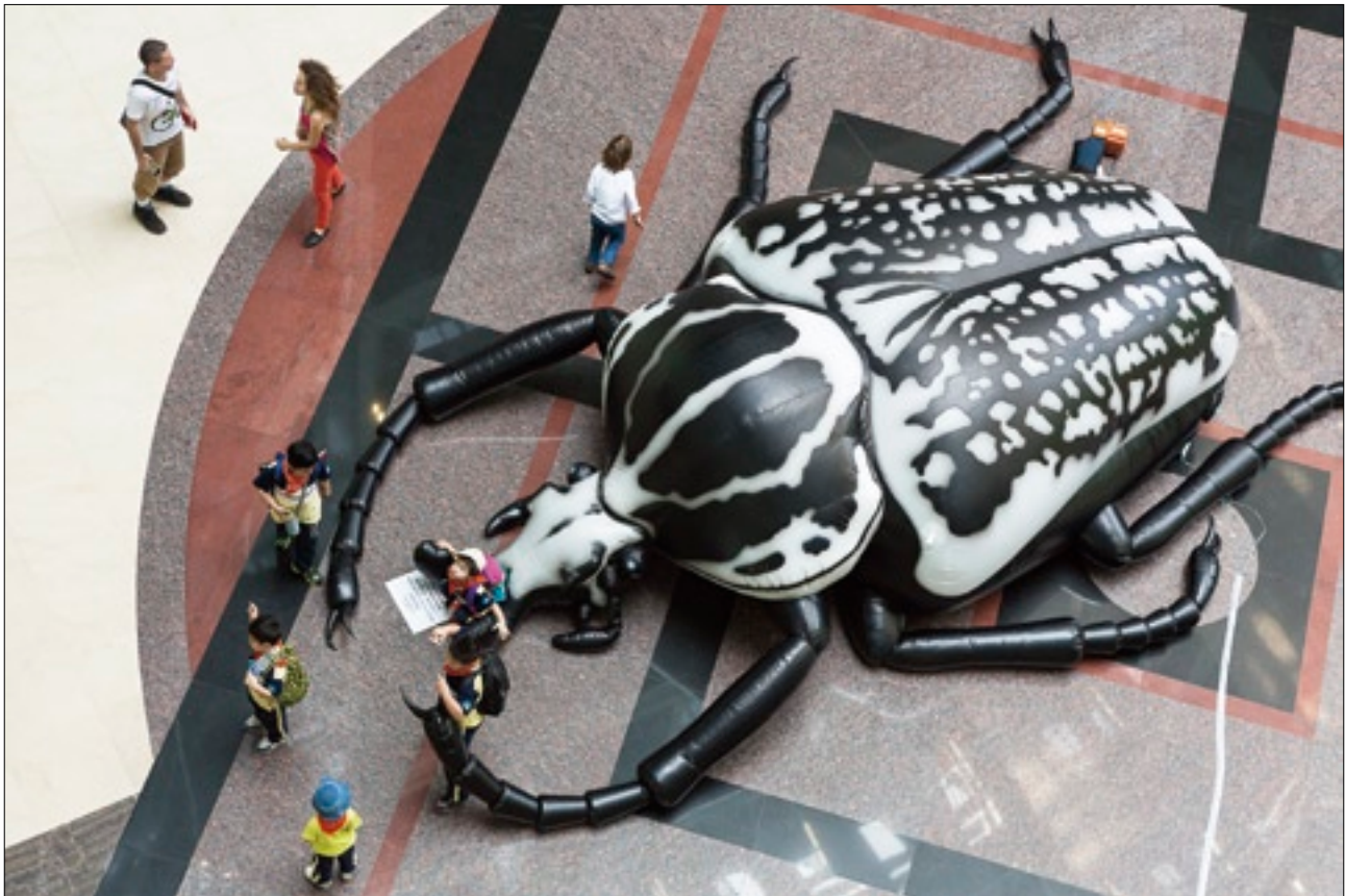
臺灣科學教育館目前展出「解開昆蟲密碼」特展，讓參觀者可以一次飽覽近兩千件昆蟲標本。

特展，在自然界，昆蟲數量之多、種類之繁複，素有「陸地之王」、「地表主宰者」之稱。這次特展展出日本教授八田耕吉耗費四十年採集的近兩千件昆蟲標本，搭配攝影作品、圖像、影片、模型，帶領觀者從1:1的真實物件近距離中，進入昆蟲的生態殿堂。入口處有放大百倍的昆蟲器官特寫，包括各種形狀的口器、走跑跳挖游捕無一不能的足部、偵測環境的敏銳觸角、表演不同飛行特技的翅膀等，無一不令人驚奇萬分。通常這類靜態展示不易討喜，但其實對於我們的思考與觀察多少有著潛移默化的影響。正如文藝復興時期的大師達文西總在自然中擷取靈感，科學家達爾文從小在自然中探索學習，對自然界的觀察與見解從19世紀影響至今。與孩子們觀察、記錄、手作，讓心底那株關於科學自然的小小種子，發芽萌發吧！