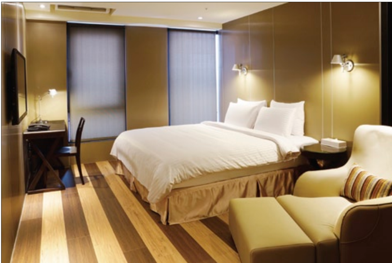
客房風格簡約俐落，搭配進口桌椅及床組，給住客靜雅閒逸的感受。

流行元素。細細逡巡一周，電梯壁貼底紋與圖騰門扣相映成趣，角落放置臺灣文創手作的展品如針線包、夾子、磁鐵小物，以及深受年輕人喜愛的手染圍巾；稍停下腳步留心一聽，還有輕快的爵士音樂聲輕揚，恍如置身Lounge Bar，處處體現出巧思用心。