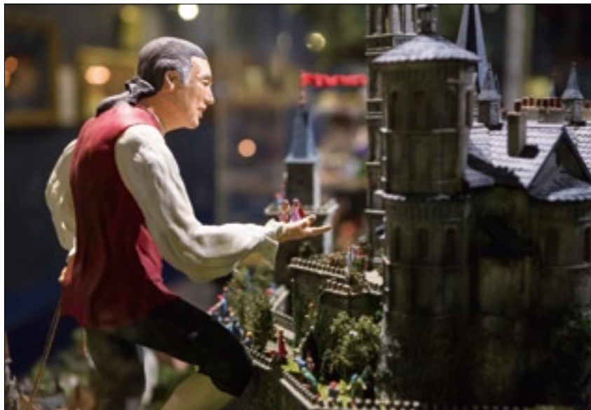
大如巨獸的格列佛對上小如螻蟻的小人國娃娃兵，令人嘖嘖稱奇。