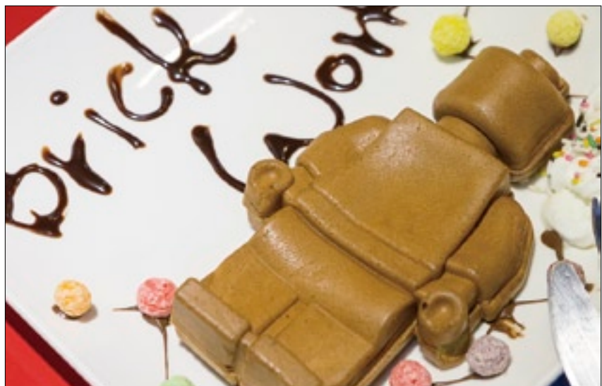
機器人鬆餅讓小朋友喜出望外，食指大動。