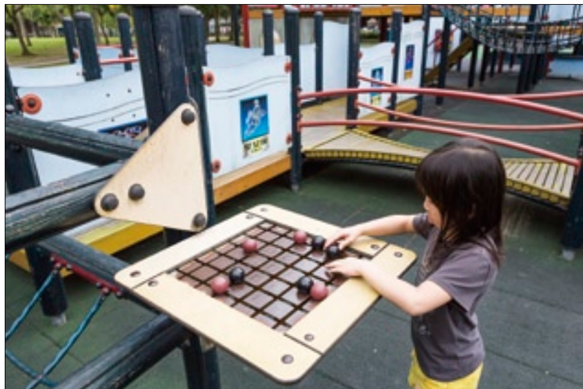
美崙科學公園的設施讓小朋友透過實地操作，了解科學知識。