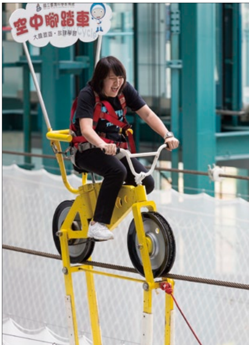
運用槓桿、張力和不倒翁重心等原理的空中腳踏車，讓你享受既刺激又安全的騎乘經驗。