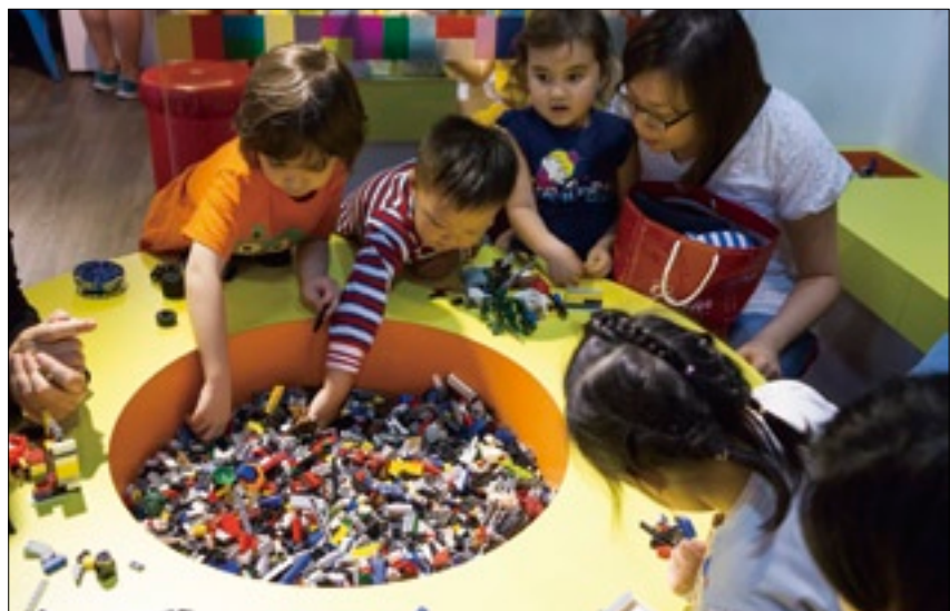
親子積木遊戲區中有滿滿的樂高組件，讓大人小孩瘋狂忘我玩樂。

自從1947年丹麥木匠奧爾·科克·克里斯蒂安森和兒子把英國公司Kiddicraft製作的膠製積木製作成「能緊密扣在一起」的積木玩具後，從此成了風靡全球的超人