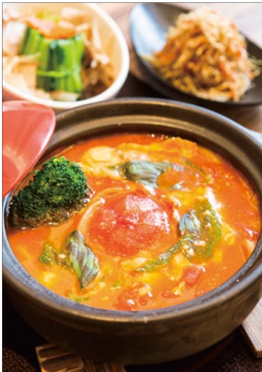
喜歡鍋物的話，讚岐烏龍麵的番茄起司鍋燒烏龍麵，等你來嘗鮮。

一日玩耍下來，頓覺「比例」這回事既是殿堂上的科學、藝術大學問，也是日常的生活、遊戲、美食小確幸，吃喝玩樂自有其真味。別老宅在家對著16：9的電視電腦放空，出外走走踏青去，玩出屬於自己的享樂生活黃金比例吧！