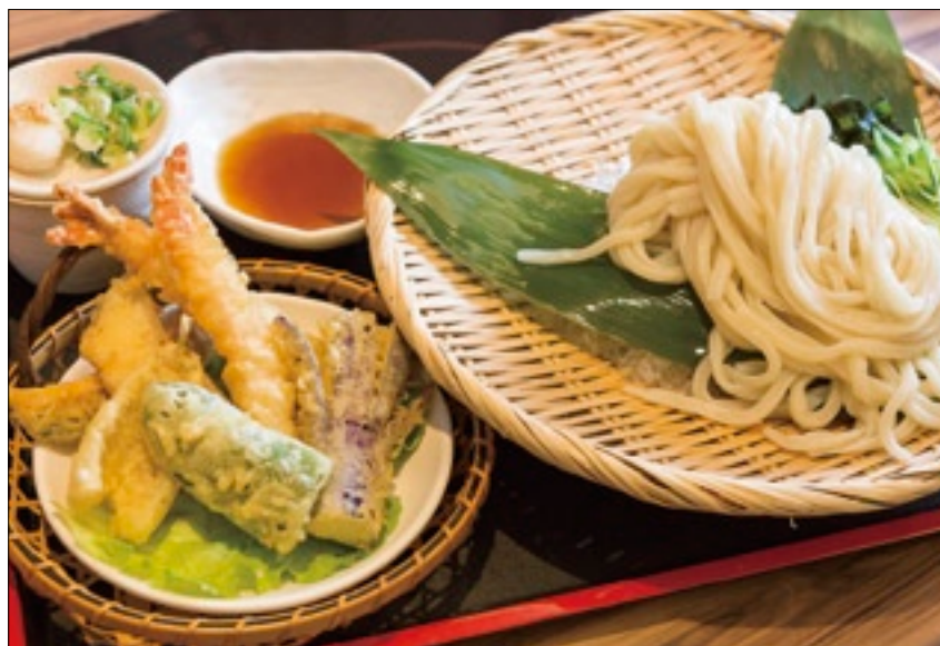
天婦羅涼麵的麵條Q彈滑跳，爽口極了。