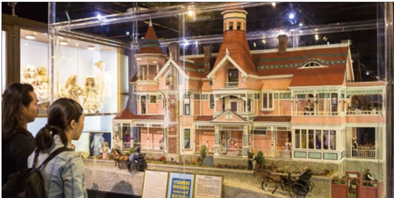
前往袖珍博物館，欣賞加州玫瑰豪宅縮小版，領略袖珍藝術的巧奪天工。