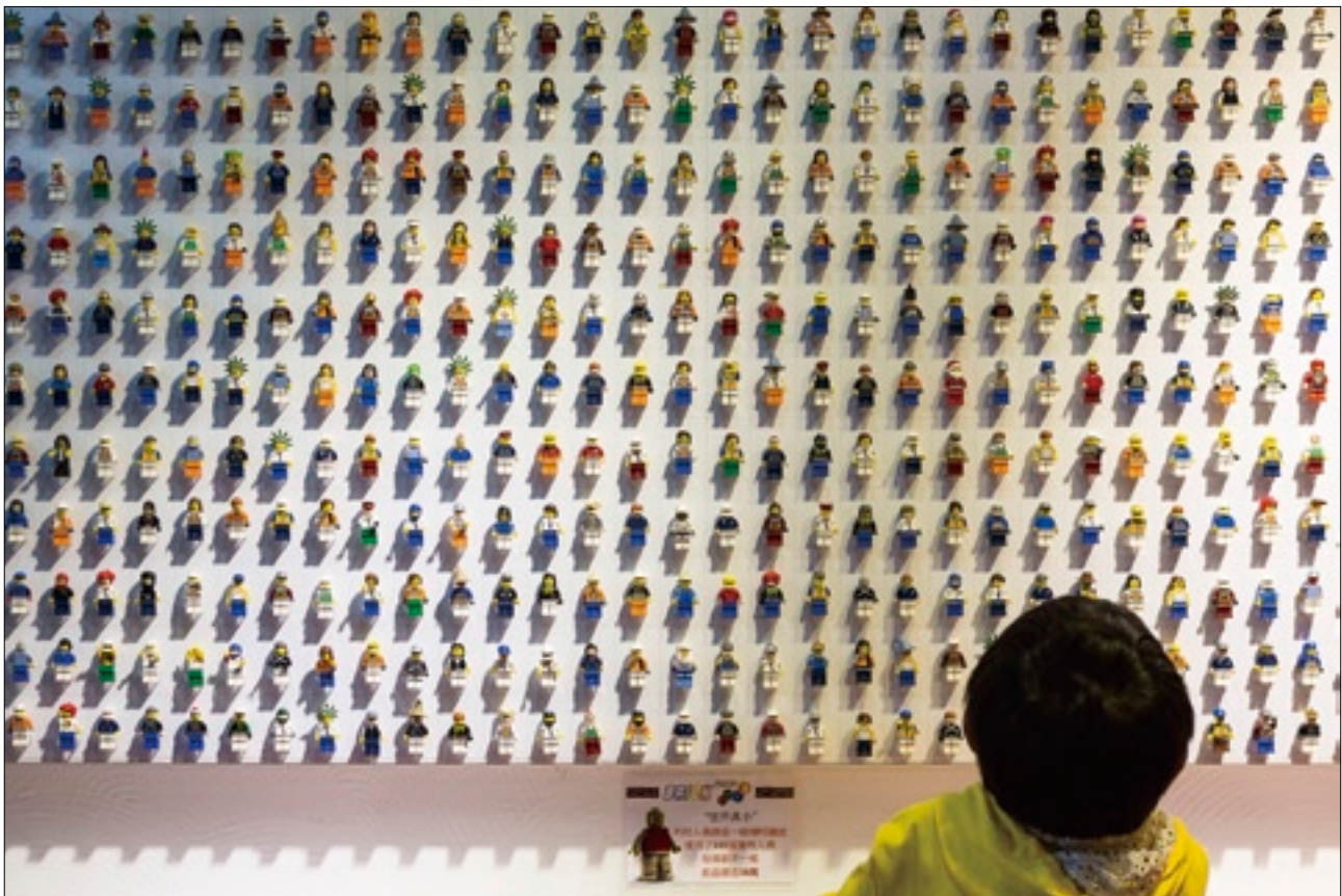
BRICK Works積木咖啡廳以樂高積木為主題，成了積木迷必來朝聖的地方。

氣益智遊戲。動用數片乃至於上萬片的積木，可以任意模擬組裝成任何比例大小的汽車、房屋、街道、機器、人物、建築模型，色彩繽紛、造型可愛，不只是激發想像、磨練創意，更是能否呈現原物完美比例的擬真精神大比拚。積木迷跨越世代、不分國籍，也難怪圓山花博園區內以樂高積木為主題的BRICK Works積木咖啡廳一開張，便成了全臺粉絲必來插旗的頭號聖地。