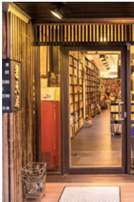
舊香居不僅是舊書匯聚之所，更是人文藝術交流的平台。

擁抱自然光，在以橘色為主調的室內空間裡，緩步踩著木頭地板，寂靜中只聽見翻書聲；站累了，找個倚窗位子稍歇，選本好書與自己心靈對話。