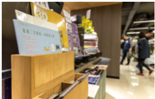
茉莉二手書店秉持「敬天、愛人、惜物」的經營理念，期許成為書籍流轉的平台。