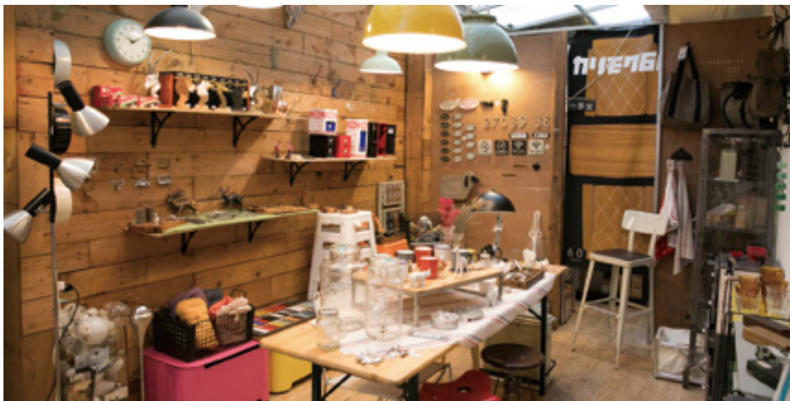
摩登波麗店內多販售 1930 至 1980 年代的歐洲家具。