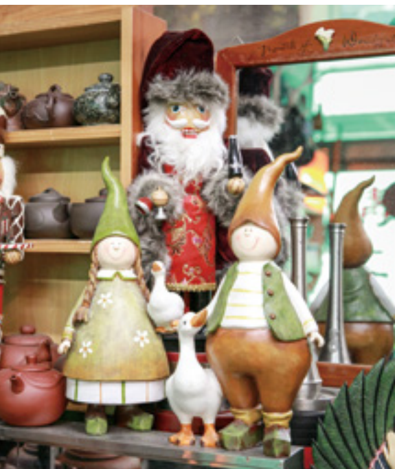
永春生活市集所販售的物品應有盡有。