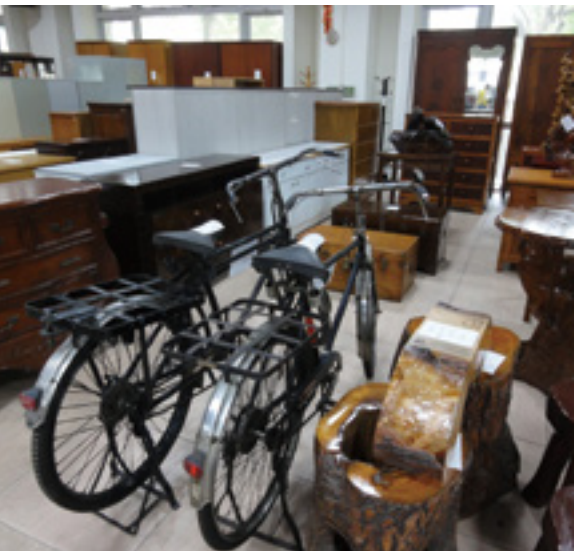
台北市政府環境保護局從廢棄家具中挑選質優者，簡易修復後每週固定拍賣，讓家具再生、再利用。