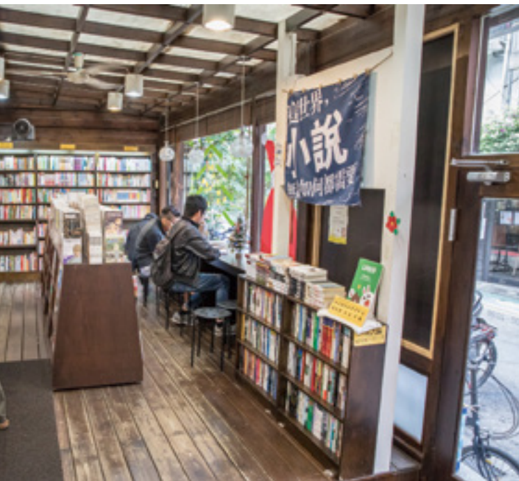
雅博客慰藉許多愛書人，甚至吸引陸客前來挖寶。