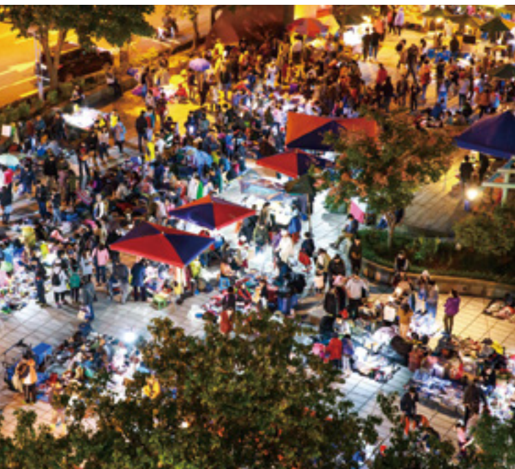
天母市集帶動商圈共榮，經營多年來，已形成當地特殊風景。

天母市集中，年輕攤主為引起注意，打扮得超有型，成為商品之外的吸睛焦點；市集以小東西居多，懷舊玩具與擺飾很受歡迎，「你不需要了，但別人當成寶。」唐笛建議，不妨趁著年前掃除，整理出多餘物品，到市集交換給他人再利用。