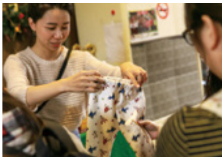
第一個以社會企業模式打造的 Holiday ya 二手市集，捐助 10% 的活動所得支持台灣流浪兔保護協會。

「天母市集最大特色就是『嚴』！」天母商圈發展協會理事長唐笛說，為保護周邊店家，禁賣仿冒品、庫存品等，每攤二手衣限售 30 件，且禁止叫賣，避免妨害安寧。