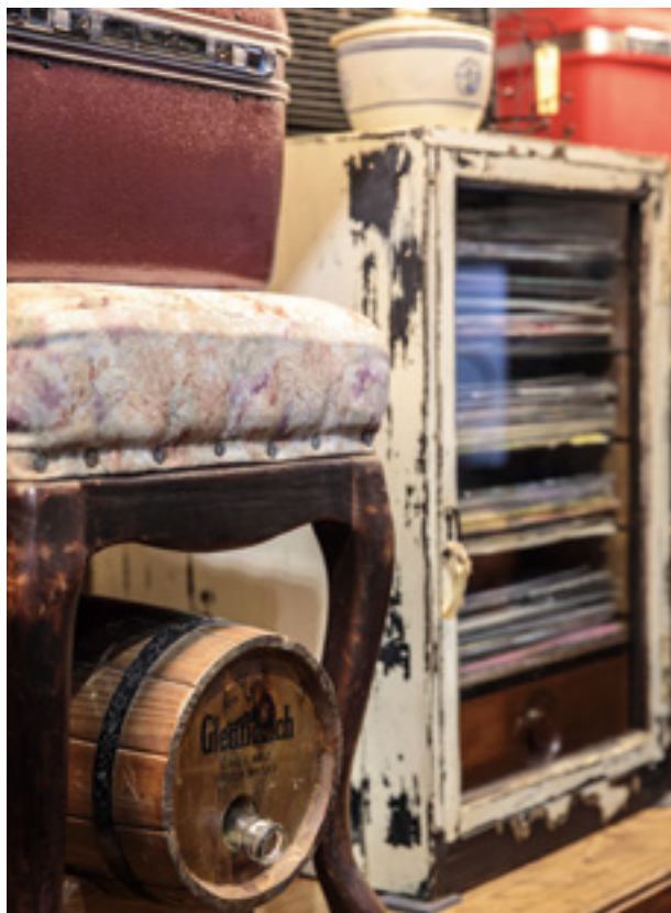
Swallow 燕子二手懷舊家具裡的老東西，是台灣人共同擁有的記憶。

燕子的老家具大部分是與搬家公司合作取得，最常收到裁縫車、轉盤電話、枱燈、書桌等，但數量與稀有品項皆有逐漸下滑的趨勢。「老東西是這個時代裡，台灣人共同擁有的記憶。」吳建興說，早期台灣的木製家具簡約樸實，大都使用本土檜木、樟木，扎實又耐潮溼