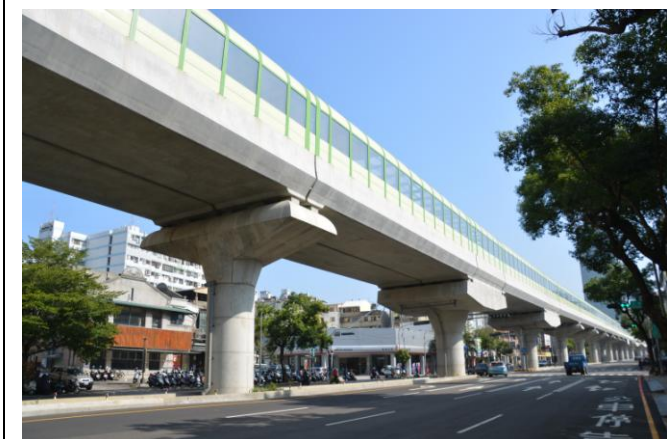
臺中線 CJ920 區段標(高架橋隔音牆完成現況)