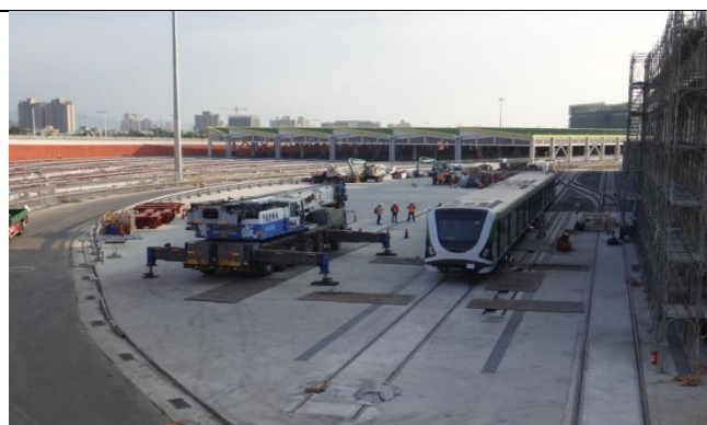
臺中線 CJ910 區段標(北屯機廠車體運送區-進行捷運列車卸載作業)