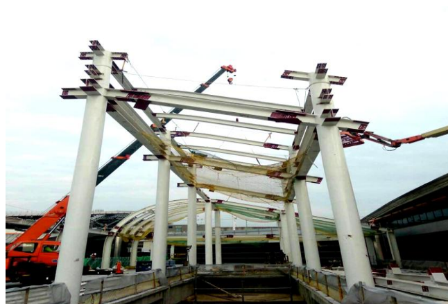
臺中線 CJ930 區段標 BSS 主變電站施工現況