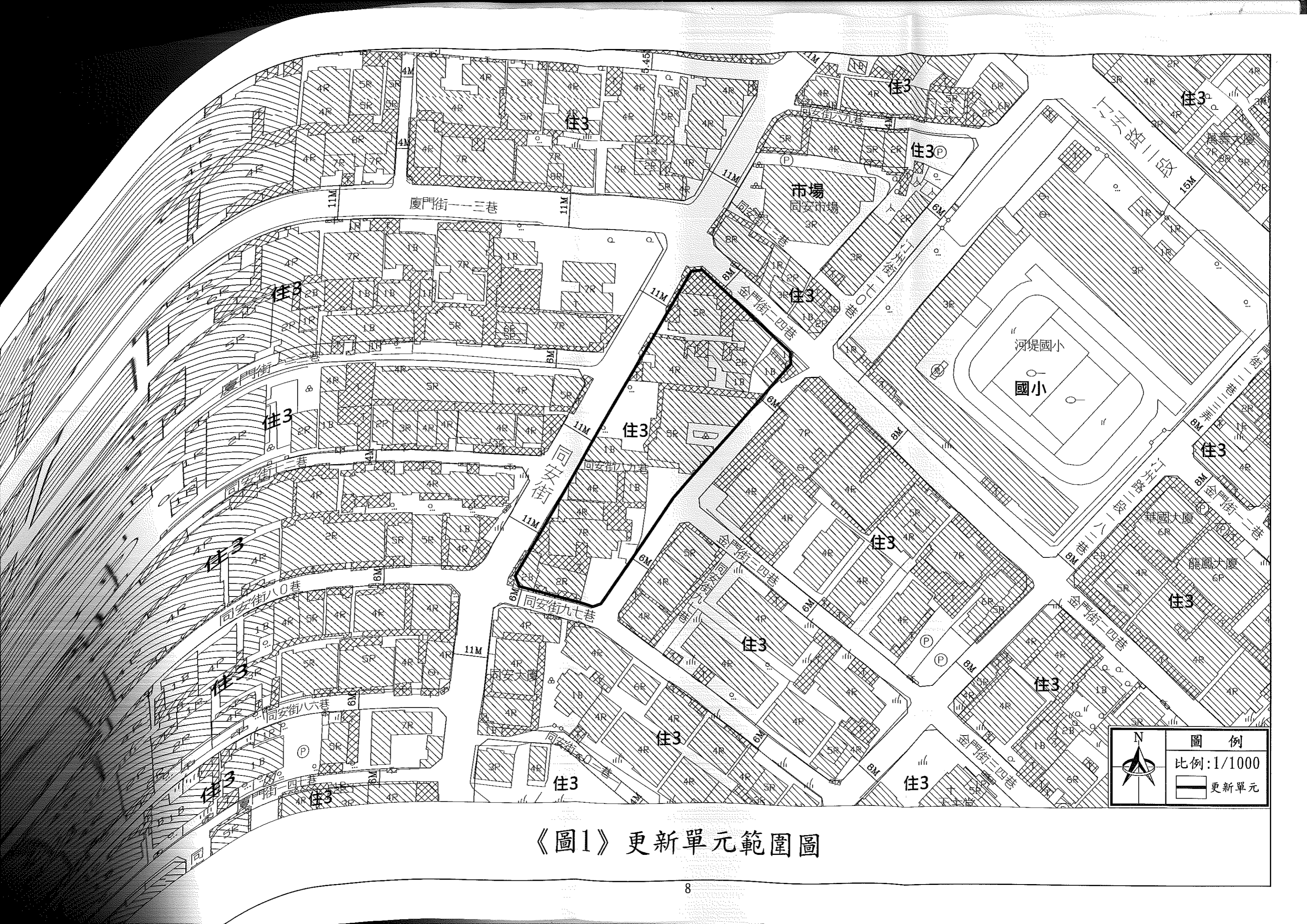
《圖1》更新單元範圍圖