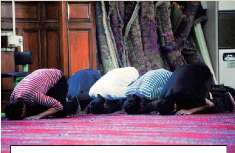
▲ Kailangan magdasal ang Muslim bawat araw

俗話說「一方水土養一方人」，一個地方的飲食文化往往反映了當地的特殊風土產物和人情。在印尼，牛、雞和魚，是最為普遍的三種動物類合法且佳美的食物。人們除了遵循伊斯蘭教法的飲食文化之外，由於在地氣候風土的關係，盛產香料，習慣在菜肴中加入椰漿及胡椒、丁香、豆蔻、咖喱等各種香料調味，以及辣椒、蔥、薑、蒜等，在餐桌上常常可見辣椒醬。居民的主食是米、玉米或薯類，尤其是大米更為普遍。大米除煮熟外，印尼人喜歡用香葉葉或檸檬草把大米或糯米，包成菱形蒸熟而吃，稱為「克杜巴」。不過，印尼人也喜歡吃麵食，如吃各種麵條、麵包等。