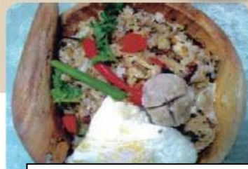
Salted fish fried rice