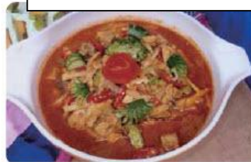
Coconut sauce vegetable soup