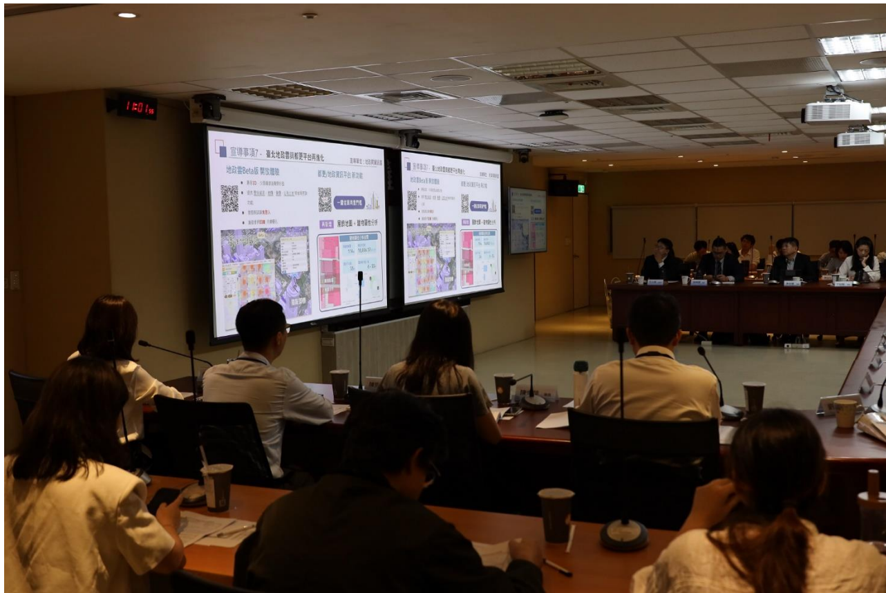
本局地價科業務宣導