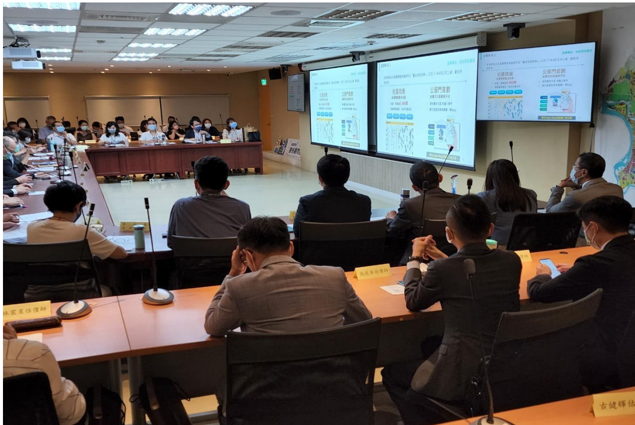
本局地價科業務宣導