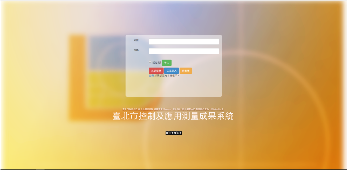
臺北市控制及應用測量成果系統首頁