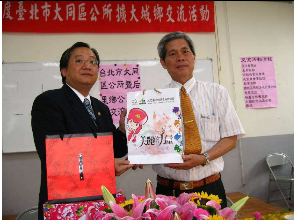
說明：致贈花博會文宣品及伴手禮