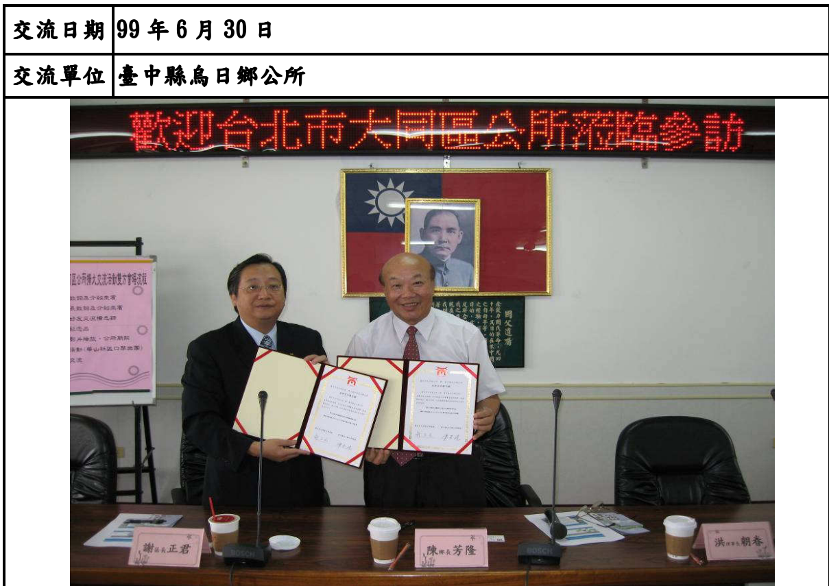
↑ 說明：與烏日鄉交換友好交流備忘錄