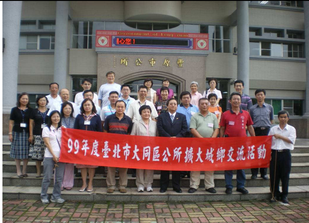
說明：與豐原市同仁合影