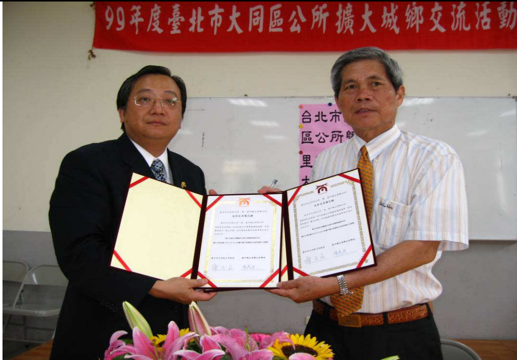
說明：與后里鄉交換友好交流備忘錄