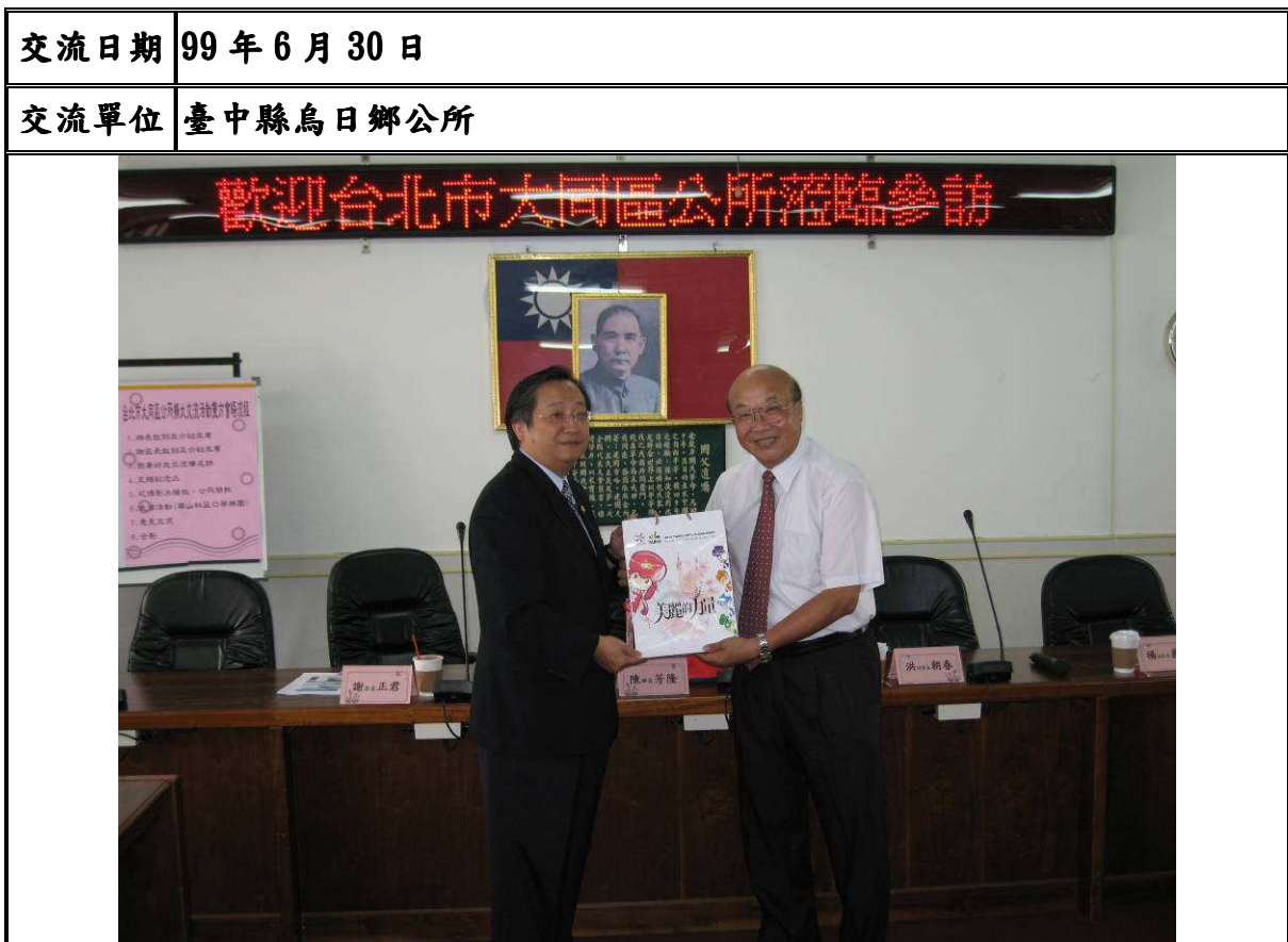
↑ 說明：致贈花博會文宣品