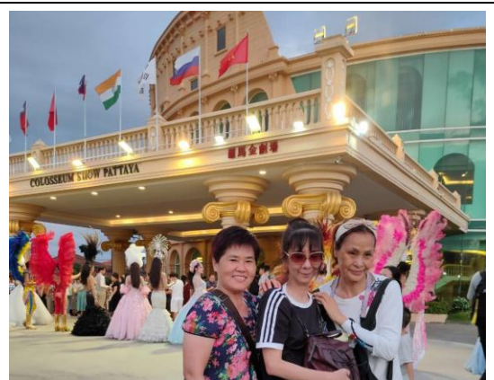
6/03 國際舞台古羅馬競技場人妖秀劇場