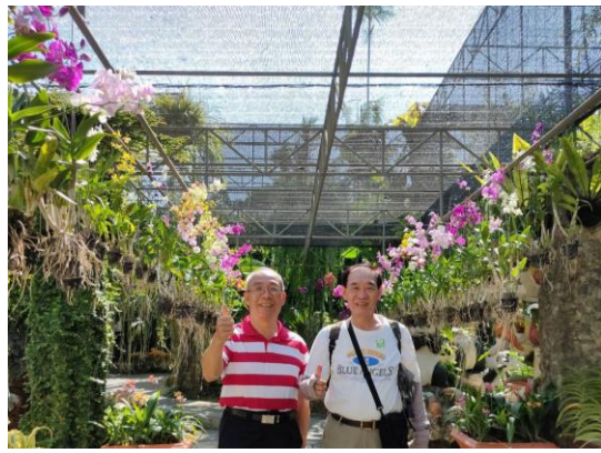
6/04 暹羅傳奇樂園植物種植栽培實驗館