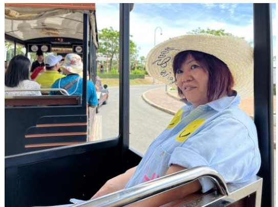
6/04 暹羅傳奇樂園遊園火車