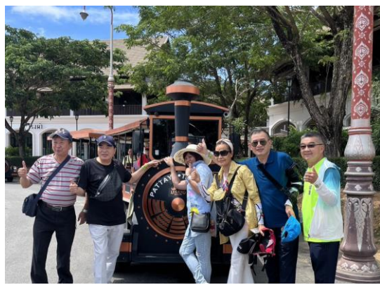
6/04 暹羅傳奇樂園遊園火車