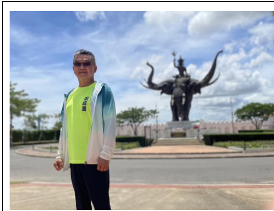
6/04 印度象神愛侶灣三頭神像