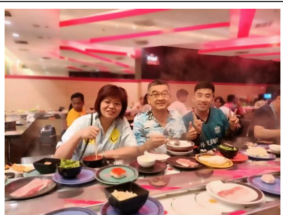
6/04 暹羅傳奇樂園內自助餐廳