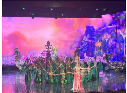
6/03 國際舞台古羅馬競技場人妖秀劇場