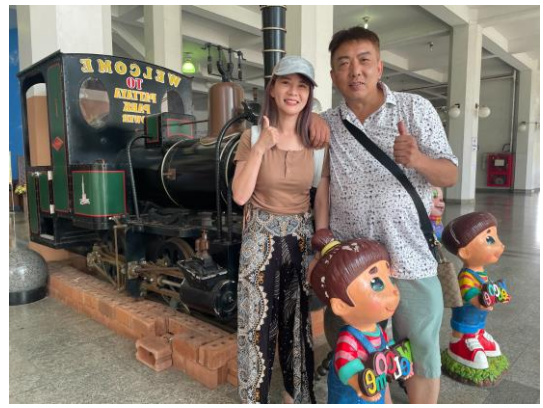
6/04 暹羅傳奇樂園遊園火車