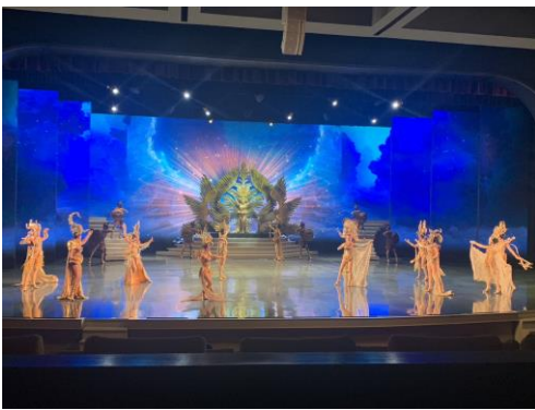
6/03 國際舞台古羅馬競技場人妖秀劇場