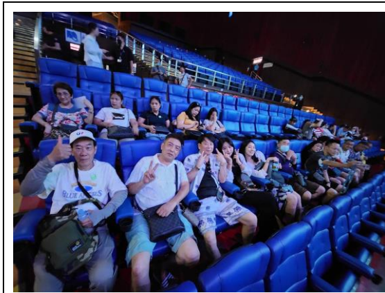
6/03 國際舞台古羅馬競技場人妖秀劇場