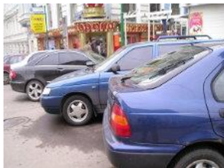
交通紊亂，車輛到處隨便停車