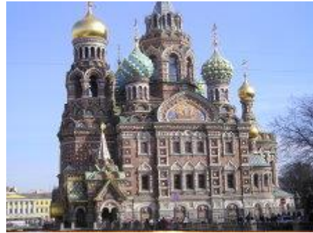
聽導遊解說~~~凱薩琳宮