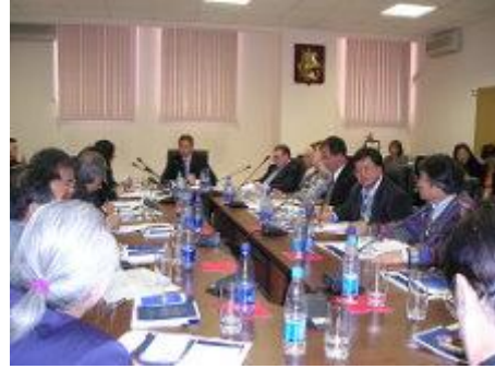
莫斯科中央區公所接待座談會