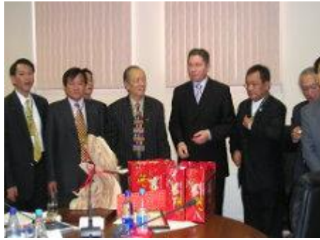
中俄雙方互贈紀念品