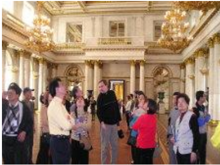
聽導遊解說冬宮-隱士盧博物館

19)。大夥至當地跳蚤市場，觀看俄羅斯的各式各樣日常用品、飾品…包羅萬象，比美臺北夜市。