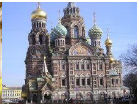
聽導遊解說~~~凱薩琳宮