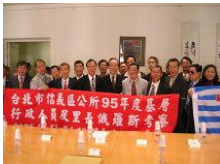
與本國代表處雙方留影紀念

里長們與代表處長官閒話家常後，互贈紀念品，隨即接受代表處熱情午宴款待（日本料理），賓主盡歡，熱情合影，依依不捨離去，接續下午行程。