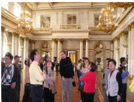
聽導遊解說冬宮-隱士盧博物館