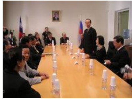
駐俄代表處陳代表歡迎致詞

歡迎大家到訪，向各位簡述非邦交國的外交困境，以上次台南縣政府參訪為例，正式向官方提出申請被拒，經運用各種管道，耗時3週方獲得對方同意，基於上次經驗，在貴所提出申請時，直接敦請議員先生協助，經1週的努力，即得到對方允諾，特別提出向大家報告。