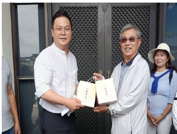
劉部長致贈皇南餅