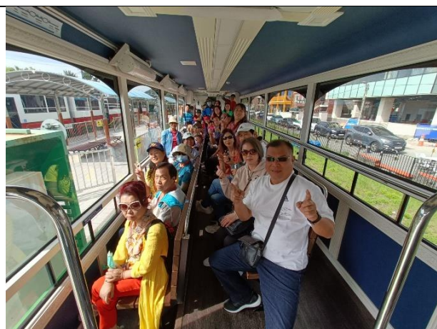
海雲台海岸列車合影