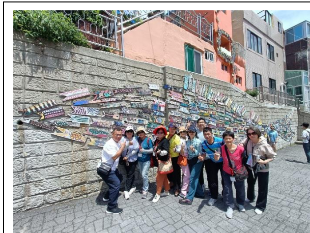
甘川洞文化村壁畫合影

沿著山麓井然有序的階梯式集體住宅，與四通八達、如迷宮一般的小巷，形成甘川文化村獨有的特殊景觀，被人們稱為釜山的馬丘比丘。美麗繽紛的村落，是韓國保留面機最大，且目前仍有許多居民居住的月亮村，即韓戰時期的難民村。於 1950 年代韓戰時期，因南韓軍隊一度敗退，釜山一時湧入大量難民，而這些難民們身無分文，物資匱乏，最終在無人居住的山坡地，以梯田形式一路向山上比鄰而居相依而存，形成難民村。為洗去難民村標籤，並且重振甘川洞的歷史文化價值，政府、當地居民及多位藝術家於 2009 年開始共同推動城市再生工程，主張保護與再生，將創意藝術融入生活文化，成為一個生活友好型村莊。該社區朝三大目標努力，分別為居民可以持續居住、對遊客友好、居民可以自己維持，期待生活與藝術共存。藝術家們將緊鄰的房屋漆成各種繽紛的顏色，也畫上各種美麗的壁畫作品，並創作許多裝置藝術。其中最著名的就是在甘川洞壁畫村入口不遠處，由一片片各式花樣木板拼成的魚型作品以及韓國人十分喜愛的小王子裝置藝術。甘川洞文化村曾於 2016 年獲得大韓民國空間文化大獎的總統獎，近年更是一年有 185 萬人次造訪的著名觀光景點。