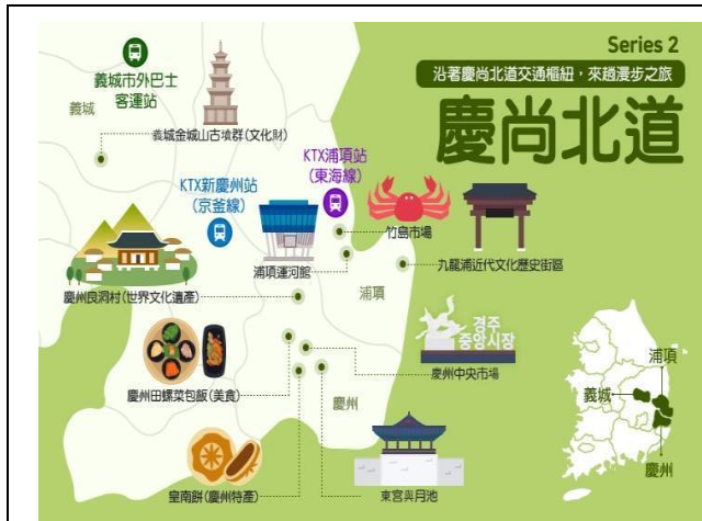
拜會慶尚北道文化觀光公社-劉部長介紹圖