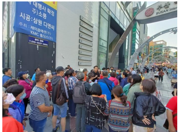
參觀 BIFF 廣場