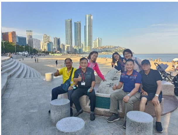
海雲台海水浴場合影

新羅文學家崔致遠用自己的號「海雲」所命名，是韓國人的度假勝地，以寬廣的沙灘、大海聞名，同時代表釜山海邊城市的形象。海雲台海水浴場（해운대해수욕장）長 1.5 公里，是夏季避暑勝地。每年農曆正月十五日元宵節舉辦迎月節，每年冬天舉辦北極熊冬泳大會及各式活動。位於海雲台的電影殿堂（영화의전당）是每年釜山國際電影節的主場館。從海水浴場沿著沙灘往西走，便抵達冬柏島（해운대 동백섬），此島以冬天開滿山茶花（冬柏花）聞名。原為一座獨立的島嶼，經河流泥沙推積後，逐漸與陸地相連形成陸連島。統一新羅末期的文學家崔致遠與許多詩人墨客皆曾於此吟詠詩詞，至今仍處處可見他們的刻字、銅像及詩碑等。另海雲臺觀光特區的核心觀光設施之一，為海雲台 Blueline Park 海濱列車（해운대블루라인파크），於 2021 年 10 月開通，由位於海雲臺尾浦-青沙浦-松亭區段長達 4.8 公里的舊鐵道改建而成，分為地面鐵道的海雲台海岸列車和走空中軌道的海雲台天空艙列車。觀光列車本身造型繽紛可愛，沿途面向大海，風景一覽無遺，串聯各景點、店家供遊客一次走訪，連帶促進區域性觀光。