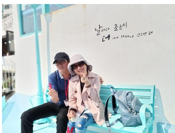
白淺灘文化村合影