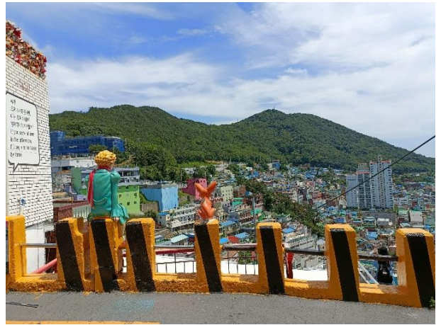
知名地標-狐狸與小王子