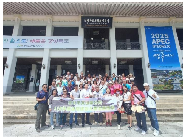
慶尚北道文化觀光公社團體照