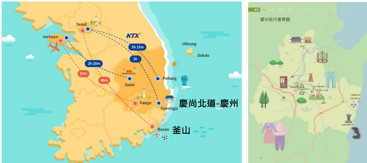
南韓地圖-參訪地相關位置圖

本區基層建設人員走出臺北市文山區也走出臺灣，藉由參訪南韓釜山及慶州，學習當地政府機關對於文物古蹟維護及觀光行銷方面之規劃及發展。透過親身走訪，認識當地文化歷史脈絡與文物古蹟，拓展基層建設人員多元文化觀，並學習其運用自身優勢，結合觀光行銷技巧，將地方特色推向國際觀光市場，邁向永續化經營。此次考察主題為釜山觀光景點行銷規劃及特色文化村轉型發展、慶州歷史遺址區的文物古蹟維護與環保觀光旅遊規劃，據此本次選擇南韓釜山及慶尚北道-慶州作為考察地點原因如下：