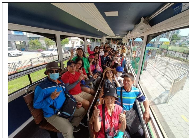
海雲台海岸列車合影