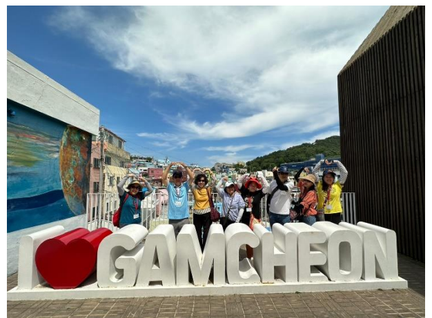
甘川洞文化村合影