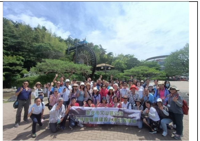
普門觀光園區團體照