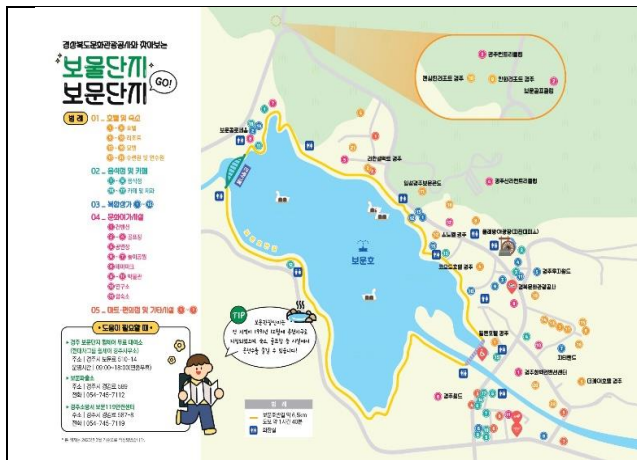
普門觀光園區圖

政府於 1971 年制定此區為慶州綜合開發計劃的一部分，以打造綜合度假區為目的的開發。於 1979 年 4 月開始營業，佔地面積約 1033 公頃，是以普門湖為中心的國際光觀園區。慶尚北道文化觀光公社正努力將普門旅遊園區打造為成古色古香、全年開放的溫泉型旅遊勝地和內陸型旅遊勝地。普門大水車公園位於普門觀光園區入口處，由德洞湖水沿渠而下，使水車在自然動力下轉動，是遊客欣賞秋天樹葉的熱門地點。園區內有國際會議場即觀光中心、高爾夫球場、綜合性商店、旅遊飯店等設施，皆依韓國傳統形式建造。