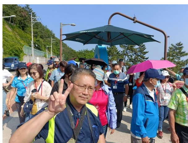
參觀白淺灘文化村