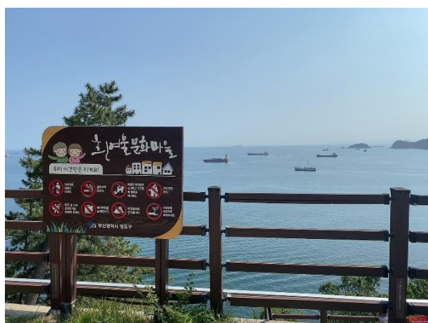
白淺灘文化村沿海風景

位於蓬萊山下，房屋倚著陡峭懸崖地形建造而成的村落，因沿蓬萊山蜿蜒而下的小溪，遠看如白雪飄落般，故稱為白淺灘文化村。前為韓戰過後由難民聚集形成的村落，2011年12月影島區城市再造計畫展開，街邊老舊民宅開始整修，藝術家與居民合作重整，增添許多壁畫、裝置藝術作品及海濱人行道，吸引許多文青咖啡廳、個性小店、自創品牌進駐，更有許多知名韓劇、電影在此取景，一步步轉型為當今有名的海岸文化村。