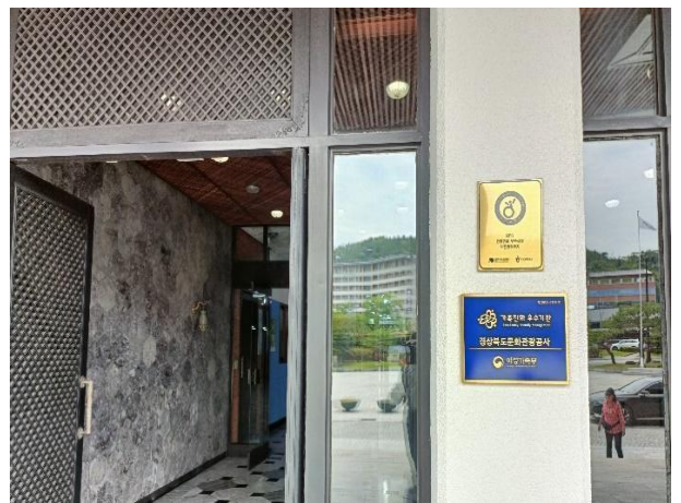
慶尚北道文化觀光公社