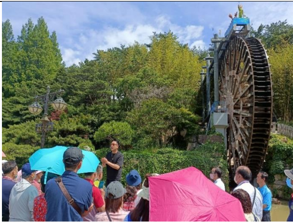
參觀普門觀光園區