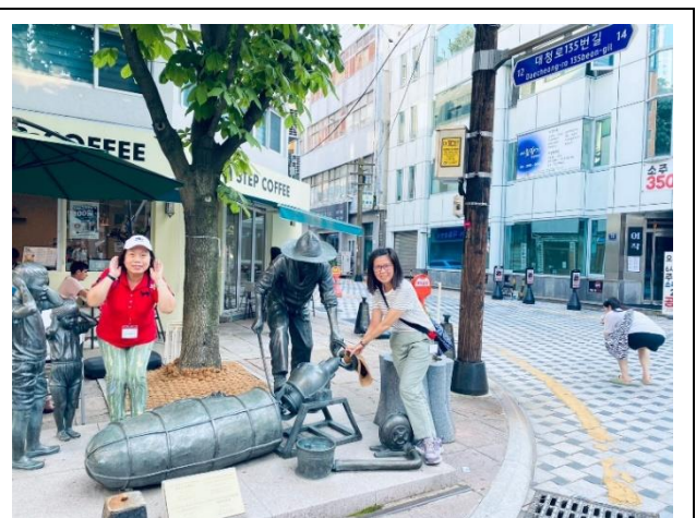
40 階梯文化觀光主題街雕塑