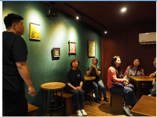
店面座位空間的擺設與設計