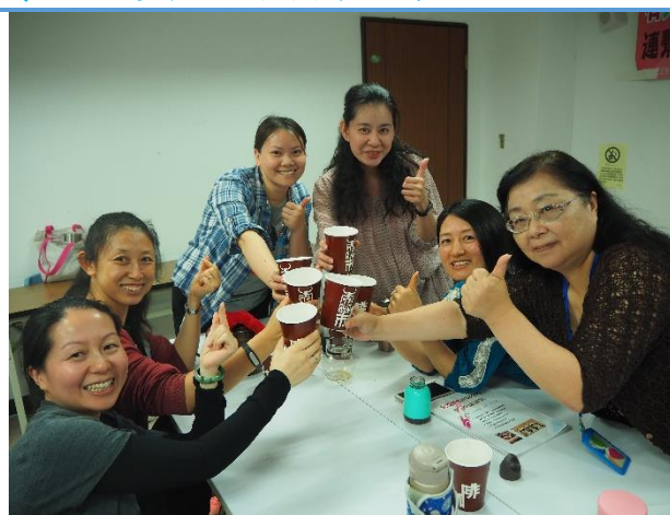
互相品嚐各自泡的咖啡