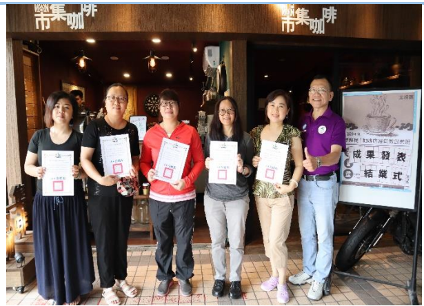
頒發研習時數證明