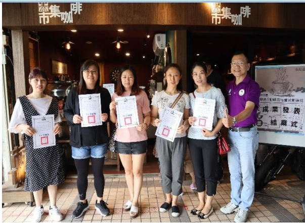
頒發研習時數證明