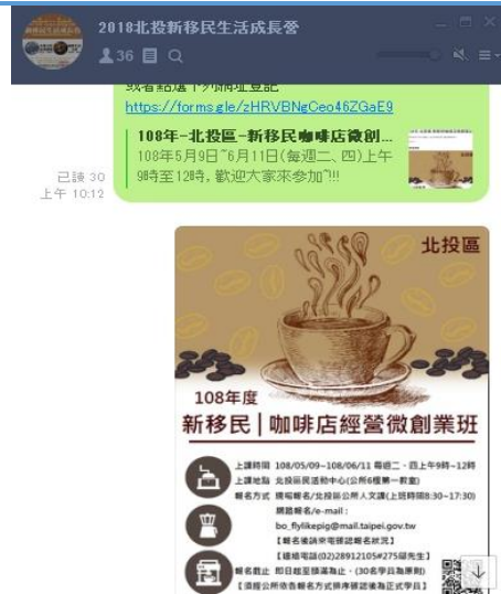
2018新移民生活成長營 LINE 群組