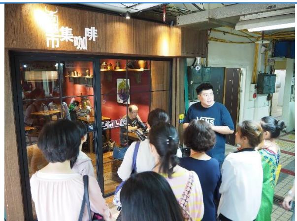
店面外觀的選擇與客人組成之影響