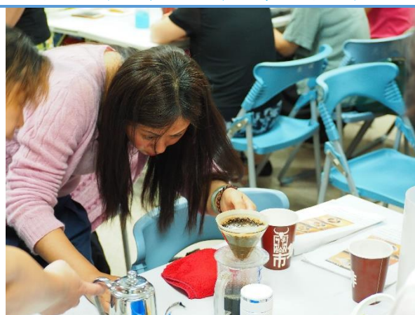
拿捏好適當的水量與萃取時間