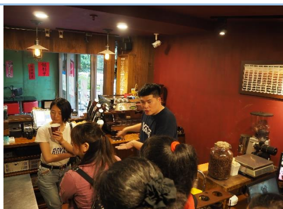
學員現場製作一杯專屬自己的咖啡