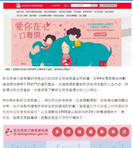
新住民培力發展資訊網