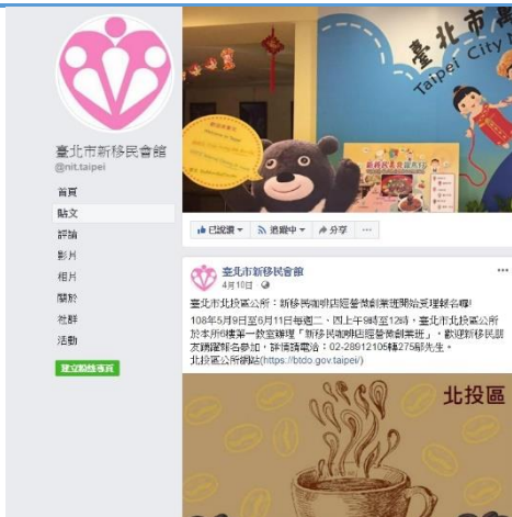
臺北市新移民會館臉書