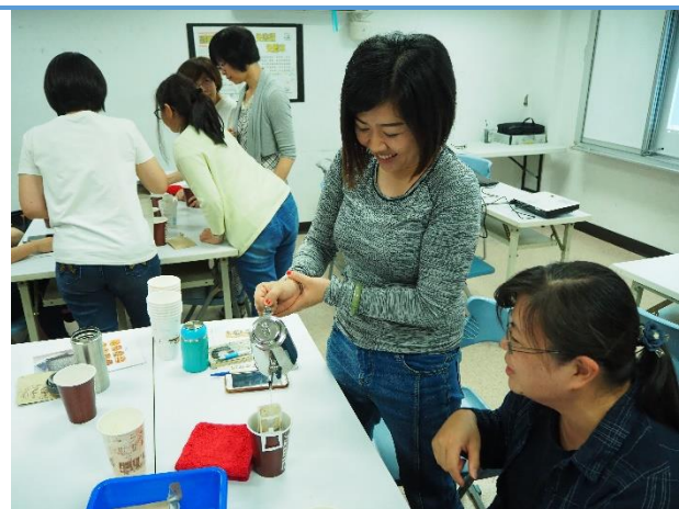
學員練習沖泡耳掛式咖啡包