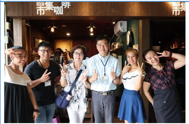
工作人員與學員合照