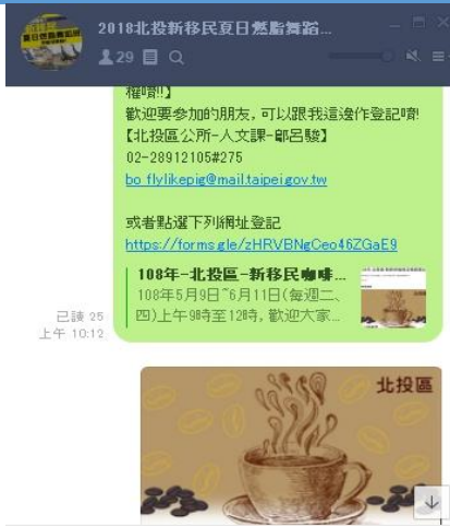
2018北投夏日燃脂舞蹈班 LINE 群組