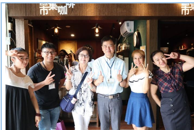
學員與工作同仁合照