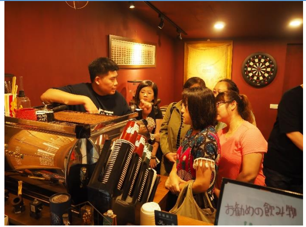
Espresso 機器實際操作與體驗