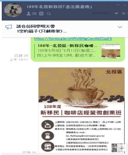
108年書法墨畫班 LINE 群組