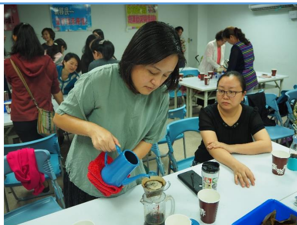
不同器具沖出來的咖啡也有不同風味