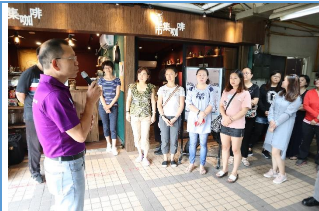
副區長陳奕源蒞臨致詞