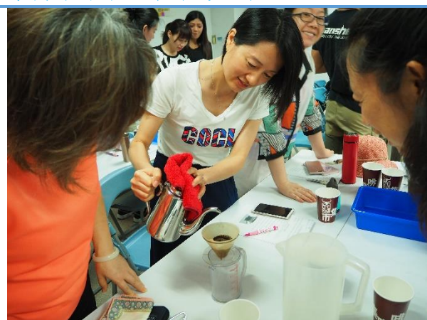
手工沖泡咖啡分組練習