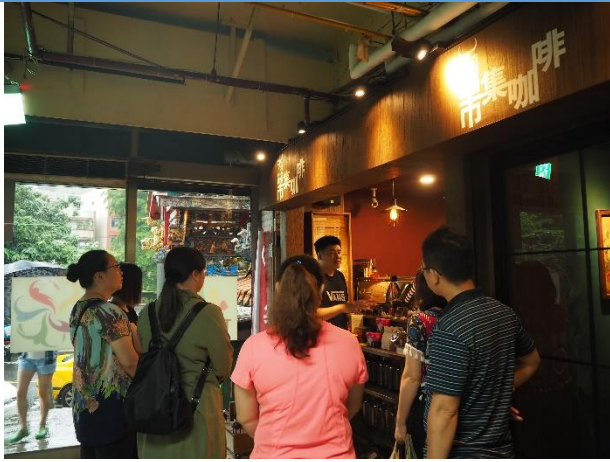
咖啡店面的第一印象與擺設