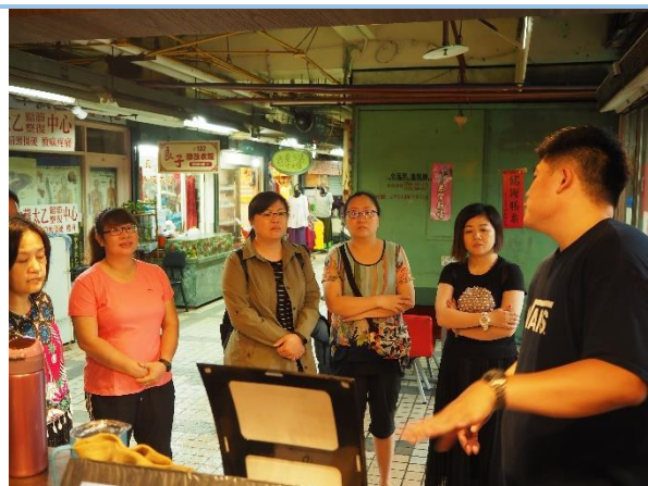
咖啡店店面設計與陳設經驗分享