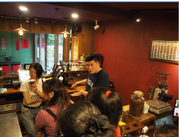
冷吧檯的解說與動線設計