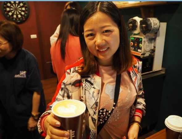
老師的咖啡拉花示範