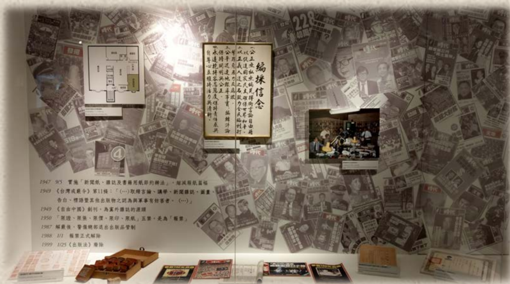
①自由時代週刊(攝於鄭南榕基金會內)

《自由時代》在鄭南榕的主導下，對於當時渴望民主、自由、人權、獨立的臺灣人是極有號召力。為了不讓臺灣人以為主張臺灣獨立只是口頭說說，1988年12月10日，《自由時代》週刊刊登了許世楷的〈臺灣共和國新憲法草案〉，也造成國民黨當局以涉嫌叛亂要逮捕鄭南榕，但鄭南榕已經表明國民黨當局只能抓到他的屍體，最後更以死殉道。