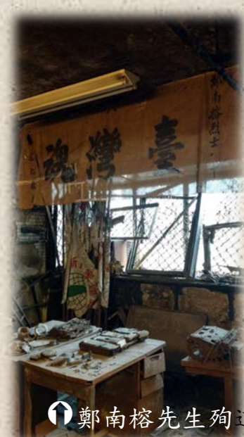
↑鄭南榕先生殉道處 (攝於鄭南榕基金會內)

鄭南榕自焚後，《自由時代》週刊系列《鄉土時代》週刊，以黑色為封面出刊第272期紀念專輯，悼念為臺灣建國犧牲的烈士，警備總部隨即將下一期雜誌查禁。1989年4月14日，由臺大大論社、濁水溪社、勞工社、噬菌體社等十餘社團成員組成的「爭取百分之百言論自由學生行動委員會」，在臺大校門口發起全日靜坐禁食活動，追悼自焚而死的《自由時代》負責人鄭南榕，並舉辦「言論自由、思想無罪」說明會。