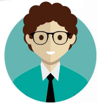
業者 (租賃住宅服務業)