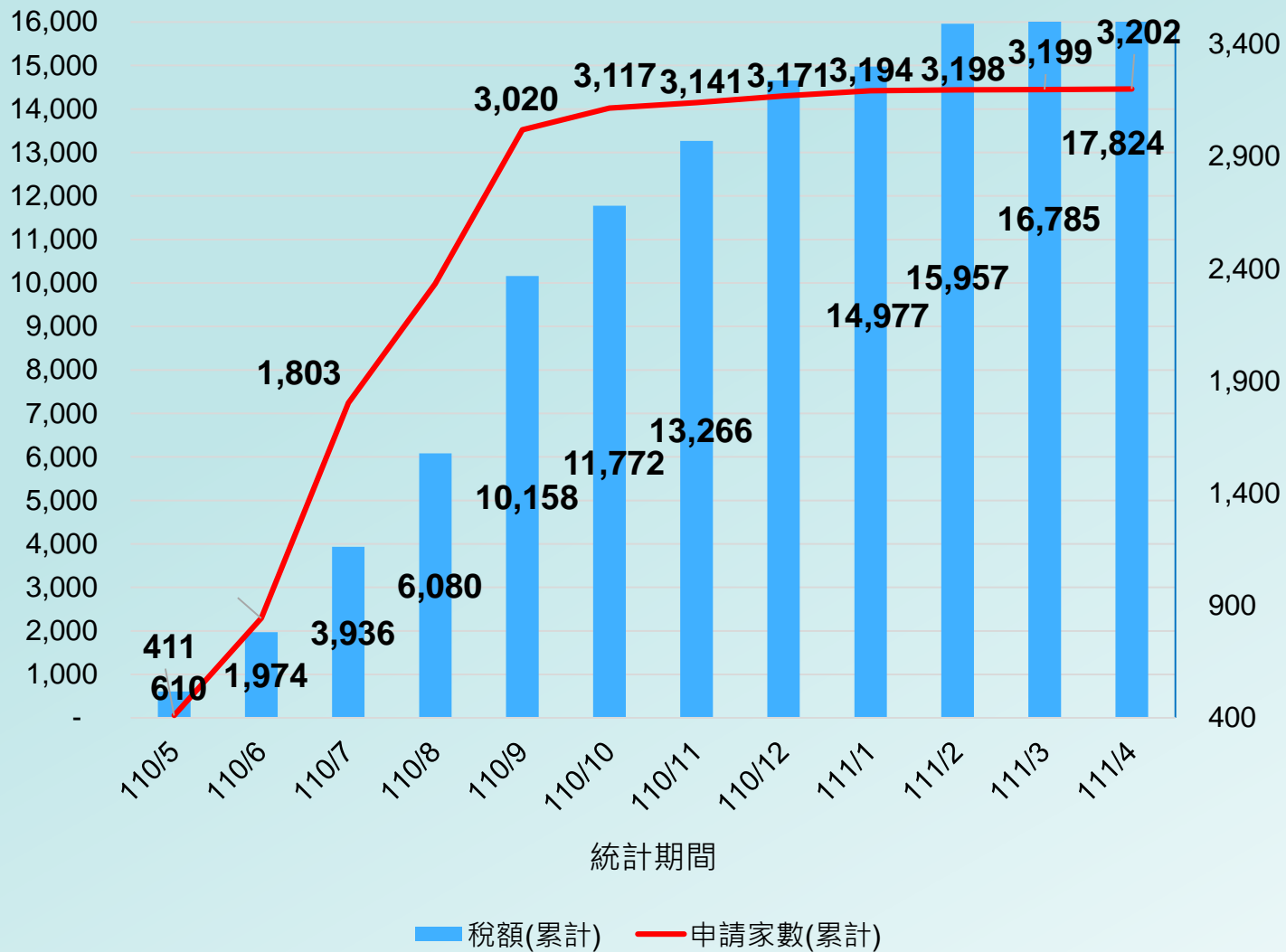
房屋稅降稅家數及稅額累計數