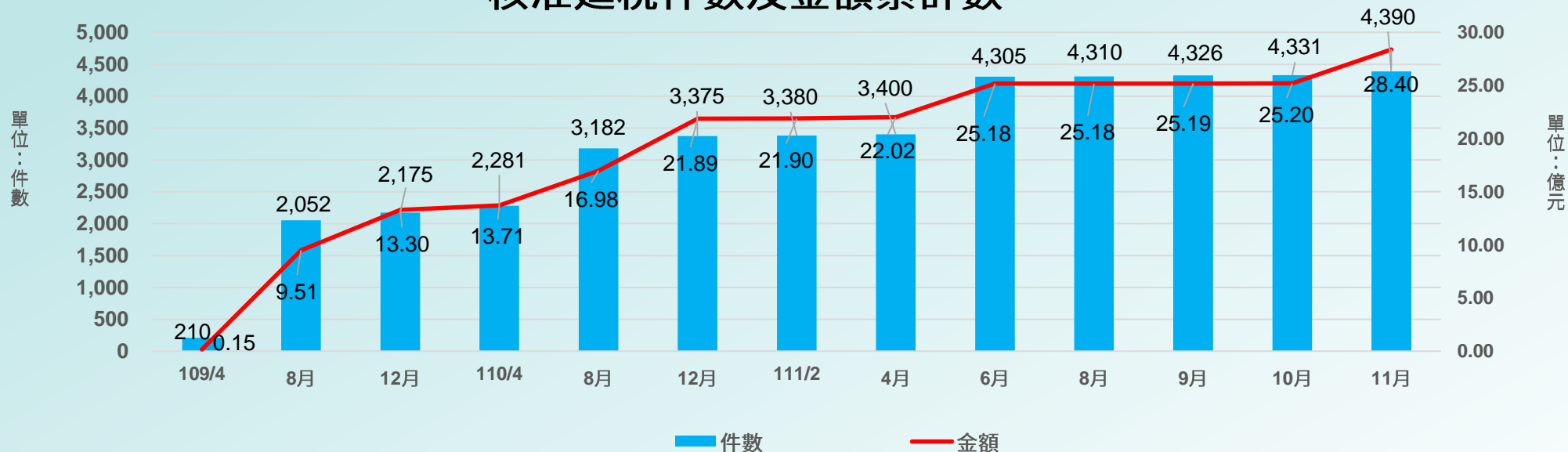
核准延稅件數及金額累計數