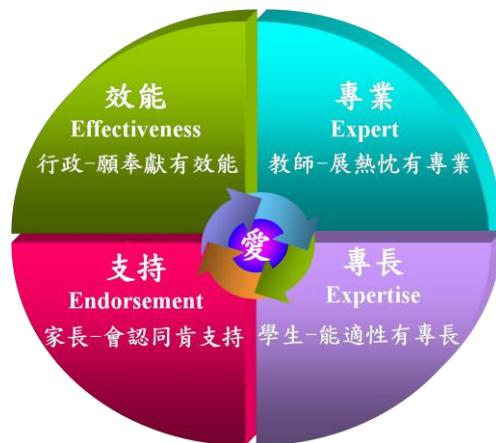
理念與目標結合圖

E=MC^2 (Expertise = Mentor *Curriculum * Circumstance)