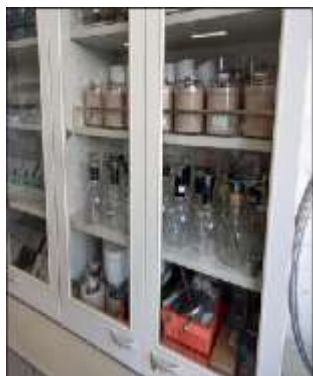
圖 9 說明：物理實驗室擺放整齊的櫃子。

這幾年學校的衛生環境每況愈下，學生生活習慣不好，導師相當辛苦。如何要求學生的打掃，才可改善校園的整潔，營造好的學習環境呢？建議可以請班級整潔經營有方的導師分享治班之道，或者請班上學生自己提供方法。