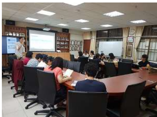
圖 35 說明：第三次準備會議影像