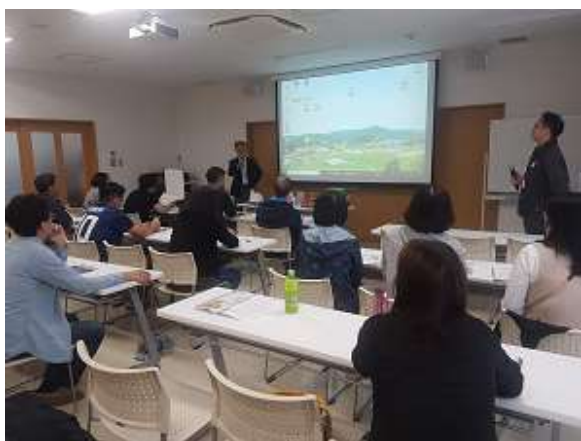
圖 25 說明： 阿布先生認真地介紹地震災難時的應對及避難時攜帶的物品與急救包的內容物。

而和臺灣一樣位於地震帶國家，臺灣對於地震的經驗認知亦不亞於日本，但 311 地震的海嘯襲擊，特別是這次參訪的日本東北地區南三陸町所承受到的傷害，更是令人難以想像地嚴重。大自然反撲的力量，直至今日回首八年前的經歷，亦令當地居民餘悸猶存。八年來，劫後餘生的居民，除重建一所規模龐大的現代化醫院，更是在浩劫重生後，開啓全新的生活方式。