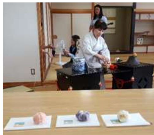
圖 22 說明：水澤高校是個重視實學，體驗學習的學校，校方特別安排的日本文化體驗活動，茶道老師示範茶道。