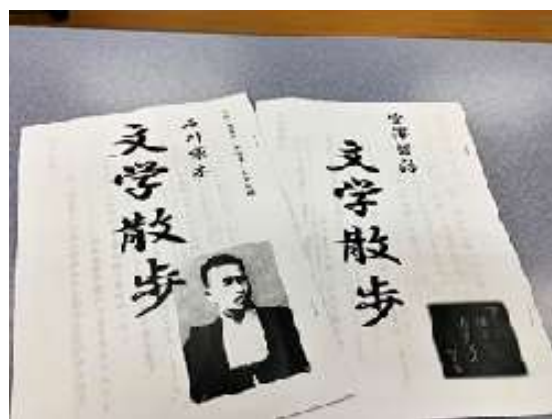
圖 14 說明：文學散步課程學習單。