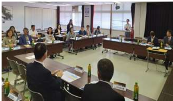
圖 3 說明：城南高校歡迎會，前排為兩校校長、主任，後排為大理教師團隊。

包括大理及該校教師都有感於學生在高中時期對體育學習的積極態度與喜愛，在未來課程中必須順應時代潮流而改變，調整成以生涯學習體育的終極目標，來調整適合全民的體育教育範本，而首要條件則是必須提高學生學習興趣，故日本老師正朝此目標，調整及修正教學方向與學習經驗，彼此更進一步地交流學習及成長。