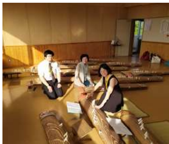
圖 20 說明：古箏體驗。