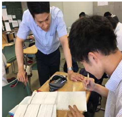
圖 8 說明：特進科學生與教師。