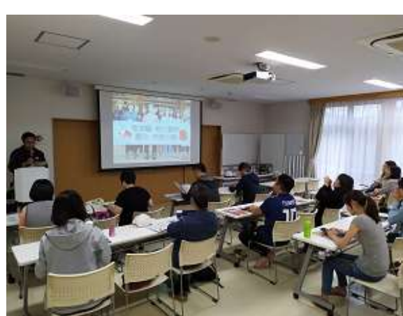
圖 28 說明：觀光協會辦理的國際交流活動：災後生命教育。