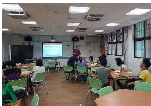
圖 34 說明：第二次準備會議影像