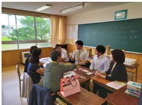
圖 17 說明：數學領域交流，利用大理自行設計的桌遊遊戲破冰。

數學領域交流的過程中，因鑒於兩校語言不通，於是在臺灣時，便事先準備了一些數學相關的遊戲，內容包括本校自行設計的桌遊。這類寓教於樂，遊戲當中學習的課程，亦受到日本老師的好評，現場雙方不需透過語言，竟也能溝通無礙，迅速理解桌遊的內容與玩法，現場笑聲連連，皆大歡喜。兩校有感於高中學生面臨學習的困境，對於未來的教學必須順應時代潮流，調整為以學習者為中心。但首要條件則必須提高學習興趣，故日本老師亦正朝此目標，調整教學的方向，該校打算明年二月再回訪臺灣時，提供水澤一高的數學教學經驗，期望彼此能更進一步交流學習。此次參訪中，數學科的課程內容和教學方式，僅僅透過書面資料呈現而已。但卻看得出來，兩校大同小異，都有升學考試和進度的壓力。雖然課程部份的交流略顯不足，但以言談舉止中發現，水澤一高的數學老師年輕有活力，對教學充滿熱情和自我期許，此份正能量更深深感染到我，期望在未來的每一天，都要扮演點燃學生的學習熱情，強化自我素質的老師，才會不枉千里來此、不枉萬里而歸。