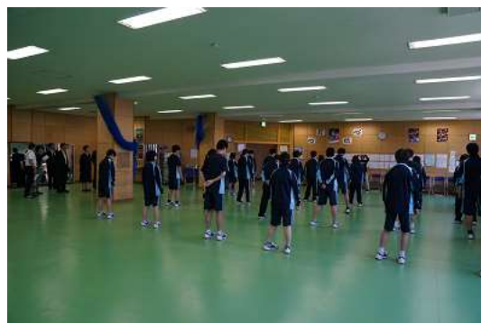
圖 4 說明：該校的體育特色課程。