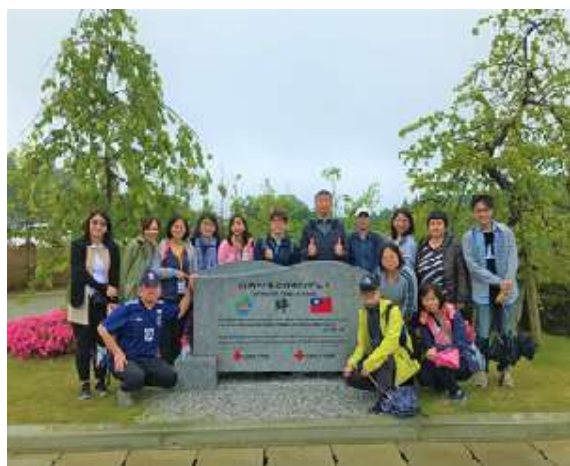
圖 27 說明：南三陸醫院紀念碑，紀錄臺灣在 311 震災後協助災區醫院重建。

劫後餘生的南三陸居民，在災後第一時間運用各地的善款，新建設一所規模龐大的現代化醫院，除作為振興地方的民生醫療支柱，更是穩住人口流失的重要條件。所以據說當時捐款最多的臺灣，在當地居民心中留下深刻的感謝、感念以及感恩，亦在醫院大門口設置了一座臺日友好紀念碑，更把我們中華民國的國旗大大的刻印在上面，並且相當積極歡迎臺灣的教育和工商團體前往當地交流，更見證這八年來的「東北復興」不僅只是口號，而是一步一腳印，努力恢復成往昔風光的艱辛歷程。