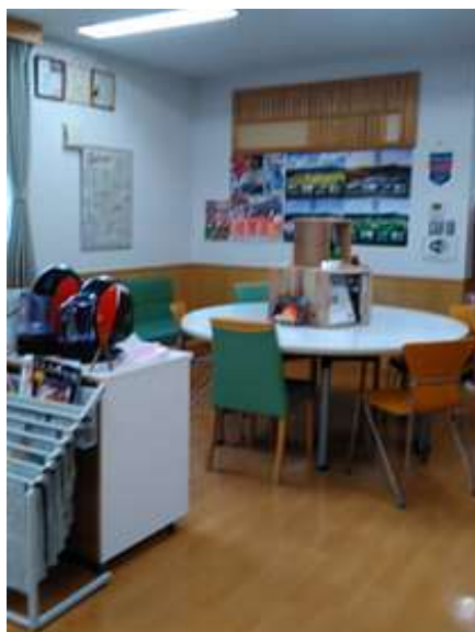
圖 24 說明：震災後，南三陸的公民會館肩負了里民交流、修學旅行的接待、以及社區活動的集會的多樣功能。