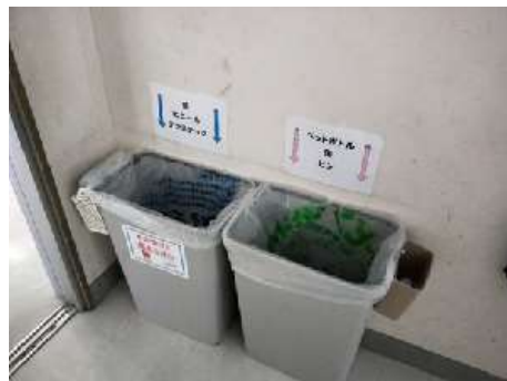
圖 10 說明：乾淨的班級垃圾桶，旁邊附有小盒子可放小瓶蓋，或者回收的乾淨塑膠袋。