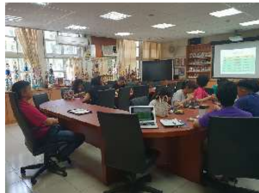
圖 32 說明：第一次準備會議影像