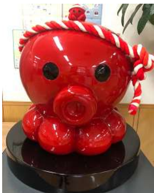
圖 29 說明：利用廢棄校舍，打造出南三陸特有的吉祥物商品「章魚君」。

無論是南三陸町觀光協會、寄宿家庭，亦或是積極利用當地材料展開特色商品製作和銷售活動的 YES 工房，都可從短暫的交流中充分感受到南三陸居民對生命樂觀的正向能量與不屈不撓的強韌意志力。無法預測的天災也許十分無情，然而他們卻能在災後立即擦乾眼淚，積極地重建家園，在與大自然的搏鬥中變得更加勇敢，也更加珍惜生命，這裡的每一個居民，眼神與嘴角都會帶著暖暖笑意，便是他們災後重生的證明。這次的參訪過程中，不單單留下深刻的印象，亦提供了未來教學現場當中，引導生命教育的最佳典範。