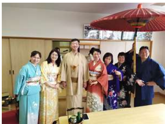
圖 19 說明：和服體驗。

最後來到茶道欣賞及和服體驗，水澤一高聘請了專業茶道及和服老師來與本校介紹。琴聲相伴之下，先了解茶道的精神和細節，而茶道一開始時，會先呈上和果子，和果子相當精緻。品茶前，要先把和果子吃完，不能等配茶才吃，如配茶吃，是不禮貌的行為。茶碗上來的時候，是花紋向外，而賓客喝茶時則要將茶碗圖案轉向 180 度向前，來表示尊敬。品茶完後，要擦拭茶碗再將圖案轉向自己。接著，體驗和服亦不如想像中簡單，除層層包裹外，調整袖口和裙襞長短及綁腰帶、收尾蝴蝶結等等細節，均是一門相當深奧的藝術。在日本，「著付師」這個行業，便是為顧客穿和服的師傅，因此項執照十分難取得，故能成為著付師要付出的努力及承受的壓力絕對是超乎常人的想像，所以在日本著付師備受尊敬。在協助我們穿和服的日本教師之中，僅僅只有一位擁有「著付師」資格，一般日本教師只能為我們處理初步的和服穿著，接著再由「著付師」為我們完成最後的收尾。她帶給我的不單單是日本傳統文化的藝術饗宴，更是處事態度的深刻體悟。老子有言：「圖難於其易，為大於其細。」小處著眼，大處著手，生活俯拾皆是教育。