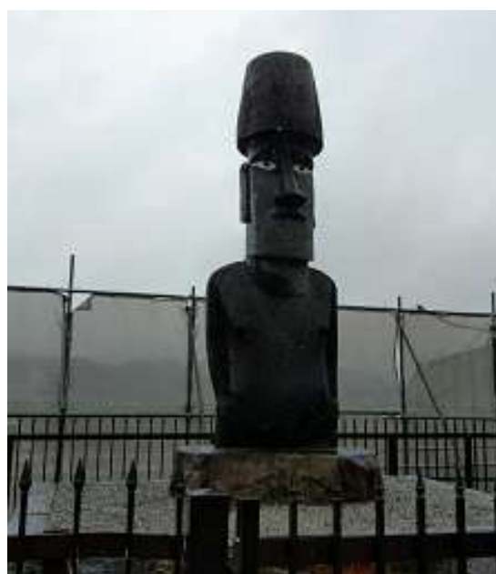
圖 30 說明：智利因 311 贈與日本的摩艾像，成為當地的特色。