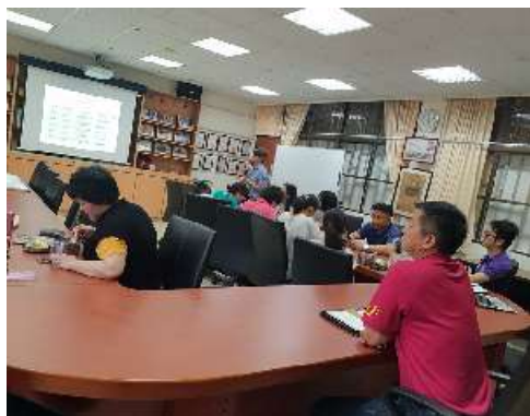
圖 31 說明：第一次準備會議影像