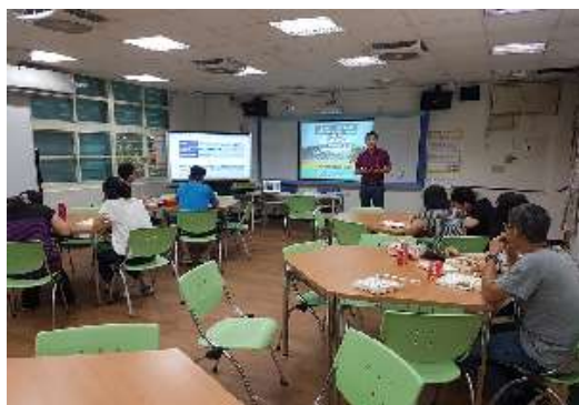
圖 33 說明：第二次準備會議影像