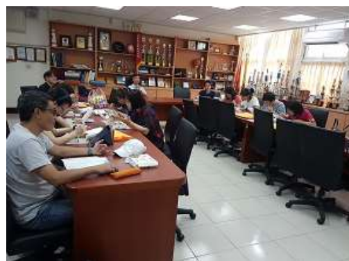
圖 36 說明：第三次準備會議影像