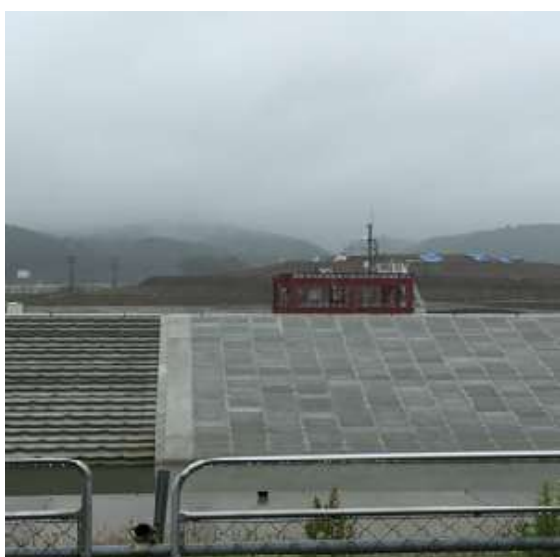
圖 23 說明：南三陸高臺，紀錄海嘯來襲時守衛人員堅守崗位的艱辛。

(震災中心簡介內容摘錄自維基百科網頁： https://zh.wikipedia.org/wiki/ )