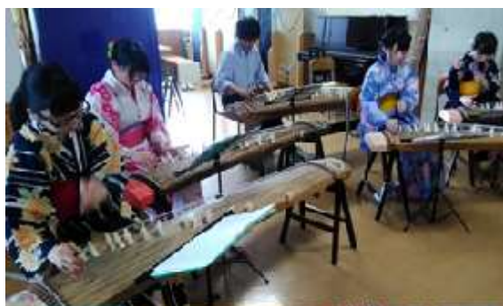
圖 21 說明：優雅有禮的古箏社員。

在班級內的交流活動更是不勝枚舉，而在跨班級或跨年級的活動當中，讓學生對自己的學校有認同感，例如學生代表選舉、高三歡送會、在牆上寫祝福言語給校內同學、社團的學長學姊制、平日練習及暑期集訓等等，都是校內搏感情的日常。讓出社會的學長姊分享心得，如準備考試、就業的抉擇過程與產業現況，亦是畢業校友相互取得動態的一種連絡方式，還有日本人會因認同母校進而任用學弟妹，提升畢業生就業的機會，若能得到畢業校友回饋，或許能籌募到許多受限於自籌款的教學活動的效能，反觀自身，除幾個班導還能從返校看看師長的畢業生口中，獲取其餘校友的近況之外，學校方面是很難得知畢業生的狀況。該校交流專刊裡竟登載著本校當年到日本交流之畢業生的文章，記載三年前交流對日後選系的影響，還有現今大學生活中的所學所思，反觀本校的國際教育行之有年，但卻僅僅只有當時的互動而無日後的追蹤。