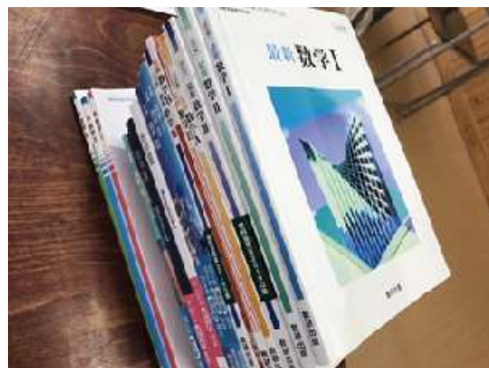
圖 18 說明：日本數學教科書。