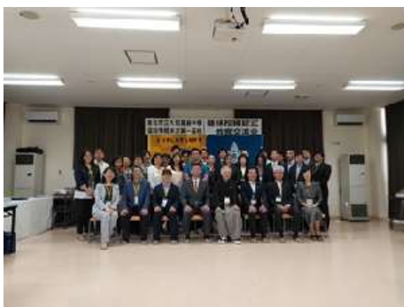
圖 11 說明：兩校參訪團交流合影。

水澤第一高校是個規模大約 360 人的學校，約為大理一個年級的人數，水澤一高跟大理高中相似的是除了普通科之外還有調理科，二者皆屬社區型高中，該校教職員人數只有 45 人，約為本校的一半，水澤高校與大理高中雙方學生因多次交換短期留學，這些年來也陸陸續續接待過幾次水澤高校的學生，覺得兩校學生氣質與樣貌都相當相似，此次參訪後發現兩校規模十分相似，連辦學理念與積極推廣國際交流、擴展學生國際視野的想法也十分雷同。