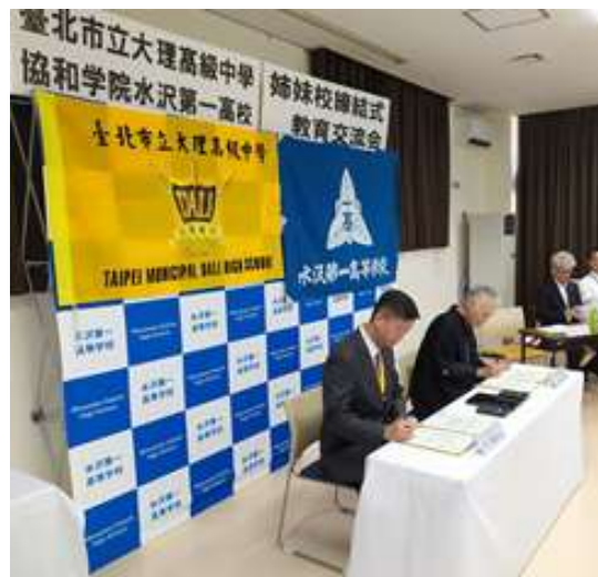
圖 12 說明：兩校締結姊妹校，雙方校長簽屬儀式。