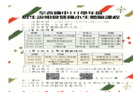
招生活動體驗課程結合