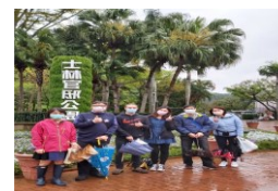
士林官邸雙語導覽