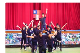
雙語跨域金英獎第一

臺北市政府教育局 111 年 6 月 19 日新聞稿，主題： 北市雙語有故事，美好改變持續發生！ （國中篇），本校導師在雙語課程推動不到 2 年後，勇敢地報名扶輪社第 1 屆「金英獎講演表藝競賽」，在表演藝術老師的幫忙下，全班一起努力、突破限制，最後榮獲第 1 名佳績。由此看到教育的無限可能，感動教育成效是實質教化情境浸潤的結果， 情境學習 是對學生影響有一生之久，是生涯發展的關鍵成功因素，建立 自信 ， 勇敢無懼 ， 承擔負責 ， 合作團隊 ， 學習積極 ， 表達順暢 ， 主動探索 ， 體驗實踐 ，更是涵育終身學習最佳典範。