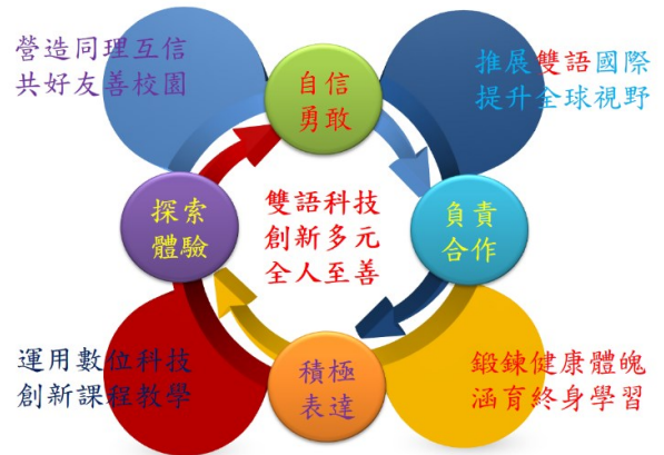
圖 1 學校願景與教育目標圖

全校若能班班建置 e 化教學設備，善用資訊科技整合設備，以學生學習為中心，創新課程教學，在主動、生動及互動教學過程中，提升學生學習成效。雲端學習時代，教育在於培養學生獨立思考及解決問題的能力，其學習資源豐沛，並不受時空限制。在教學方式隨著整體外在環境不斷創新與資源共享，可以透過雲端之共通的學習資源平臺，藉此系統讓教師在教學、評量、診斷及補救上，更加即時並歷程地了解學生的學習成效，提供學生對課程的回饋，以培養學生自主探索能力，強化親師生在學習上通暢的溝通與互動。