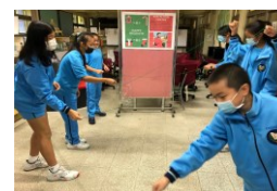
節慶活務雙語實踐