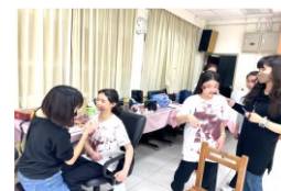
金英獎項教學協力同行