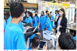
科技運用融入釣蝦活動

運用智慧教室新興科技設備，提升教學成效，引發提升學習動機，透過雲端資訊加深加廣學習，運用資訊軟硬體，於體驗活動中創新教學。