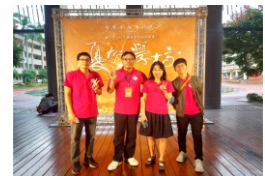
優質學校雁行團隊

雁行團隊展現的是相互支援，彼此關懷，具有共同願景目標，同心同行，以組織擴散理論，利用相關團體動力，合作關懷，辦理相關研習活動及自強活動等，以發揮正向影響力，期望同仁自願擔任兼任行政職務或導師，共同勇於承擔，營造校園同舟共濟，互信共榮氛圍。