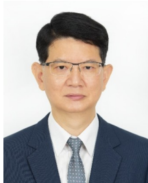
衛生局局長 黃建華

【到職日】113年08月12日 【主要學歷】國立臺灣大學臨床醫學研究所博士、醫學系畢業。 【主要經歷】臺大醫院內科部主治醫師。臺灣大學醫學院急診醫學科主任。臺大醫院急診醫學部主任。臺灣大學醫學院急診醫學科教授。 【考 試】 【通訊處】臺北市市府路1號3樓東南區 【公務電話】27208889 轉 7154