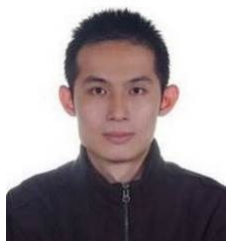
都市更新處處長 詹育齊

【到職日】113年07月23日 【主要學歷】國防醫學院醫學博士。 【主要經歷】三軍總醫院耳鼻喉頭頸外科部主任。國防部軍醫局衛勤保健處及醫務管理處處長。國軍花蓮總醫院院長。陸軍後勤指揮部軍醫處處長。國軍臺中總醫院少將院長。三軍總醫院少將院長。國防部軍醫局副局長。國防醫學院教授。臺北榮民總醫院桃園分院院長。 【考 試】79年醫師考試檢覈及格。 【通訊處】臺北市大同區鄭州路145號 【公務電話】25553000轉2000