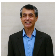
交通局局長 謝銘鴻