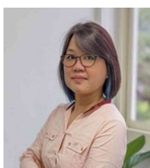
社會局局長 姚淑文