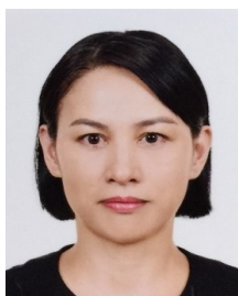
原民會 主任委員 巴干·巴萬 Bakan Pawan

【到職日】111年12月25日 【主要學歷】國立政治大學民族學系碩士。國立臺北大學金融與合作經營學系畢業。 【主要經歷】臺北市政府原住民族事務委員會約僱人員、秘書。 【考試】 【通訊處】臺北市市府路1號探索館5樓 【公務電話】27205981