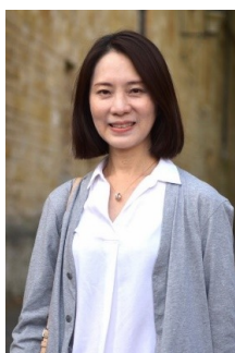
財政局局長 胡曉嵐

【到職日】112年10月13日 【主要學歷】國立政治大學地政學系碩士、地政學系學士。 【主要經歷】臺北市政府財政局股長、專員、科長。財政部國有財產署專門委員、副組長。臺北市政府財政局副局長。 【考 試】105年薦任公務人員晉升簡任官等訓練及格。90年公務人員高等考試三級考試地政類科及格。90年特種考試臺灣省及福建省基層公務人員考試三等考試及格。89年專門職業及技術人員普通考試不動產經紀人考試及格。88年專門職業及技術人員高等考試都市計畫師考試及格。85年特種考試土地登記專業代理人考試及格。 【通訊處】臺北市市府路1號8樓中央區 【公務電話】27206011