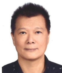
文化局局長 蔡詩萍

【到職日】113年09月27日 【主要學歷】國立中興大學公共政策研究所碩士。國立成功大學都市計畫學系畢業。 【主要經歷】臺北市都市更新處總工程司、副處長。臺北市政府都市發展局副局長。 【考 試】104年薦任公務人員晉升簡任官等訓練及格。100年公務人員升官等考試薦任考試都市計畫技術類科及格。82年專門職業及技術人員高等考試都市計畫師考試及格。 【通訊處】臺北市市府路1號9樓西南區 【公務電話】27258237