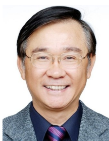
教育局局長 湯志民

【到職日】112年10月13日 【主要學歷】國立政治大學地政學系碩士、地政學系學士。 【主要經歷】臺北市政府財政局股長、專員、科長。財政部國有財產署專門委員、副組長。臺北市政府財政局副局長。 【考 試】105年薦任公務人員晉升簡任官等訓練及格。90年公務人員高等考試三級考試地政類科及格。90年特種考試臺灣省及福建省基層公務人員考試三等考試及格。89年專門職業及技術人員普通考試不動產經紀人考試及格。88年專門職業及技術人員高等考試都市計畫師考試及格。85年特種考試土地登記專業代理人考試及格。 【通訊處】臺北市市府路1號8樓中央區 【公務電話】27206011