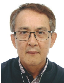
客委會 主任委員 吳文德

【到職日】111年12月25日 【主要學歷】國立政治大學民族學系碩士。國立臺北大學金融與合作經營學系畢業。 【主要經歷】臺北市政府原住民族事務委員會約僱人員、秘書。 【考試】 【通訊處】臺北市市府路1號探索館5樓 【公務電話】27205981