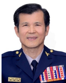
警察局局長 李西河