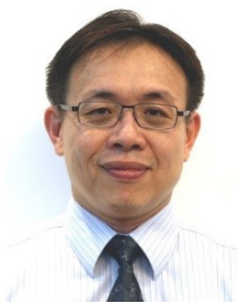
公共運輸處處長 李昆振

【到職日】113 年 07 月 16 日 【主要學歷】國立交通大學交通運輸管理學系碩士。 【主要經歷】臺北市政府交通局技正。臺北市停車管理工程處副總工程司。臺北市政府交通局科長。臺北市停車管理工程處總工程司。臺北市停車管理工程處副處長。 【考 試】106 年薦任公務人員晉升簡任官等訓練及格。 【通訊處】臺北市松德路 300 號 7 樓 【公務電話】27599727