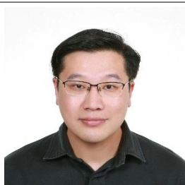
內湖區公所 區長 陳旭裕

【到職日】114 年 09 月 01 日 【主要學歷】私立中國文化大學行政管理學系畢業。 【主要經歷】臺北市政府民政局股長、專員。臺北市士林區公所主任秘書、副區長。臺北市中正區公所區長。 【考 試】109 年薦任公務人員晉升簡任官等訓練。98 年公務人員升官等考試薦任考試。81 年全國性公務人員普通考試。 【通訊處】臺北市南港路一段 360 號 6 樓 【公務電話】27831343 轉 600