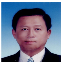
消防局局長 莫懷祖

【到職日】111 年 12 月 25 日 【主要學歷】國立臺灣科技大學建築學類博士。東海大學公共事務學系碩士。中央警官學校消防學系畢業。 【主要經歷】內政部消防署科長。臺北市政府消防局大隊長、科長、技正。桃園市政府消防局副局長。內政部消防署組長。 【考 試】96 年警正警察人員晉升警監官等訓練及格。76 年特種考試警察人員考試乙等考試消防警察人員。 【通訊處】臺北市松仁路 1 號 5 樓 【公務電話】27297668 轉 6000