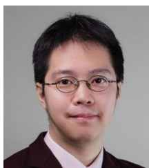
資訊局局長 趙式隆

【到職日】114 年 03 月 18 日 【主要學歷】國立中興大學法律學系畢業。 【主要經歷】臺北市政府民政局科長、專門委員。臺北市信義區公所區長。臺北市松山區公所區長。臺北市政府勞動局副局長。 【考 試】102 年薦任公務人員晉升簡任官等訓練及格。88 年公務人員高等三級考試一般民政類科及格。83 年全國性公務人員普通考試戶政類科及格。 【通訊處】臺北市南京東路 4 段 10 號 【公務電話】25702330 轉 5201