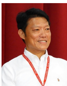
中正區公所區長 方越琦

【到職日】113 年 08 月 06 日 【主要學歷】私立中國文化大學觀光事業學系大學畢業。 【主要經歷】臺北市內湖區公所辦事員、課員。臺北市政府研究發展考核委員會組員、助理研究員、副研究員、視察、秘書、主任、組長、研究員。 【考 試】88 年公務人員高等考試三級考試一般民政類科及格。 【通訊處】臺北市中山區松江路 367 號 6 樓 【公務電話】25037916