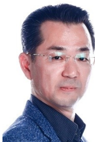
士林區公所區長 林士斌

【到職日】115 年 01 月 29 日 【主要學歷】國立政治大學行政管理碩士。 【主要經歷】行政院人事行政總處專員。臺北市政府主計處主任。臺北市政府民政局主任。 【考 試】106 年薦任公務人員晉升簡任官等訓練。87 年公務人員高等考試三級考試人事行政類科及格。 【通訊處】臺北市內湖區民權東路六段 99 號 5 樓 【公務電話】27925855