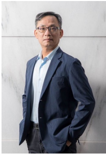
都委會主任委員 (副市長兼任) 張溫德

【到職日】115年03月10日 【主要學歷】國立成功大學都市計劃研究所碩士、都市計劃學系畢業。 【主要經歷】臺北市政府都市發展局副總工程司、專門委員。臺北市都市更新處總工程司。新北市政府城鄉發展局副局長。新北市政府都市更新處處長。國家住都中心執行長。內政部參事。臺北市政府副秘書長。 【考試】97年薦任公務人員晉升簡任官等訓練及格。85年公務人員高等考試三級考試(學士)都市計畫類科及格。81年專門職業及技術人員高等考試都市計畫技師及格。 【通訊處】臺北市市府路1號11樓西北區 【公務電話】27258669