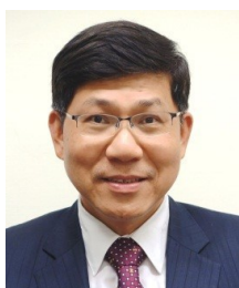
主計處處長 鄭瑞成