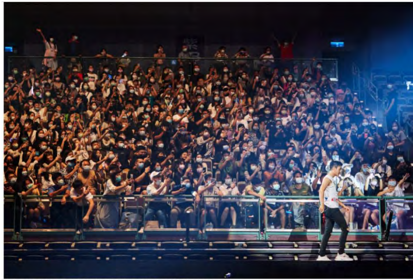
Taiwan Just Had Its First 10,000-Person Arena Concert Since the Pandemic Began. Here's What It Was Like to Be There

四、因應「2021臺北市跨年活動」為兼顧防疫及落實實聯制，實體跨年活動舞台周邊實施入場人數管制，並透過本系統進行入場登記，入場人次亦即時整合至儀表板以管控入場人數。經統計共2萬0,702人次於跨年活動當日透過本系統進行實聯制登記。