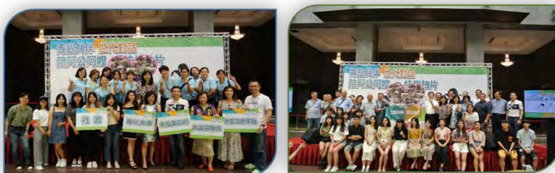
說明：衛政、民政、社政等單位、未來合作學校及 NPO 團體舉行共同合作儀式