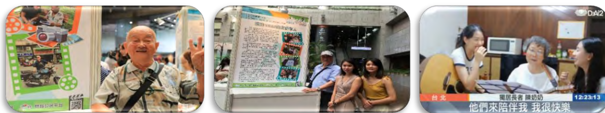
說明：參與本計畫之學生及獨居長者參加記者會(左、中)，並現場播放青銀共伴影片(右)