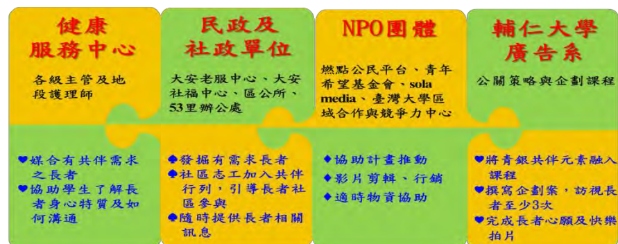
圖1 跨域合作單位及任務