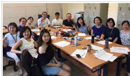
圖3 定期開會 滾動式修正計畫

研商青銀共伴計畫內容，固定每月開會一次，討論及修正計畫執行方向，並依需要隨時在 LINE 群組討論。