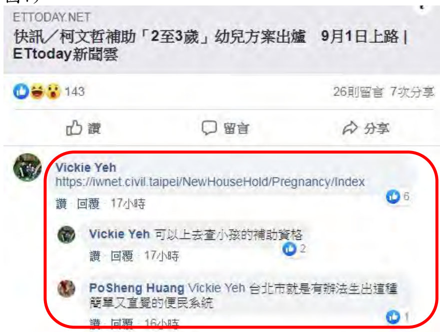
圖6—臉書社團新聞分享上民眾留言