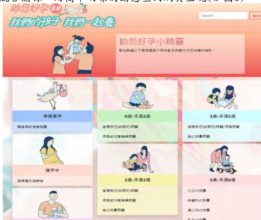
圖3—「助您好孕小精靈」動態查詢系統首頁

1. 懶人包屬於靜態文件，對已確定小孩送托機構及照顧方式的家長來說，最好能快速直接獲取契合自身條件的答案，針對這種需求，民政局全國首創「助您好孕小精靈」動態查詢系統( https://iwnet.civil.taipei/NewHouseHold/Pregnancy/Index ) 統整本市與中央學齡前育兒補助，將複雜的排列組合與競合關係，用簡單明瞭的動態查詢網頁呈現(如圖3)。