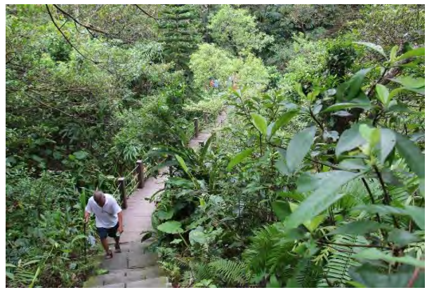
附件6-14 - 濕地生態觀察區