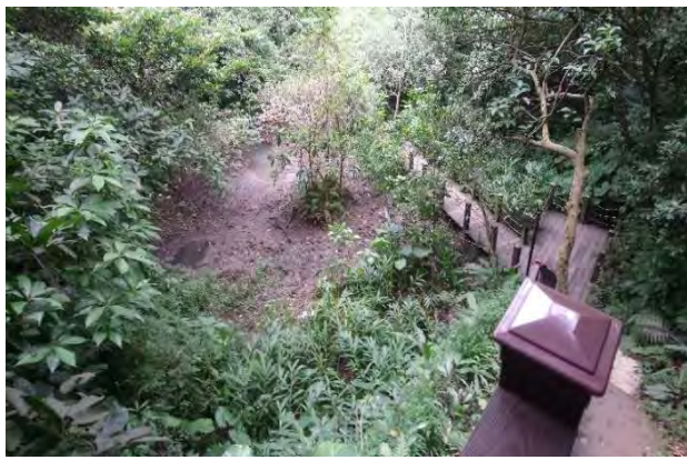
附件6-13 - 濕地生態觀察區