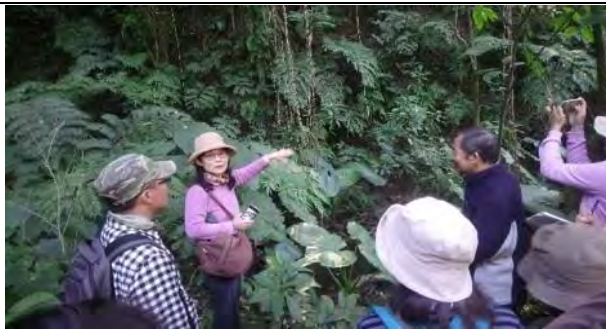
附件8-1 - 專家學者會議