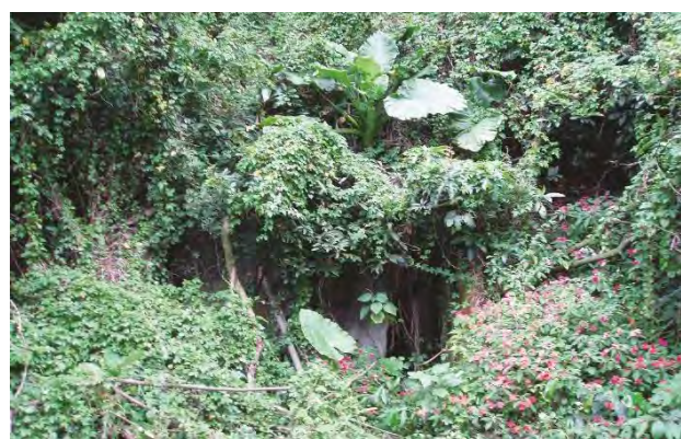
附件6-7 - 軍事涵洞原貌