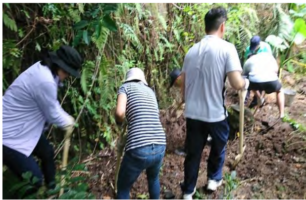
附件6-11 - 蝴蝶生態棲地整理