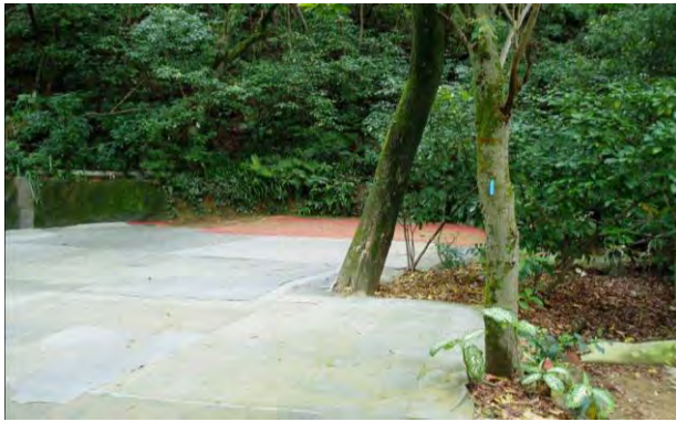
附件6-17 - 戀戀蟬聲區施工前