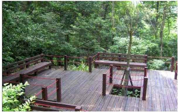
附件7-軍方大興土木破壞生態，居民催生富陽公園，與官方、團體跨域合作