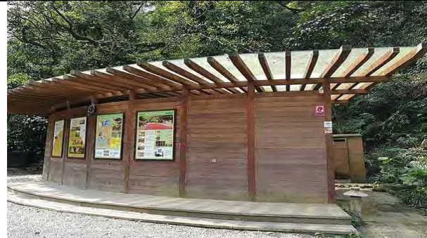
附件8-4 - 新設公廁兼互動式解說迴廊，以減少建築物的量體。