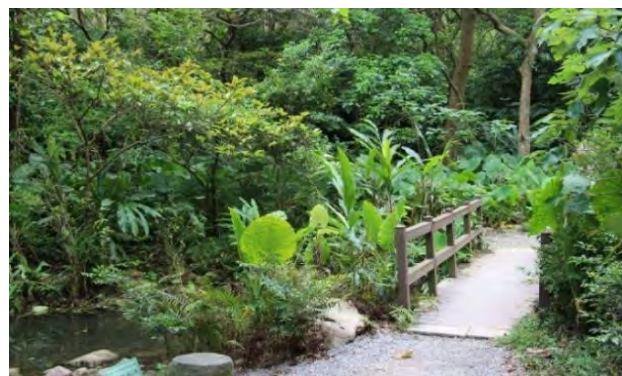
附件6-5 - 入口(生態水道)