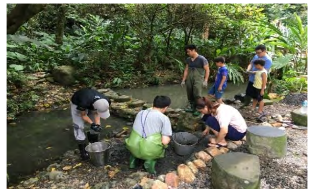
附件6-6 - 生態水道清除淤積泥沙