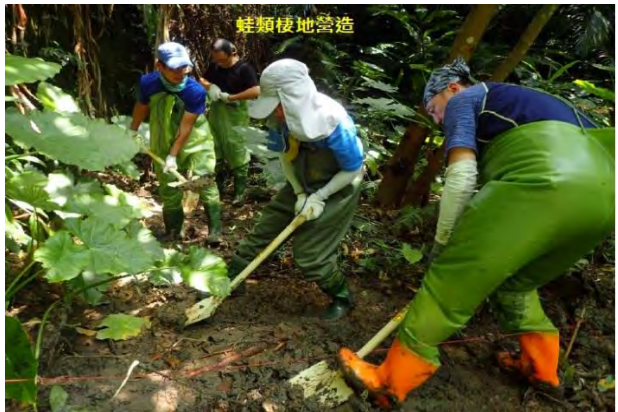
附件6-15 - 蛙類棲地營造