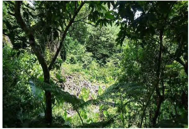
附件6-10 - 次生林相觀察區復原