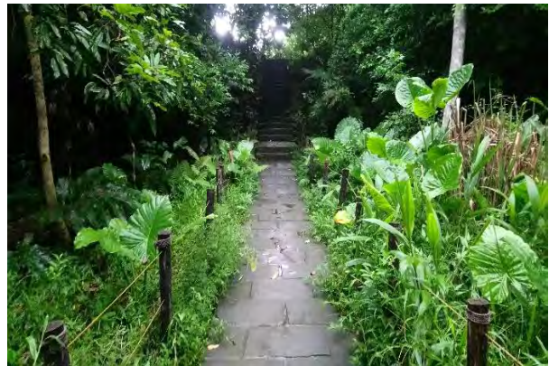
附件6-12 - 蝴蝶生態棲地裸地圈護