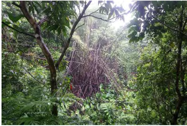
附件6-9 - 次生林相觀察區雜亂