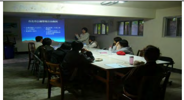
附件8-2 - 荒野工於社區中心受訓