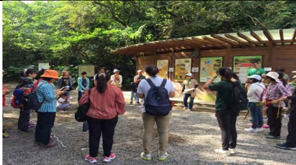
附件8-3 - 導覽解說設施結合志工及生態導覽服務，提供教育學習空間