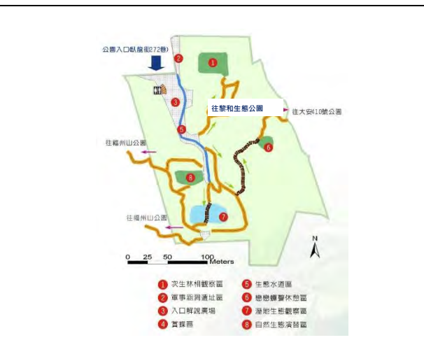
附件9-1 - 富陽公園園區獨特性分區