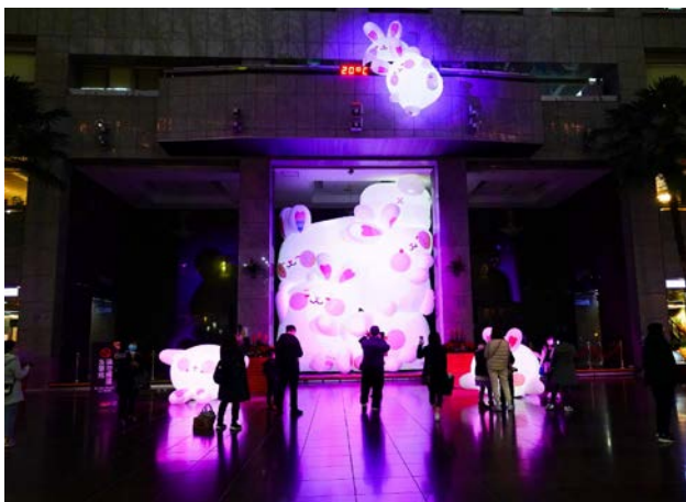
兔兔餐包(未來展區)