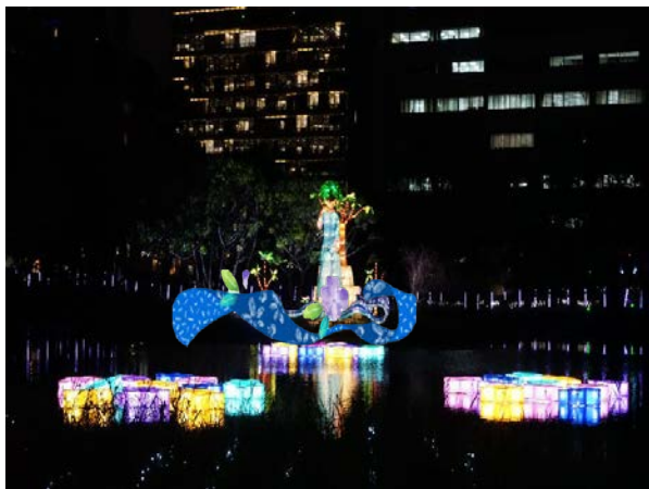
島上的女人樹(源展區)