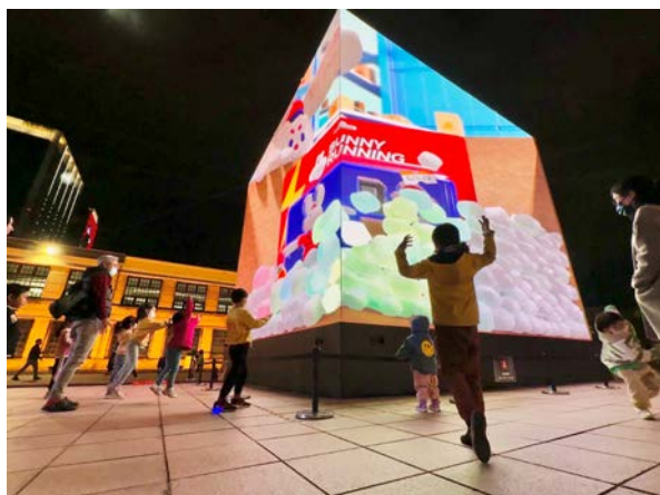
松菸副燈互動裝置