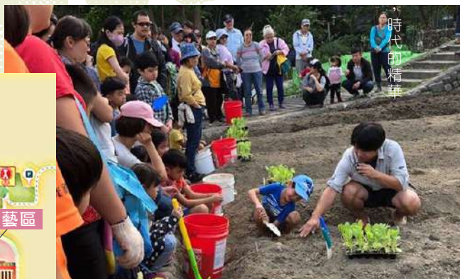
(右圖) 臺北客家農場規劃了多處田地，開放給民眾認養種植蔬菜植物。