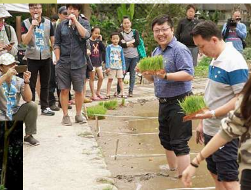
（左圖）臺北客家農場舉辦之「農活時節曆」依循節氣設計諸多相關活動，如：驚蟄 x 婦女節、春分 x 跟著春神來找茶、夏至前的農場生活圈等等。參與民眾年齡跨及兒童、年輕、中年、老年族群，讓人們在城市中也能體驗在鄉村的生活。

「田園城市」的最終目的，就是在都市裡形成循環農業的樣態，台北市客家文化基金會經營的臺北客家農場，從客家出發，一鏟一鋤打造綠色地景，也一點一滴找回人跟人聚合的能量。