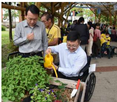
（中圖）臺北市政府客家事務委員會主委徐世勳參與了「109年度一期稻作蒔田」活動，與民眾一起在都會中體驗種稻的樂趣。