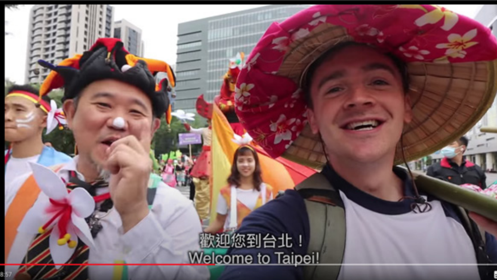
#台灣 #小貝米漿 #客家 台北路上為什麼竟然有那麼多人？小貝體驗「臺北」客家義民嘉年華！