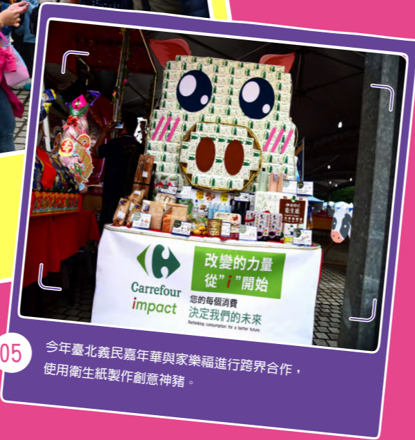
05 今年臺北義民嘉年華與家樂福進行跨界合作，使用衛生紙製作創意神豬。