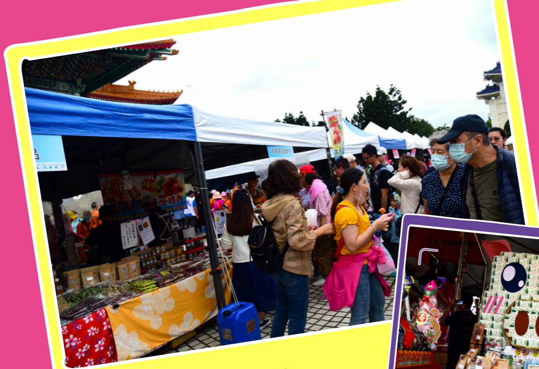
04 藝文廣場裡的攤位販售各式客家美食與商品，吸引滿滿人潮參觀。

無論是真實或創意，也希望能看見更多以食物製作的供品。因為傳統祭祀以「食物」來跟神明做情感上的連結，祭祀後的分食也是神明福氣的傳遞。信仰與環保的權衡，還是要回到祭祀本身，期許民俗文化與時俱進地演化。