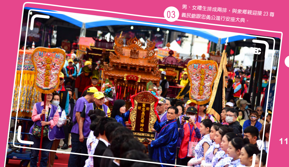
男、女禮生排成兩排，與眾鄉親迎接 23 尊義民爺跟忠勇公進行安座大典。