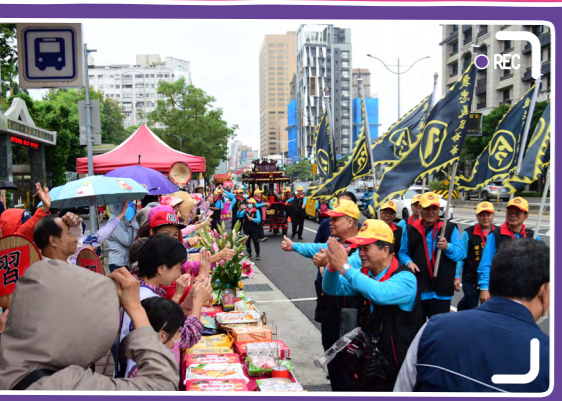
臺北客家義民嘉年華第一日迎神遶境時，遶境的社團與沿途香案的鄉親熱情打招呼。