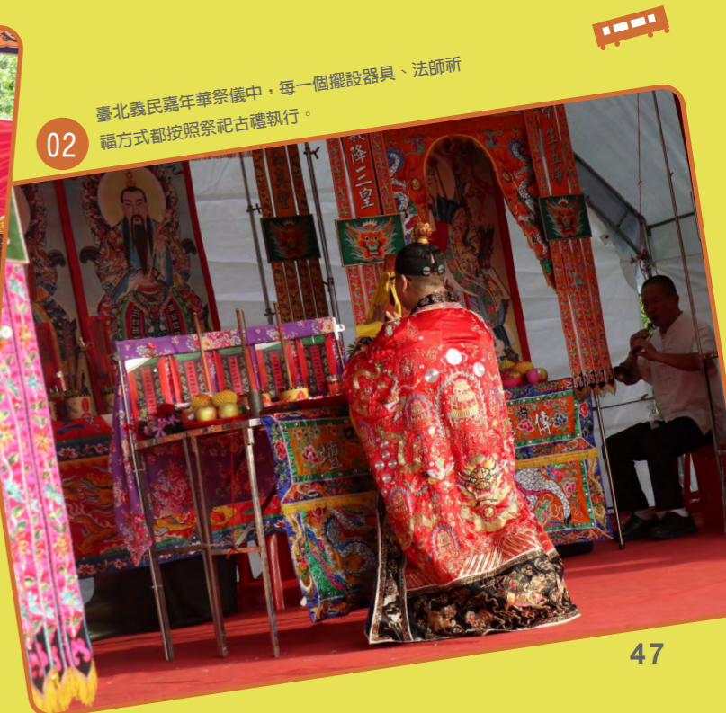
02 臺北義民祭年華祭儀中，每一個擺設器具、法師祈福方式都按照祭祀古禮執行。