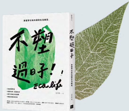
01 《不塑過日子：家裡零垃圾的極簡生活練習》結合有趣圖解分享涂月華的環保妙招，是一本人人都能實踐的減塑寶典。