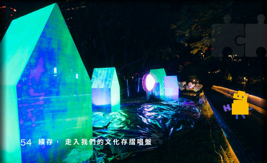
54 續存，走入我們的文化存摺唱盤