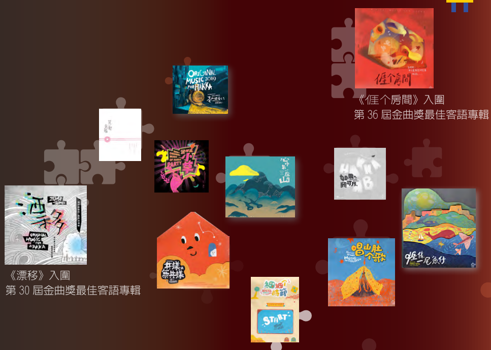
《漂移》入圍 第 30 屆金曲獎最佳客語專輯