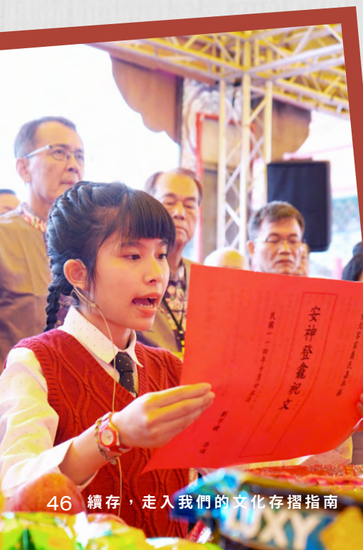
46 續存，走入我們的文化存摺指南

有孩子拉著母親的手，走上主祭臺，在 23 尊義民爺與忠勇公牌位前，隨著媽媽懵懂地向神明們行禮。祭臺下，「哈哈糖親子專區」故事屋內，大哥哥、大姐姐們頂著可愛的魚娃娃，用生趣的華語和客語演繹臺北客家出版品《佢係一尾魚仔》的故事，孩子們隨故事起伏睜大眼睛，又跟著帶動跳一起手舞足蹈。舞臺另一端，客家大戲的青年演員帶來精湛演出；臺下一群孩童盯著翻滾的身段，看得入迷。祭典的儀式感與歡快，就這樣悄悄植入年輕一代的記憶中。