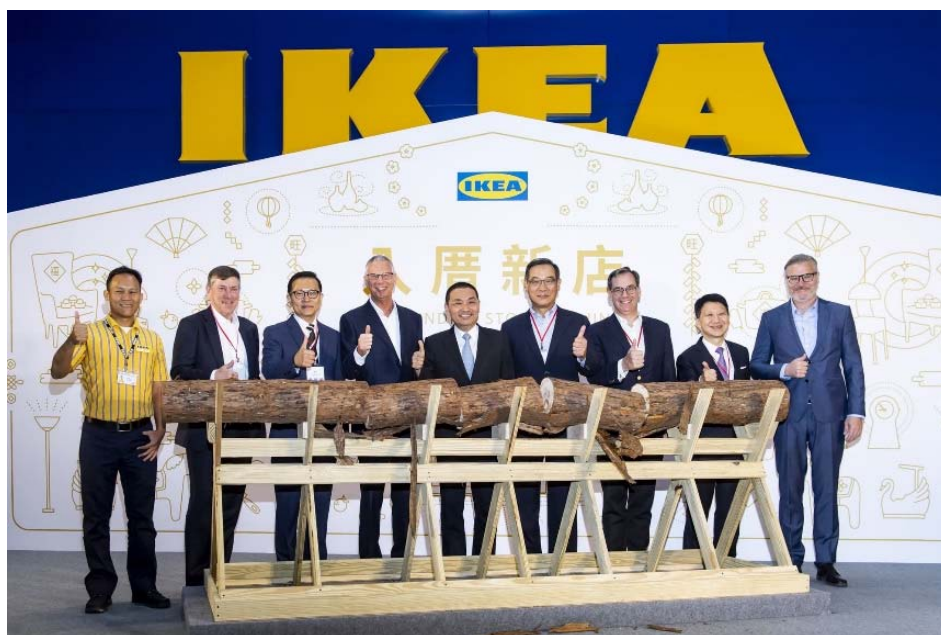
IKEA新店開幕，舉辦瑞典鋸木儀式

有關IKEA新店開幕後，商場開始正常營運，本局亦可開始收取租金，除帶給本局土地開發基金每個月約1,170萬元租金收入、創造300個就業機會及增加營業稅收外，並可帶動週邊商業機能發展外，同時可提高捷運小碧潭站旅運量，進而增進全民的福祉。