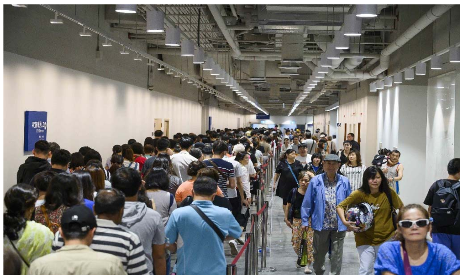
開幕當日排隊人潮