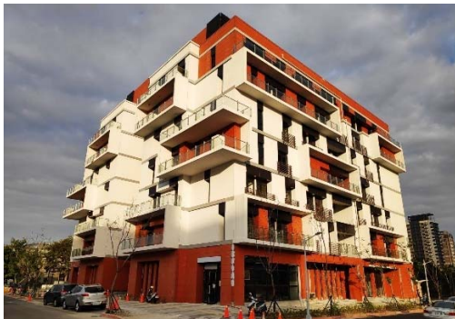
圖二、大樓外觀現況