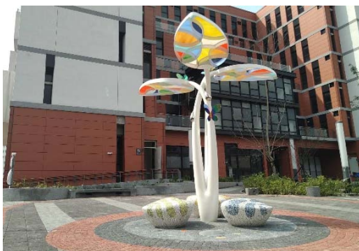
圖四、公共藝術現況