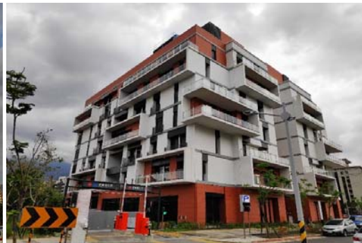
圖三、大樓外觀現況