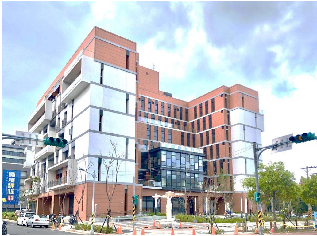
圖一、大樓外觀現況