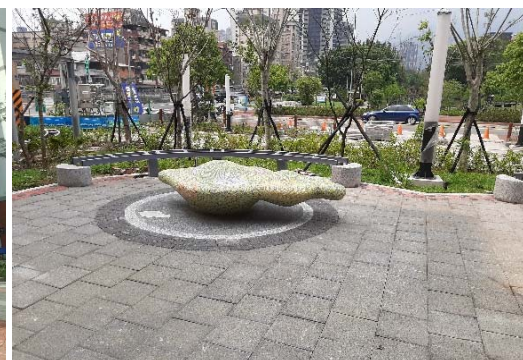
圖五、公共藝術現況